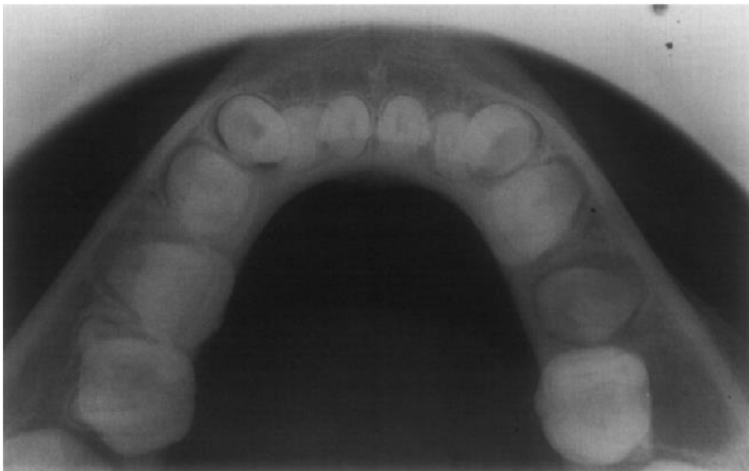
Kyste mandibulaire infecté au niveau de la première molaire à droite, vue occlusale, (Pompura et al 1997)

Il est recommandé d'associer, au panoramique dentaire, la réalisation d'un cliché rétro alvéolaire. Le diagnostic est difficile d'autant plus si la lésion est de faible dimension et si le patient ne présente aucune symptomatologie.