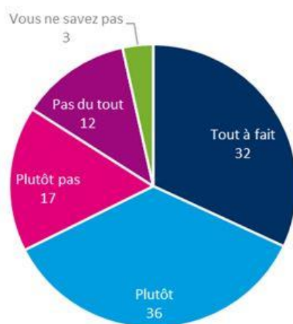
Figure 1 : L'orientation a-t-elle été une source de stress ? (En %) (Cnesco 2018 p.28)

L'orientation scolaire et professionnelle est source de stress chez l'adolescent, notamment ceux en difficulté qui doutent de leurs capacités et ceux qui manquent d'aide et de soutien (Lacoste, 2005). Pour deux tiers des élèves l'orientation représente une source de stress, notamment chez les enfants d'ouvriers et employés (Cnesco, 2018). Le stress est compris ici comme « l'ensemble des perceptions d'impuissance et de malaise qui envahissent l'individu face à des événements difficiles à maîtriser » (Lacoste, 2005). Ces difficultés rencontrées peuvent être multiples. Par exemple, le goût personnel pour un métier ou un secteur est le critère le plus important dans le choix d'orientation des élèves en général. Avoir un métier précis en tête lors du choix d'orientation limite les probabilités de stress. Cependant, en enseignement professionnel plus que dans le général, les élèves privilégient une entrée rapide dans l'emploi par des formations géographiquement proches, limitant alors l'influence des goûts personnels dans leurs choix d'orientation. L'éloignement géographique, la durée et donc le coût des études contraignent un élève sur trois en enseignement professionnel à renoncer à leurs aspirations (Cnesco, 2018 p.6). Ainsi, les élèves scolarisés en Segpa, du fait de leurs caractéristiques sociales et une orientation dirigée