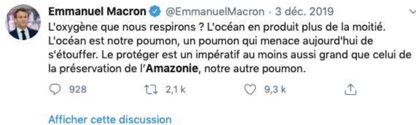
Tweet d'Emmanuel Macron, capture d'écran

Le septième tweet a été écrit le 3 décembre 2019. Soit deux mois après le dernier. Il compte 9 300 « j'aime » et associe la protection des océans à la protection de l'Amazonie, « notre autre poumon ».