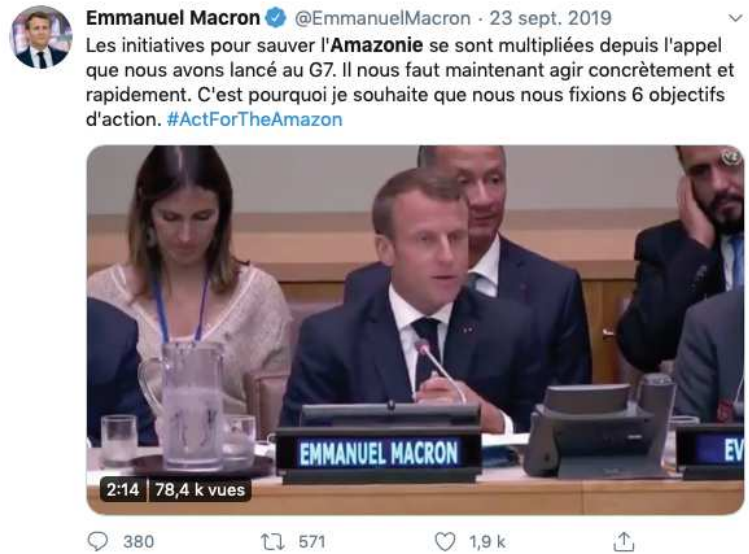
Tweet d'Emmanuel Macron, capture d'écran

Le sixième tweet reprend 2.33 minutes de la conférence précédente. Emmanuel Macron y décrit les différents aides internationales pour préserver l'Amazonie ainsi que les six objectifs qu'il établit pour selon lui, sauver l'Amazonie et la développer.