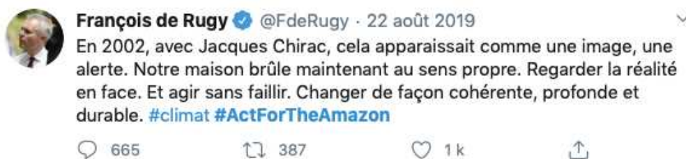
Tweet de François de Rugy, capture d'écran