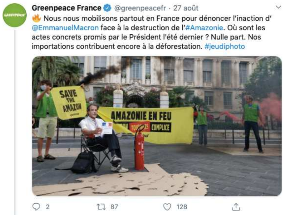
Capture d'écran du compte Twitter de @greenpeacefr. Ici, action à Nice.

Macron en noir et blanc sur fond de la forêt en feu, avec toujours sur fond jaune écrit en noir, le mot « complice ! » (annexe 10.B).