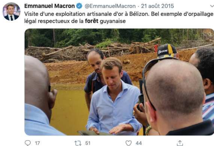
Tweet d'Emmanuel Macron, capture d'écran

En octobre 2017, revoyant sa position à la baisse, il s'est prononcé sur « un projet qui peut être bon pour la Guyane » puis en mai 2019, il a annoncé avant l'annonce officielle de l'abandon du projet que celui-ci n'était « pas compatible avec une ambition écologique en l'état actuel des choses ». Ce revirement en mai 2019, a lieu suite aux nombreuses manifestations de la jeunesse à partir de l'automne 2018 et avant les échéances législatives européennes. Ainsi, l'abandon de la Montagne d'or qui faisait suite à l'abandon de l'aéroport Notre-Dame-des-Landes, a donné l'image d'un président préoccupé par l'environnement et la protection de la biodiversité. Il peut ainsi être crédible en tant que personnalité politique engagée dans la protection de la forêt amazonienne puisque lui-même a refusé qu'une mine industrielle soit construite sur le territoire français. S'il avait autorisé le début de l'exploitation, sa communication contre les feux de forêt aurait été différente car il n'aurait pu justifier que la forêt française est protégée des grands projets industriels. Dans son interview sur France 2 , Emmanuel Macron qui se veut le plus pédagogue et le plus transparent possible peut donc reprocher au président Bolsonaro « des projets économiques contraires à l'intérêt de la forêt amazonienne », puisque lui-même a abandonné un projet contraire à « l'intérêt » de la forêt.