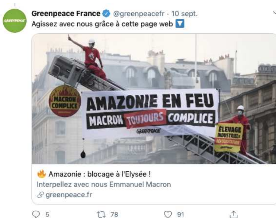
Action de Greenpeace devant l'Elysée

Le cinquième temps a consisté à adresser à Emmanuel Macron, le 16 septembre 2020, une lettre ouverte pour qu'il abandonne l'accord de libre échange entre les pays de l'Union européenne et les pays du Mercosur 51 . Cette lettre a été signée par trente-neuf personnalités politiques et associatives.