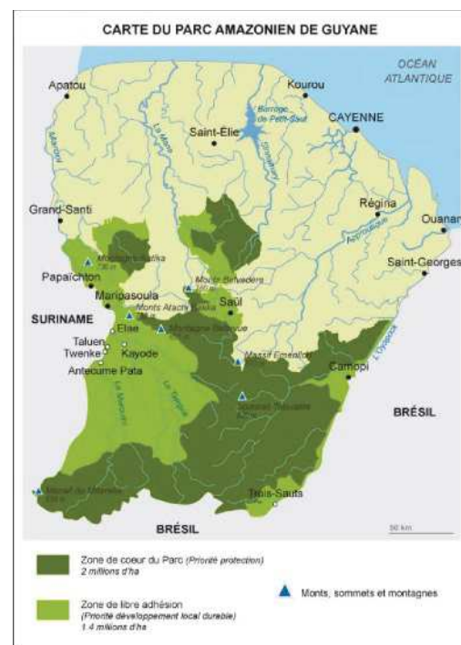
Situation de la Guyane en Amazonie

Si la Guyane n'est pas touchée par les feux de forêt, il ne s'agit pas moins d'une région dont la biodiversité est en danger. Le développement urbain rapide, l'ex-