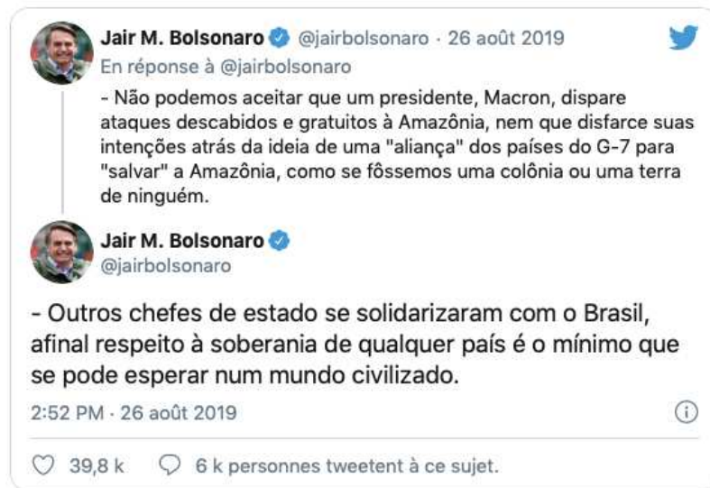
Tweet de Jair Bolsonaro, capture d'écran

Emmanuel Macron condamne les propos « extraordinairement irrespectueux » à l'encontre de son épouse et souhaite que le « grand » peuple brésilien est un président à la hauteur de ses fonctions. Jair Bolsonaro réagit à nouveau le lundi 26 août par deux tweets. Le premier accuse le président français d'une attitude coloniale :