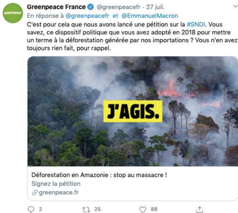
Compte Twitter de @greenpeacefr, capture d'écran

Ainsi, le premier tweet de la nouvelle campagne de Greenpeace n'interpelle pas directement Emmanuel Macron mais le gouvernement. Il faut attendre le tweet du 27 juillet (ci-dessus) pour que toute la campagne ait pour cible ce que Greenpeace considère comme de l'inaction et des promesses non tenues de la part du président. Le tweet est une réponse au compte Twitter d'Emmanuel Macron et son ton est familier et ironique, avec l'utilisation d'une question rhétorique et l'expression « pour rappel ». Greenpeace n'utilise pas encore comme arme pour sa campagne ce qu'à pu dire Emmanuel Macron, mais elle vise la Stratégie nationale de lutte contre la déforestation importée (SNDI). Un outil politique et juridique pour lutter contre la déforestation importée dont Greenpeace défend qu'il s'agit d'un « document pétri de bonnes intentions... Qui sont restées lettre morte. » 52