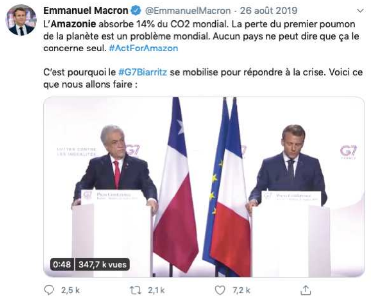
Tweets d'Emmanuel Macron, capture d'écran

Le troisième tweet comme le quatrième montrent la conférence de presse conjointe avec le président Pinera. Le troisième est accompagné du hashtag #ActForTheAmazon et présente l'initiative pour l'Amazonie. Le quatrième associe la protection de la forêt subsaharienne, à la protection de la forêt amazonienne. Il est accompagné de #G7Biarritz.