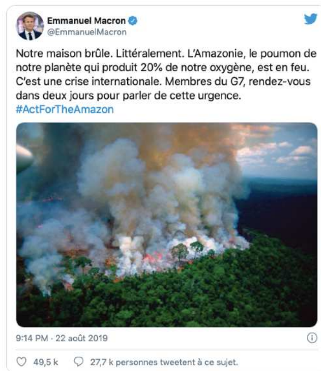
Tweet d'Emmanuel Macron, capture d'écran

Les relations diplomatiques entre Emmanuel Macron et Jair Bolsonaro ont été des plus difficiles au cours de l'été 2019. Alors que la situation était mauvaise entre les deux présidents (liée à l'accord commercial entre les pays du Mercosur et l'Union européenne), les relations se sont envenimées suite au tweet d'Emmanuel Macron alarmant sur les feux de forêts en Amazonie.