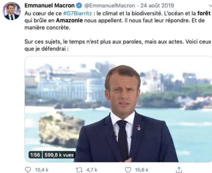
Tweet d'Emmanuel Macron, capture d'écran

ailleurs » prononcé par Jacques Chirac lors de l'ouverture de son discours devant l'assemblée plénière du IV e Sommet de la Terre le 2 septembre 2002 à Johannesburg, en Afrique du Sud.