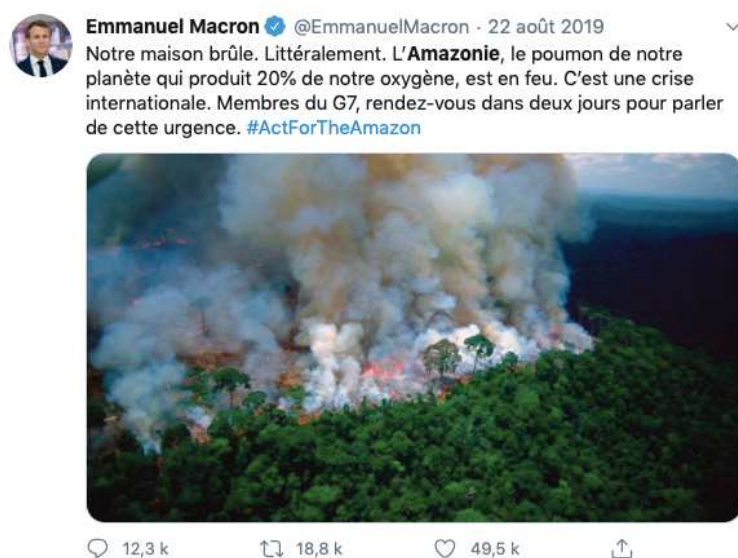
Tweet d'Emmanuel Macron, capture d'écran

Nous allons établir le fil des publications concernant l'Amazonie du premier tweet du président sur le sujet au dernier tweet. Le premier date du 22 août 2019. Il n'y a eu donc aucun autre tweet sur le sujet avant ce tweet qui a énervé le président Bolsonaro. Nous pouvons en conclure à cet égard que le sujet amazonien n'a eu d'intérêt pour une communication sur les réseaux sociaux qu'à partir de la médiatisation des feux de forêts.