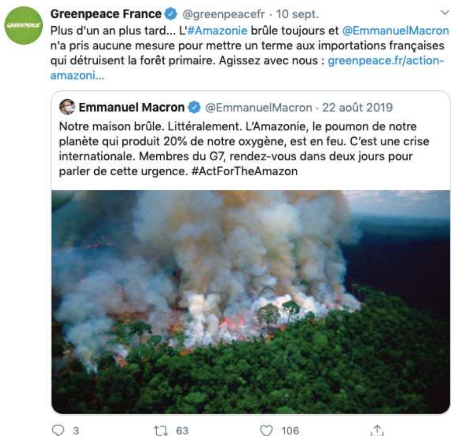
Tweet d'Emmanuel Macron, capture d'écran

Pour cette dernière partie nous avons choisi de travailler sur la communication des associations selon lesquelles l'inaction du président de la République sur la protection de la forêt amazonienne est criblante et ne correspond pas à la communication et aux promesses de 2019. Nous avons sélectionné une association tout particulièrement, Greenpeace France, qui a organisé une grande campagne contre la politique d'Emmanuel Macron du 24 juillet au 10 septembre 2020. Cette campagne est d'autant plus intéressante pour ce mémoire qu'elle vise Emmanuel Macron en personne et non le gouvernement ou l'Etat. Car en effet, elle reprend les propos et la communication d'Emmanuel Macron de la fin d'été 2019 et découd ses promesses.