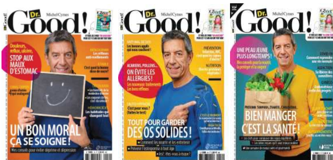
Figure 1 : Couverture des numéros 15, 16 et 17 de Dr Good !

Sur la couverture du numéro 17 (cf. figure 1), ayant pour thématique la nutrition avec le titre « Bien manger, c'est la santé 45 », on voit par exemple Michel Cymes porter un sac de papier kraft rempli de légumes verts et rouges ayant pour signifié, la nourriture saine. Le sourire du médecin, peut renvoyer dans ce contexte au signifié du bien-être physique et/ou mental lié à une alimentation équilibrée.