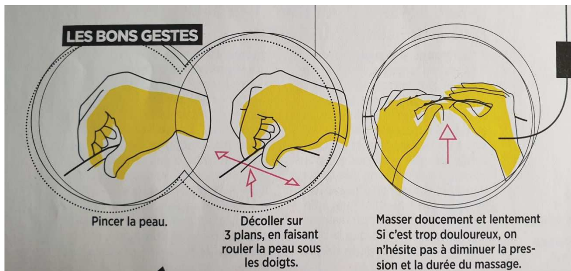
Figure 5 : « Les bons gestes » pour masser une cicatrice. Numéro 16, p.120

Dans le cadre d'une information théorique et médicale aussi bien que dans celui des conseils pratiques pour améliorer sa santé et sa forme, les schémas et dessins sont omniprésents dans les différents numéros du magazine. Ils permettent aussi de rendre la maquette plus équilibrée en termes de texte et d'images en cherchant à capter certains lecteurs plus sensibles à l'image qu'au texte.