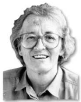
Elisabeth KÜBLER ROSS