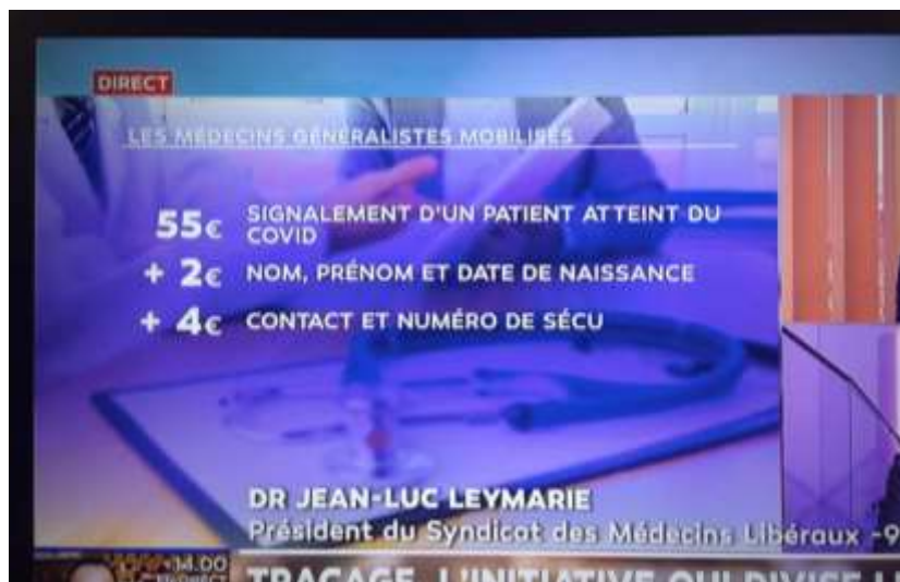
Figure 5 : Covid-19 : prime pour signalement

Source : Libération, « Covid-19 : finalement, les médecins ne bénéficieront pas d'une prime au signalement des cas contacts », 2020.