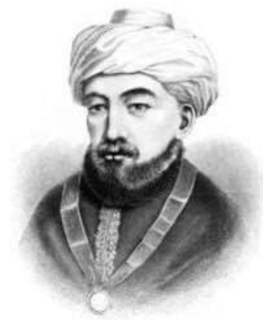
Figure 3 : Moïse Maïmonide (1138-1204), Moyen Âge

la confiance des malades en son Art, « elle est empreinte du souci de compassion mais ne parle pas de la confidentialité 43 . »