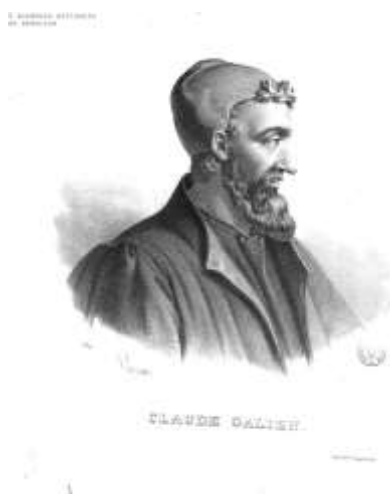
Figure 2 : Claude Galien (132-201), Antiquité (Rome)