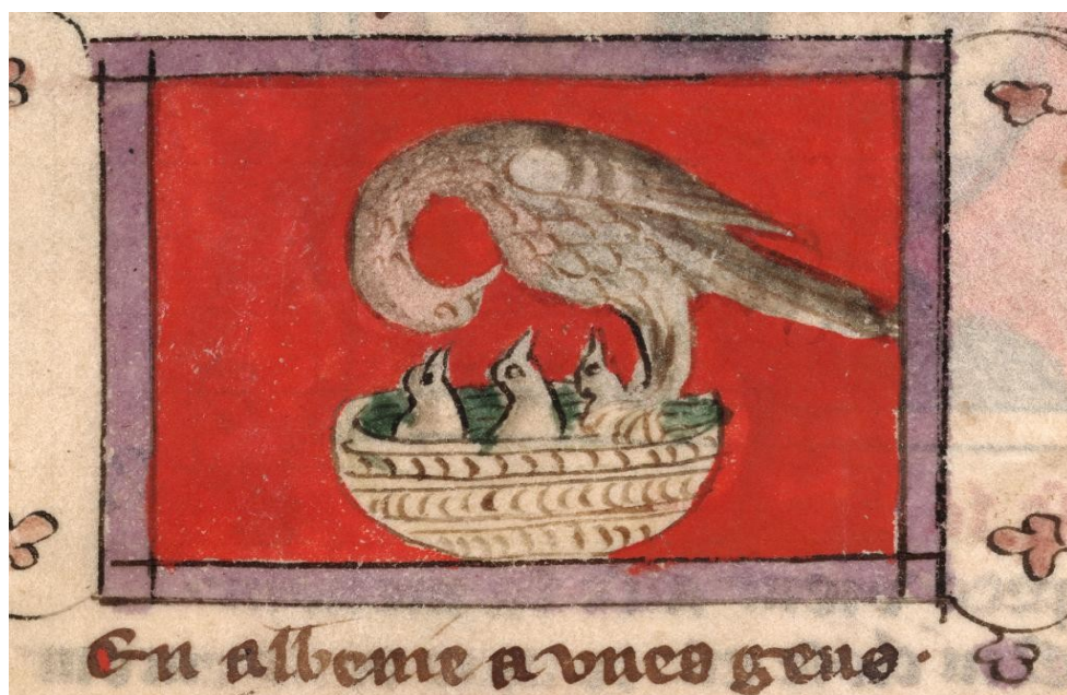
Le pélican et ses poussins , Bibliothèque universitaire historique de Médecine de Montpellier, in Bestiaire , XIV e siècle, manuscrit H 437, f. 108,.

La semblance est une scène poignante : un grand oiseau – un pélican – vole au-dessus d'un vieil arbre desséché, où il rejoint ses petits qui paraissent comme morts. Puis il se pose sur eux, il frappe son flanc de son bec et laisse jaillir le sang de son corps. Quand les oisillons sentent le sang chaud les arroser, ils reprennent vie aussitôt, tandis que le grand oiseau se laisse mourir au milieu d'eux. À travers son sacrifice, une nouvelle vie est offerte aux oisillons.