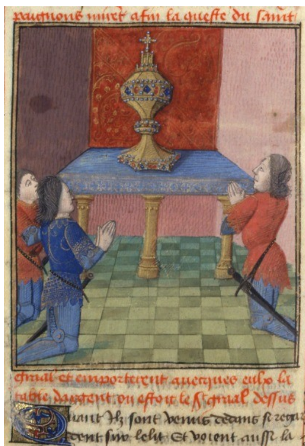
Galaad, Bohort et Perceval en prière devant le Graal, BnF, Manuscrit Français 112 (3), fol. 179v (vers 1470).

A n certain nombre de différences se présentent entre les trois élus. Bohort est le plus voisin de l'homme ordinaire. Il suit donc une trajectoire de pénitence laborieuse qui s'inscrit parfaitement dans l'ordre de l'humain, et donc de l'imitable. S'il n'atteint pas le niveau de perfection de Galaad et de Perceval, c'est surtout parce qu'il est ancré dans l'expiation concrète et pragmatique. Il s'offre ainsi comme un exemple à suivre pour les croyants qui s'apprêtent à entreprendre un chemin ascétique. Les deux autres élus, au contraire, possèdent essentiellement une fonction notionnelle : ils incarnent, en somme, un idéal de pureté religieuse qui est très loin de la contingence humaine.