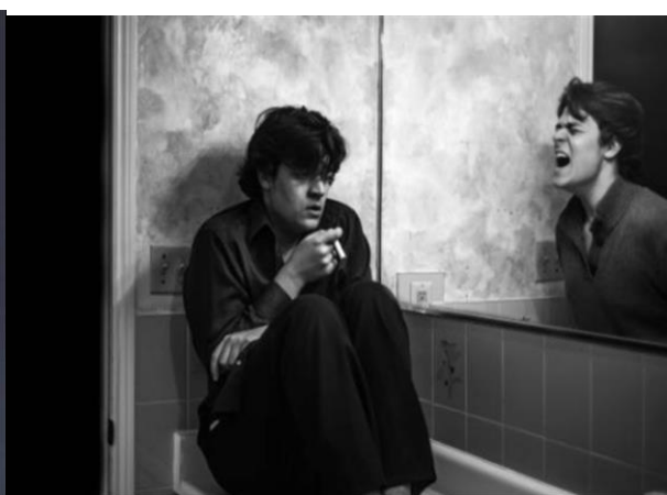
Image 12 : Les troubles psychologiques