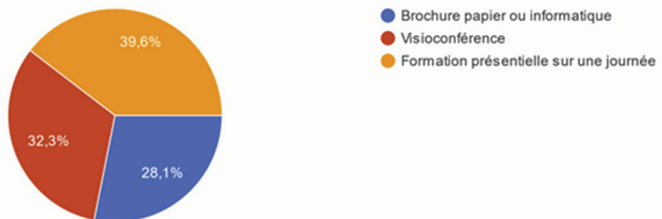
Figure 3 : répartition des réponses à la question : "sous quelle forme souhaiteriez-vous recevoir cette formation ?"