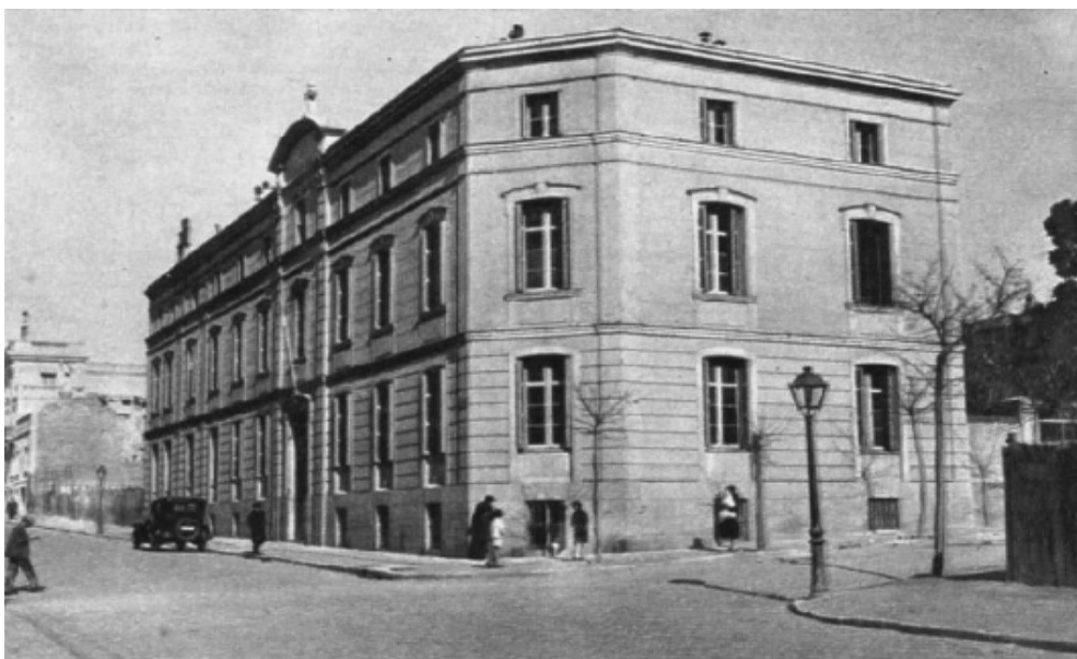
Figure 8 481

La façade de l'hôpital de l'Œuvre vers 1930, calle Claudio Coello à Madrid