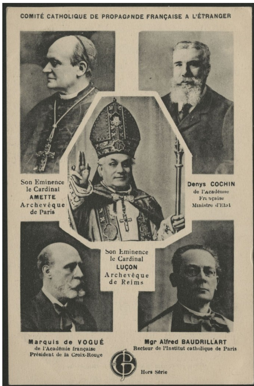
Figure 6 411