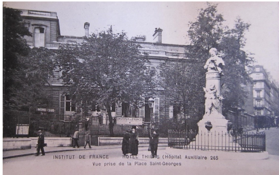
Figure 5 322

Photographie de l'hôtel Dosne-Thiers, prise de la place Saint-Georges (9 e arr.) entre août 1914 et décembre 1918, imprimé au verso d'une fiche d'observation d'un blessé.