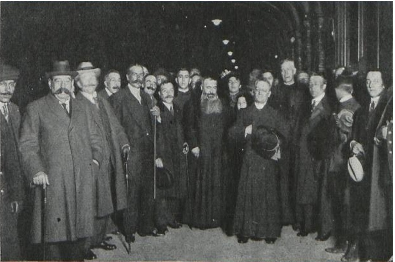
Figure 10 634