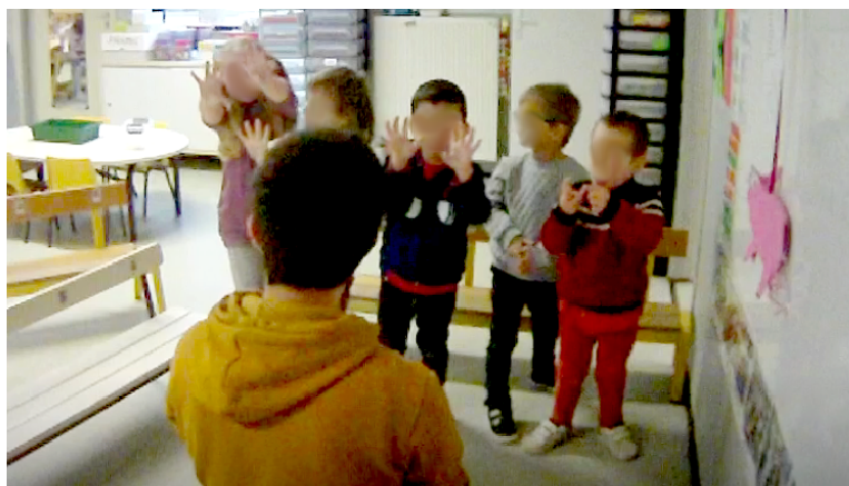
Photo prise lors de la séance du 21 janvier : Un petit cochon pendu au plafond

La première séance a eu lieu le matin du jeudi 21 janvier, donc en début de période 3 de l'année scolaire 2020/2021. L'atelier se passe au coin regroupement et s'organise autour d'une maquette de cochon que les élèves devront manipuler chacun leur tour. Pendant ce temps, les autres élèves sont répartis en trois groupes : un groupe de petite section travaille avec l'ATSEM tandis que les deux autres groupes sont en activité autonome.