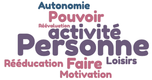
Figure 4 : Nuage de mots de l'entretien de Mme F.