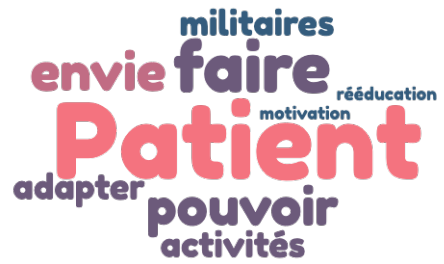
Figure 3: Nuage de mots de l'entretien avec Mme G.