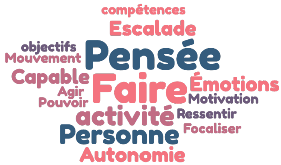
Figure 2: Nuage de mots de l'entretien avec M.E.