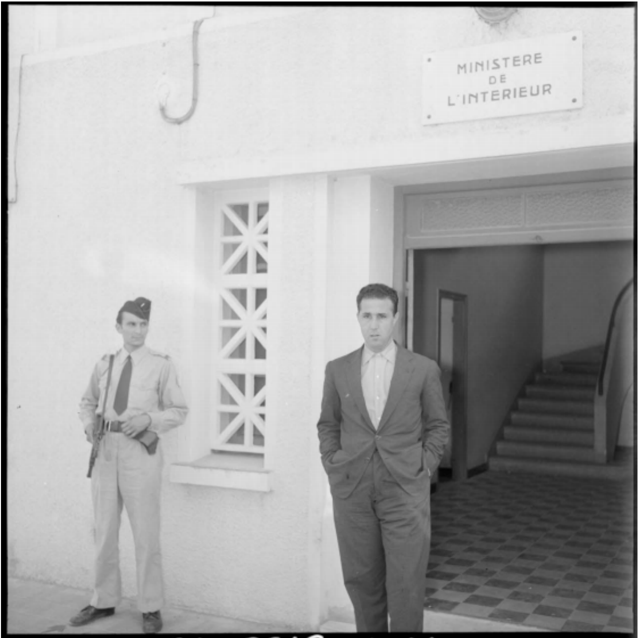
Portrait d'Ahmed Ben Bella.