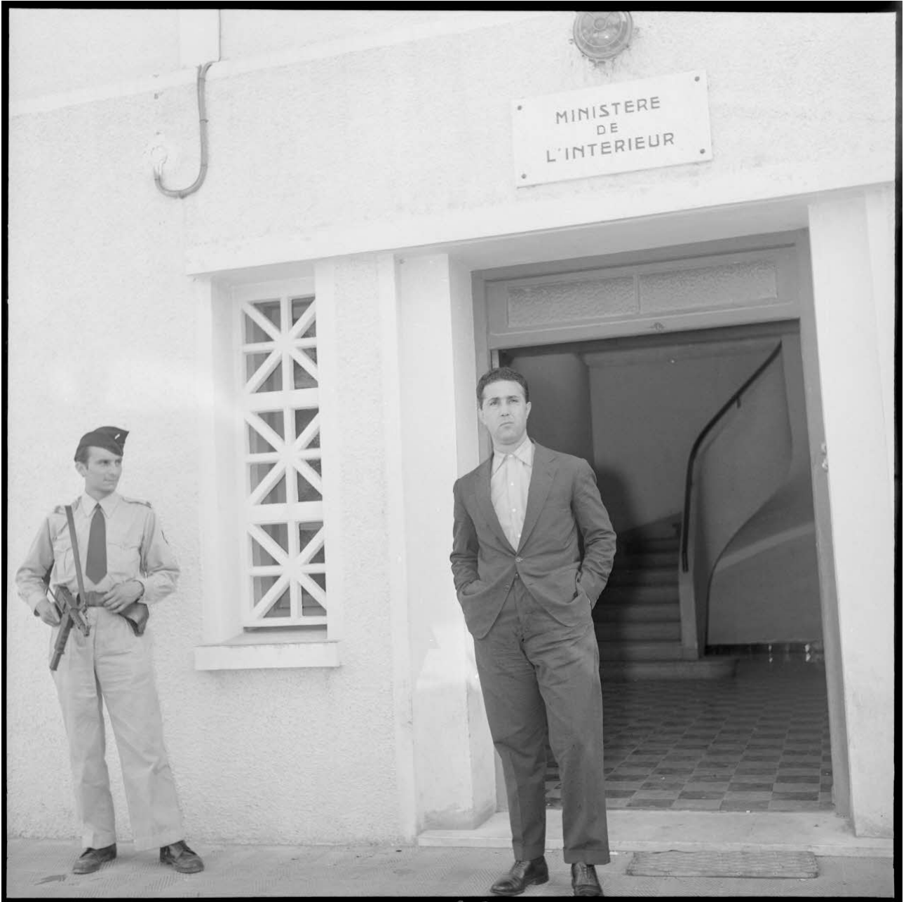
Portrait d'Ahmed Ben Bella.