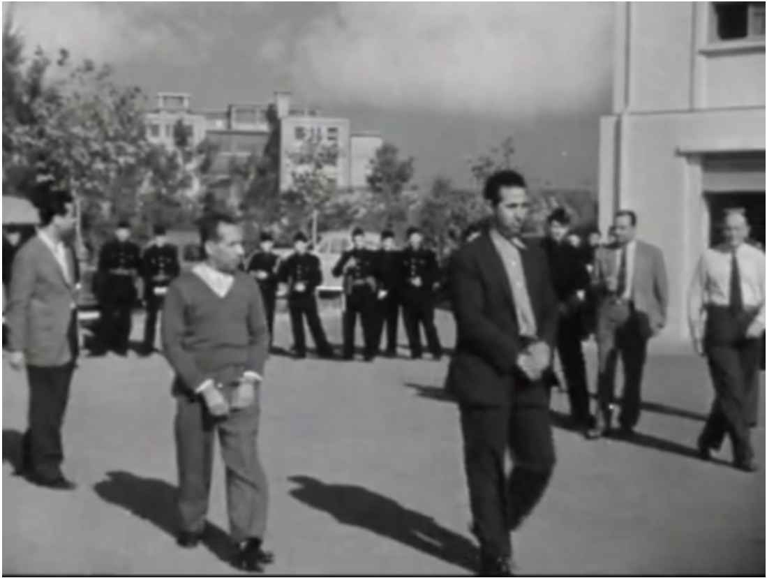
Mohammed Khider et Ahmed Ben Bella.