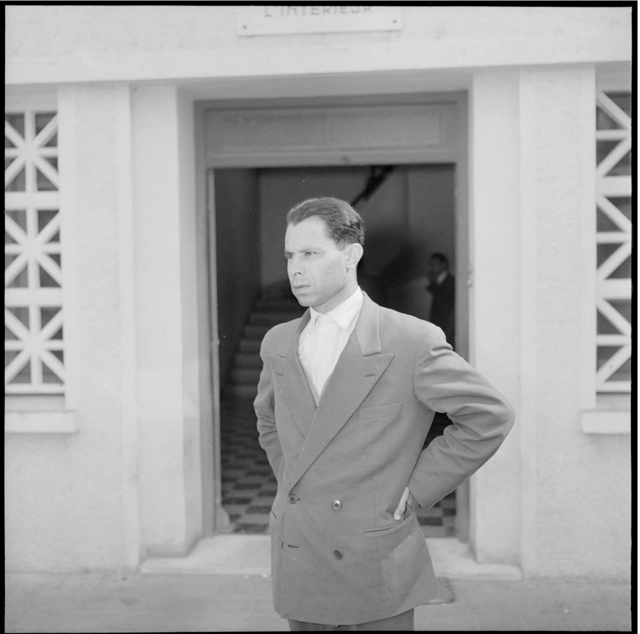
Portrait de Mostefa Lacheraf.