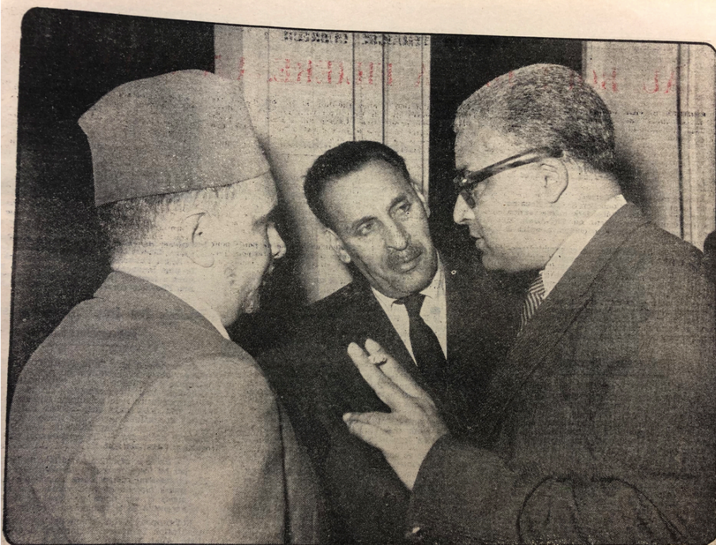
De gauche à droite : Allal El Fassi (Istiqlal), Farhat Abbas (F.L.N.) et Bahi Ladgham (Néo-Destour)