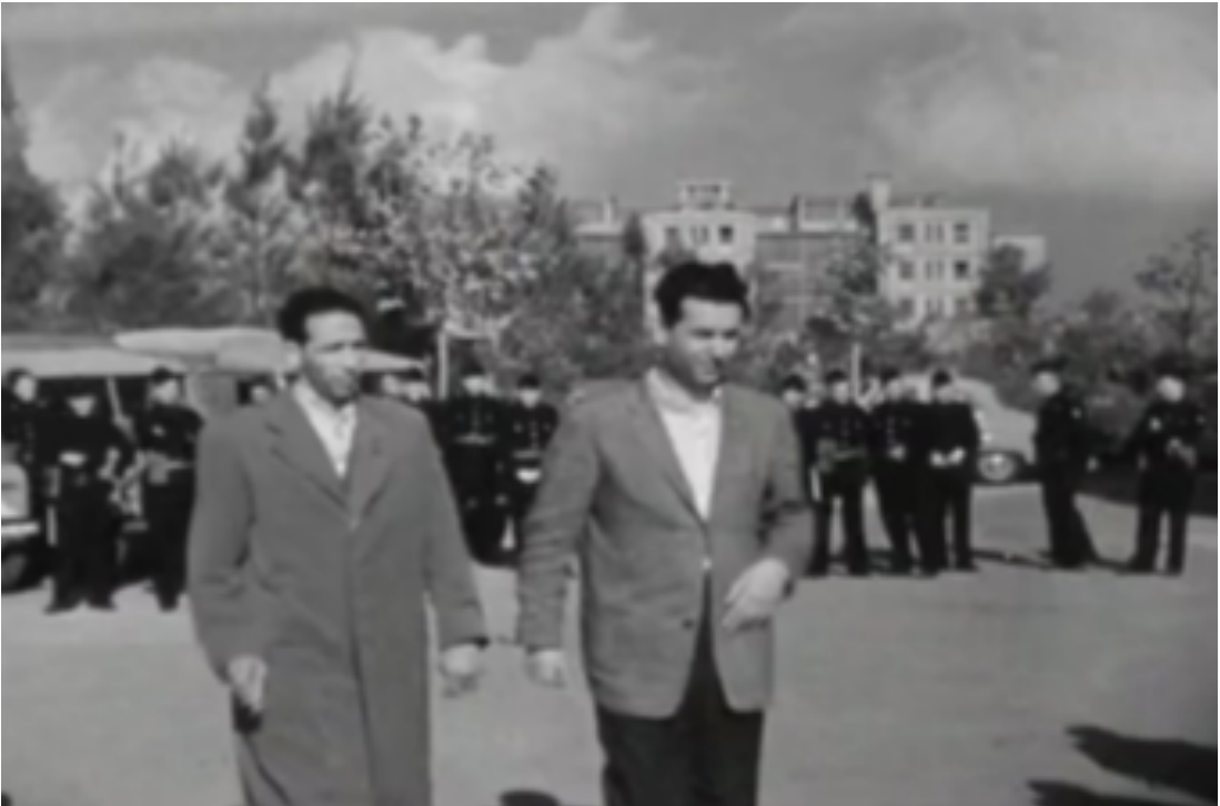
Mohammed Boudiaf et Hocine Ait Ahmed.