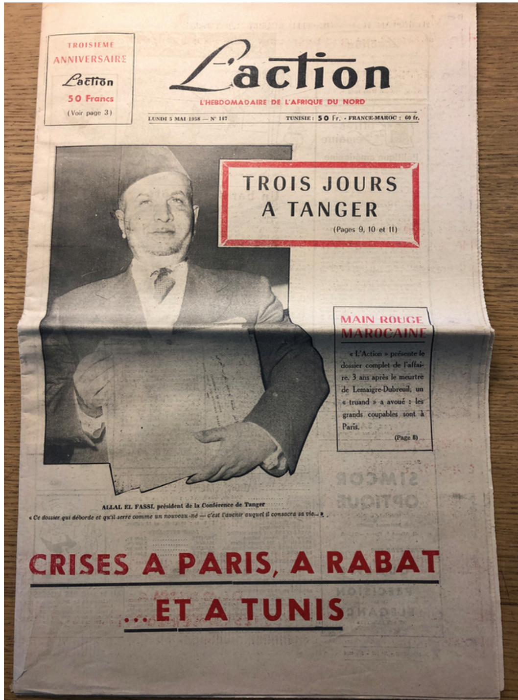
Première de couverture de l'édition du 5 mai 1958.