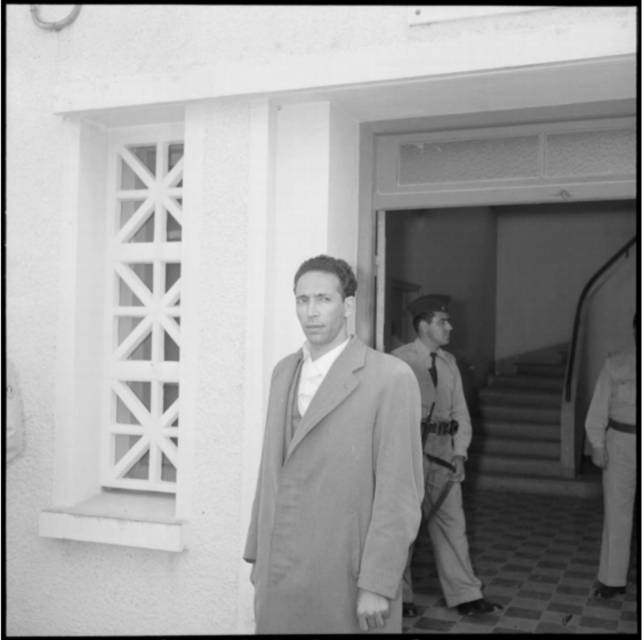
Portrait de Mohamed Boudiaf.