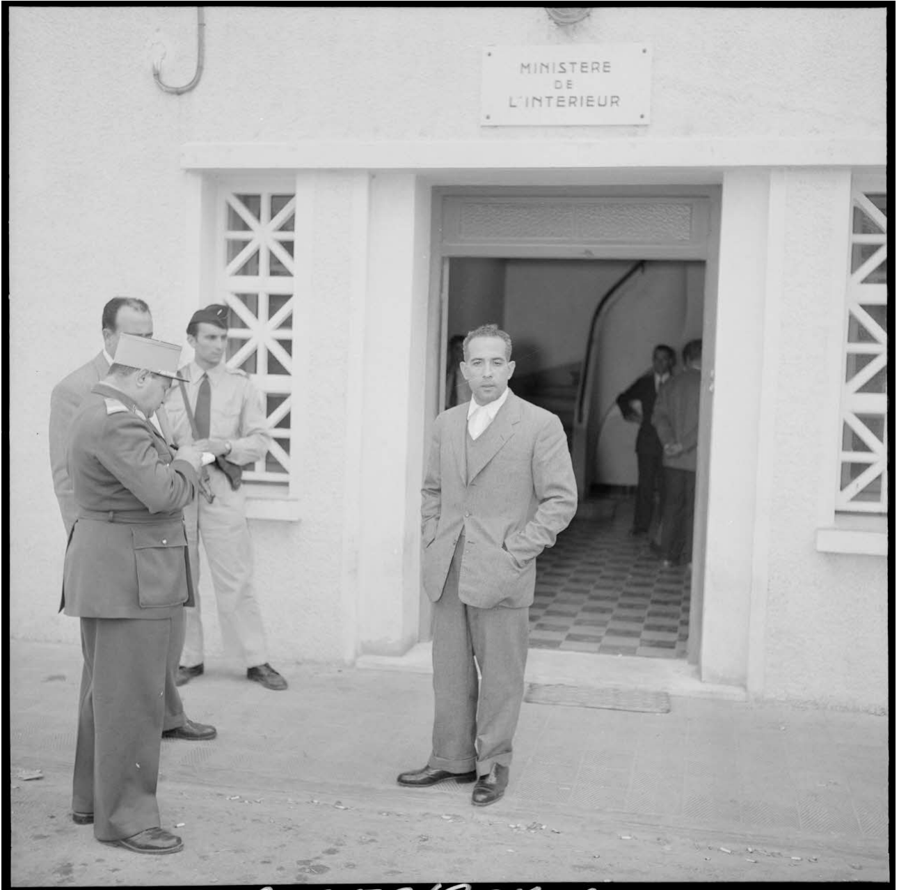
Portrait de Mohamed Khider.