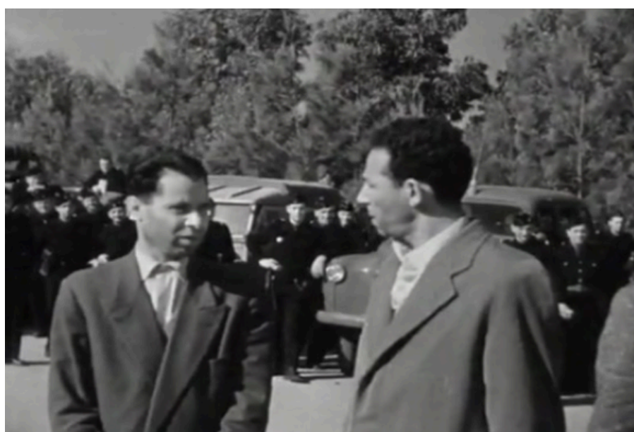
Mostefa Lacheraf et Mohammed Boudiaf.