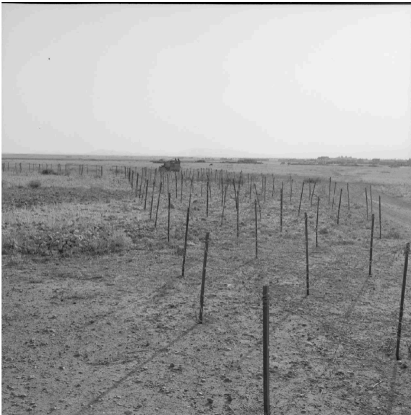
La ligne des barbelés située le long de la frontière algéro-marocaine.