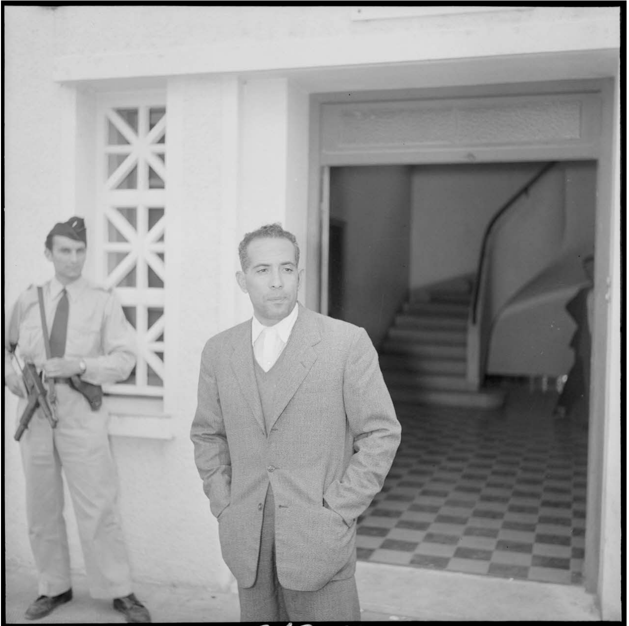
Portrait de Mohamed Khider.