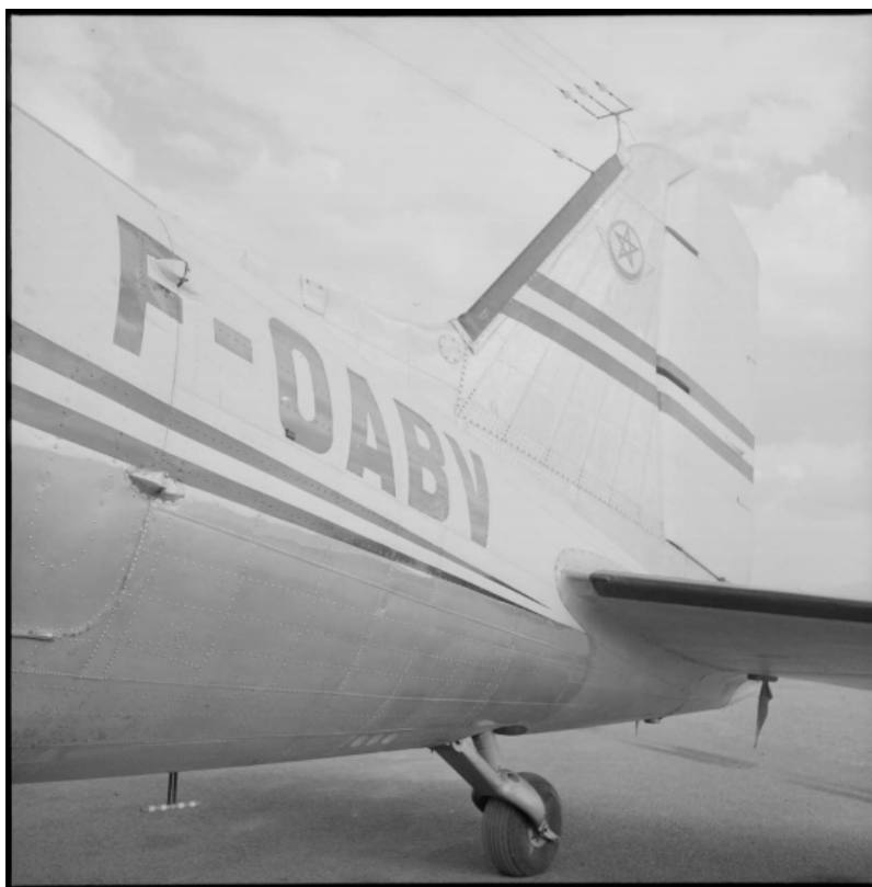
Vue rapprochée de l'immatriculation du DC 3 d'Atlas Air Maroc dans lequel voyageaient les chefs du FLN.