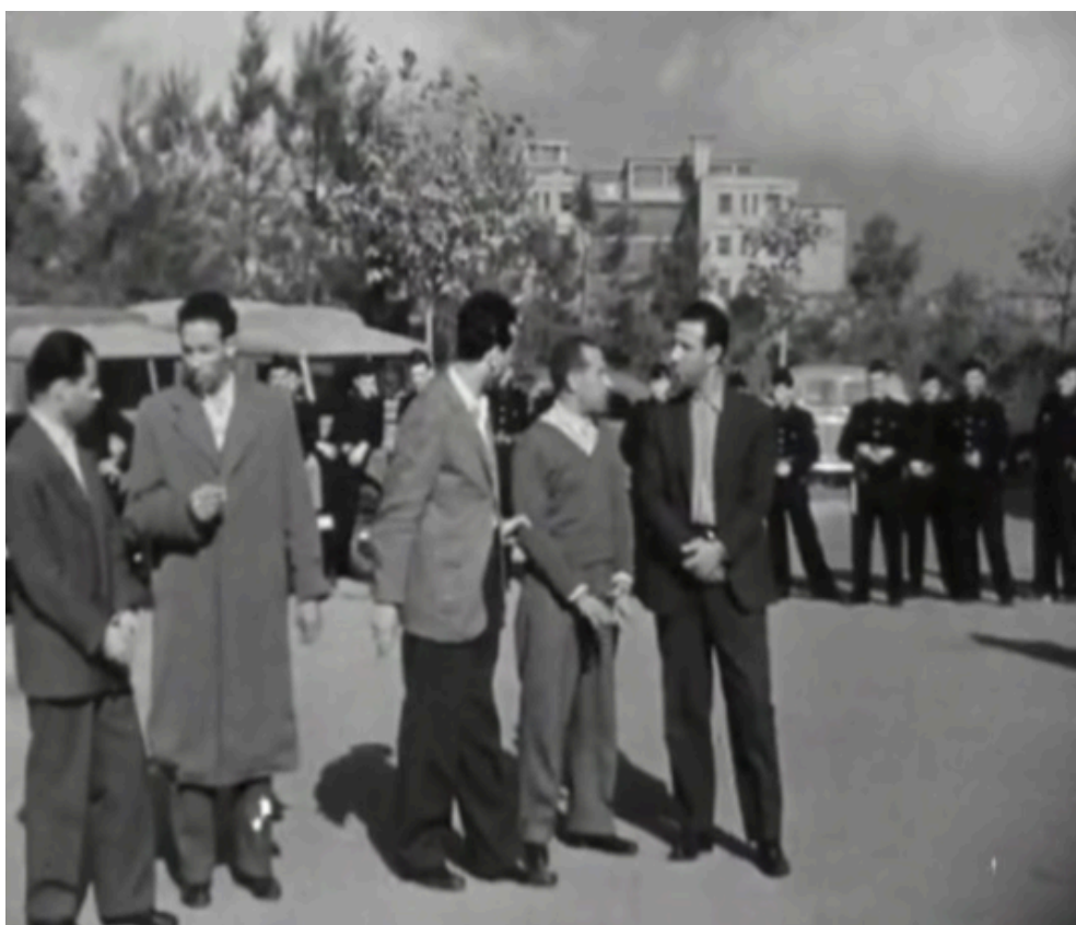
Mostefa Lacheraf, Mohammed Boudiaf, Hocine Aït Ahmed, Mohammed Khider, Ahmed Ben Bella.

Les cinq chefs du FLN arrêtés le 22 octobre 1956 à Alger.