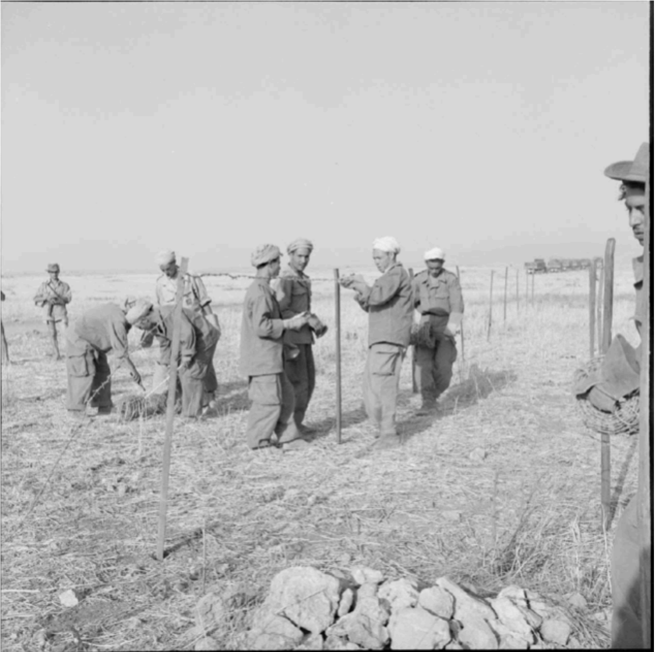
Pose de barbelés le long de la frontière algéro-marocaine.