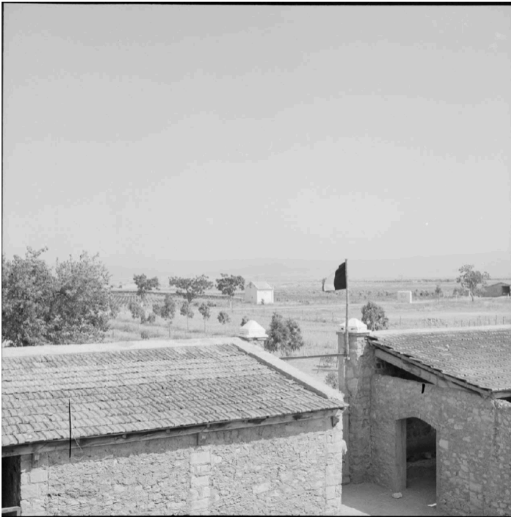
Le bordj 201 du 2 e RIC.

Contexte de la série de photographie : "Les confins algéro-marocains posent des problèmes aux autorités algériennes à cause de l'infiltration de membres de l'ALN (Armée de Libération Nationale) par le Maroc. A Oujda (Maroc) se trouve un camp d'entraînement de cette armée qui rend la région instable. Sur la route de Tlemcem-Oujda, le 2e section du 22 e RIC (Régiment d'infanterie coloniale), sous les ordres du lieutenant Cousin, contrôle une partie de la frontière algéro-marocaine afin d'éviter les incursions. Les soldats tentent de sécuriser la région oranaise et de surveiller cette "zone interdite". Une section du 106 e RG (régiment du génie), aidé de goums, pose des barbelés à Zouj El Beghlal pour "imperméabiliser" la frontière."