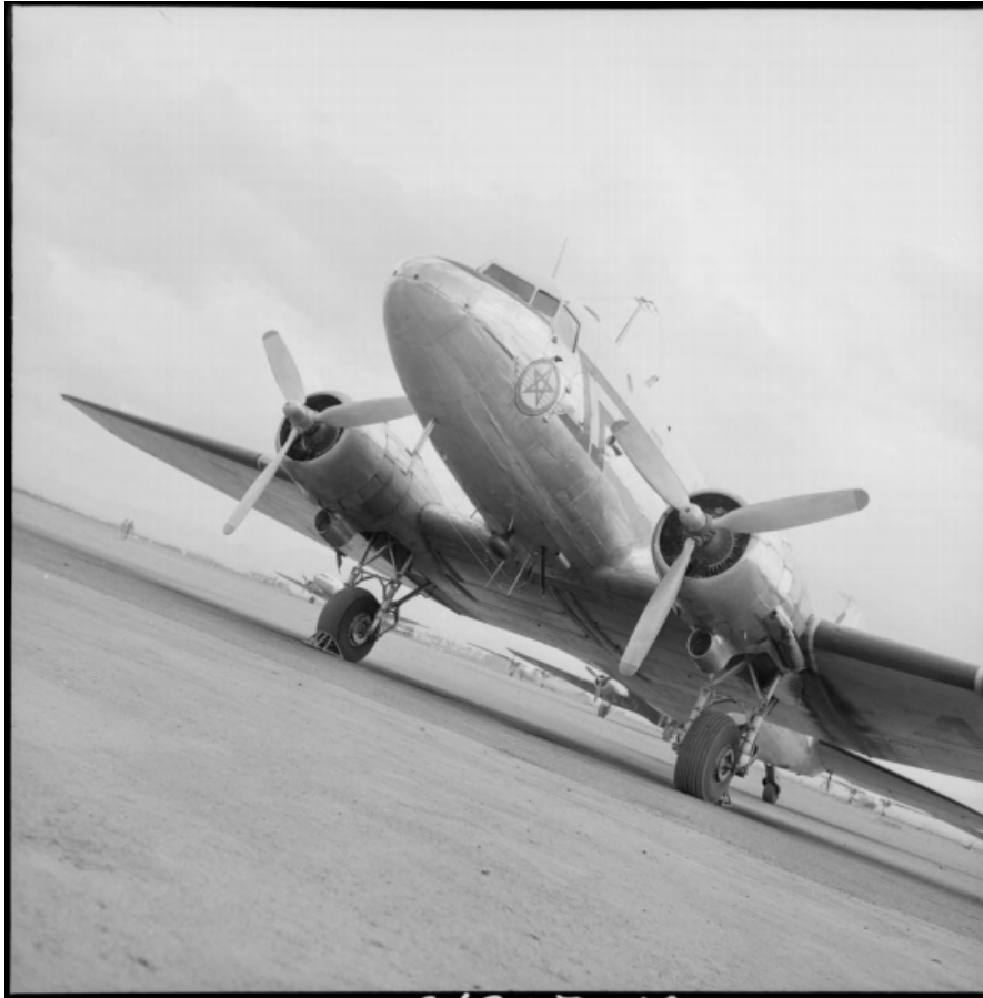
Le DC 3 d' Atlas Air Maroc dans lequel voyageaient les chefs du FLN.