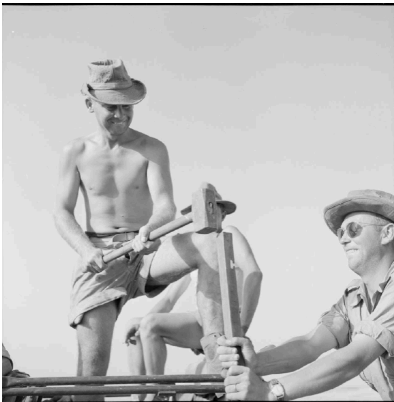
Des soldats du 106 e RG plantant des piquets pour la pose de barbelés.