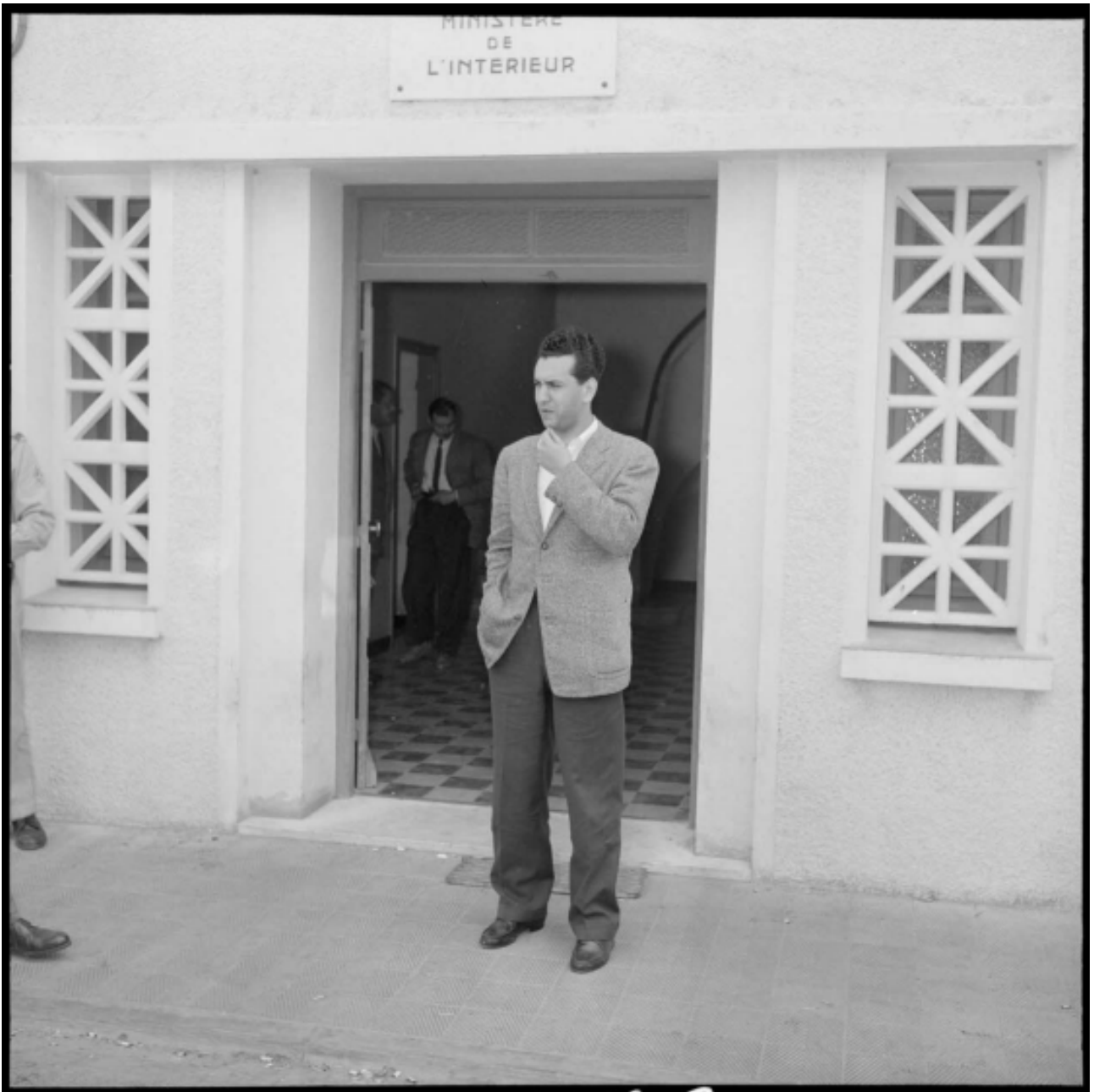
Portrait d'Hocine Ait Ahmed.