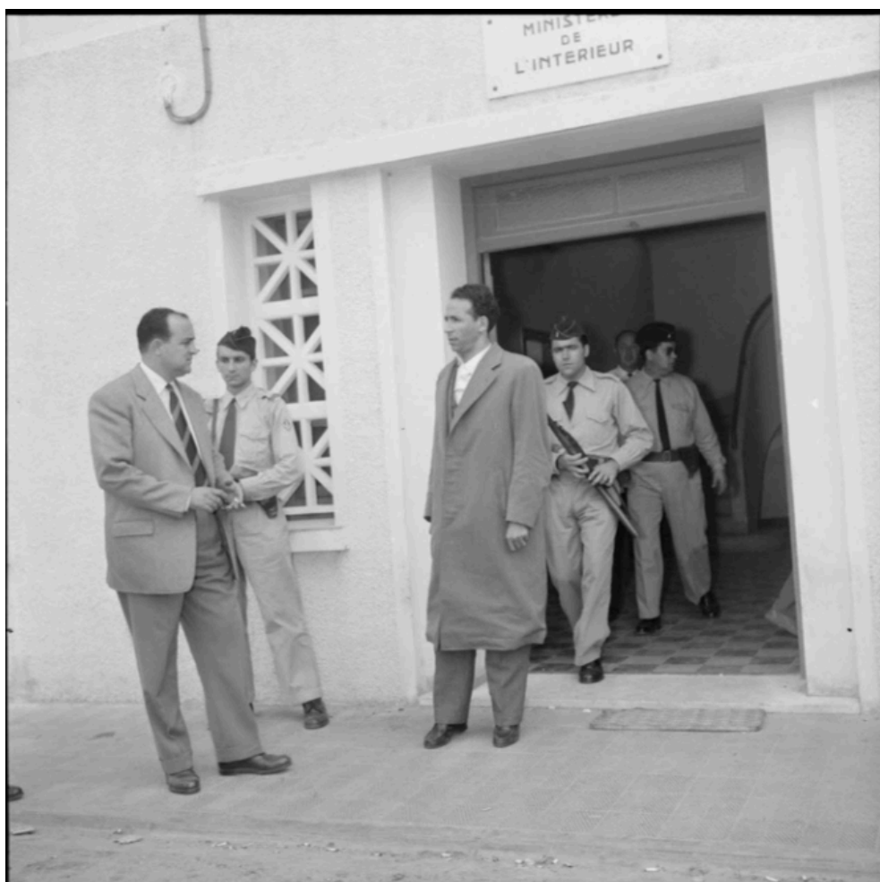
Présentation de Mohamed Boudiaf à la presse.

Contexte de la série : Les représentants extérieurs du F.L.N. sont présentés à la presse après leur arrestation et leur interrogatoire à la DST de Bouzaréah. Interceptés alors qu'ils se rendaient en avion à une conférence en Tunisie, l'avion des personnalités algériennes a été arraisonné avec la complicité du pilote et de l'hôtesse de l'air. Après leur interrogatoire, ils posent chacun à leur tour devant le bâtiment du "ministère de l'intérieur" comme l'indique le fronton. Le premier à sortir et à "se présenter" à la presse est Mohammed Boudiaf, responsable de la logistique et du ravitaillement en armes pour la région oranaise (photos 1 et 2), puis Hocine Ait Ahmed, membre du C.N.R.A. (photos 3 et 4). Vient ensuite Mohammed Khider, ex-député français et membre du Comité révolutionnaire d'unité et d'action (photos 5 et 6), Mostefa Lacheraf, ex-prof d'histoire (photos 7 et 8) et enfin Ahmed Ben Bella, leader du groupe et responsable de l'Organisation Spéciale (O.S.) pour l'Algérie (photos 9, 10, 11). L'appareil DC3, affrété par le prince Moulay Hassan (futur Hassan II du Maroc) arraisonné et immobilisé sur la piste de l'aéroport Alger-Maison-Blanche. Des photos sont prises de la carlingue, du fuselage, de l'immatriculation (F-OABV) et de l'emblème marocain du DC3 "Air-Atlas-Air-Maroc".