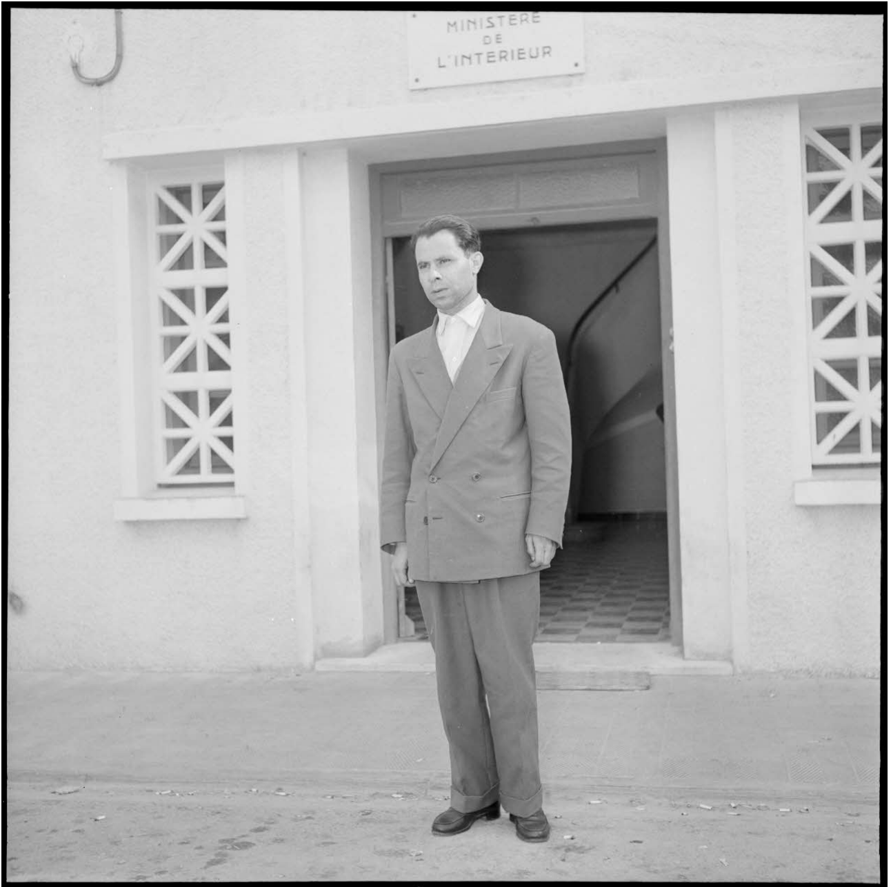
Portrait de Mostefa Lacheraf.