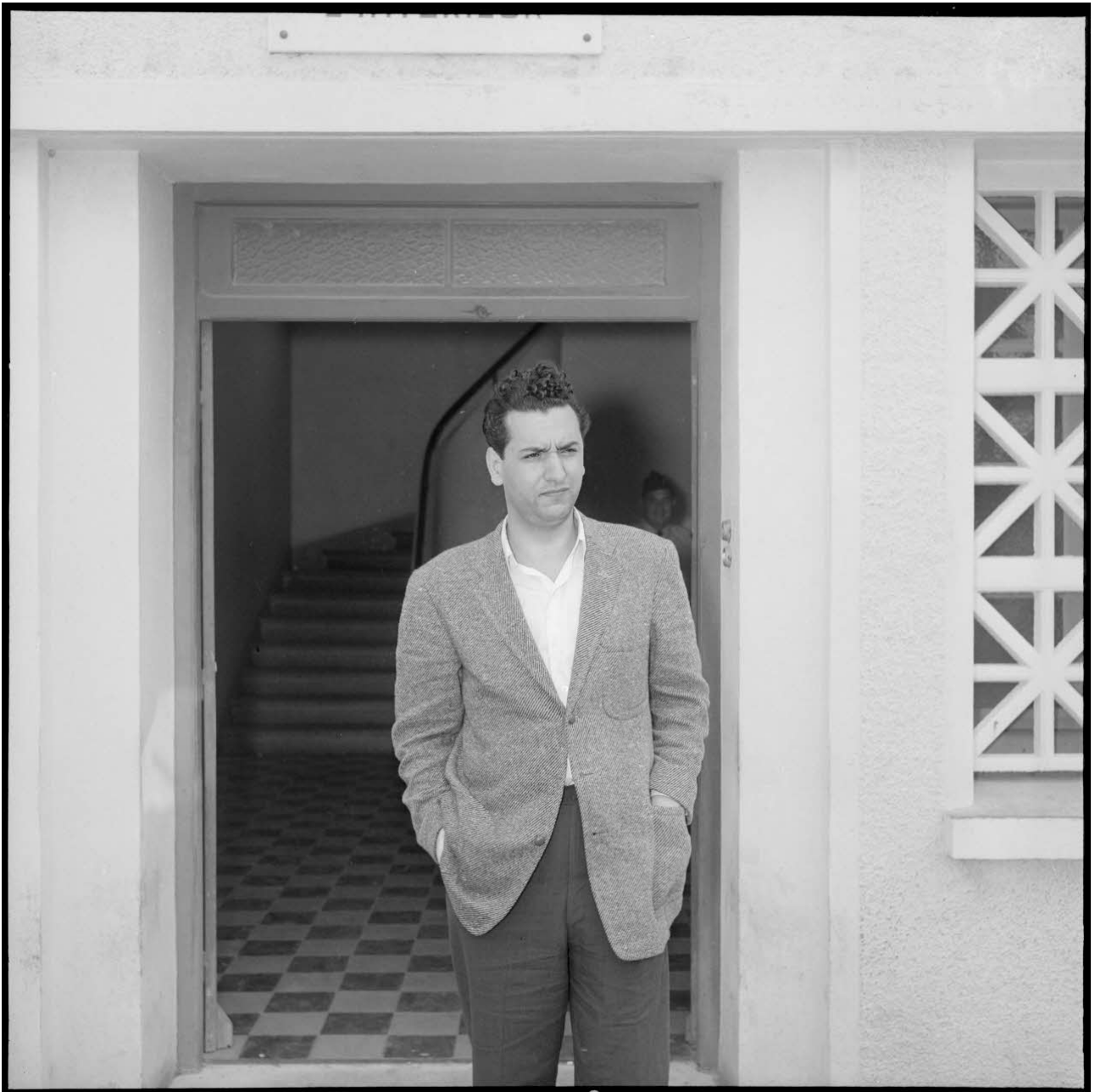
Portrait d'Hocine Aït Ahmed