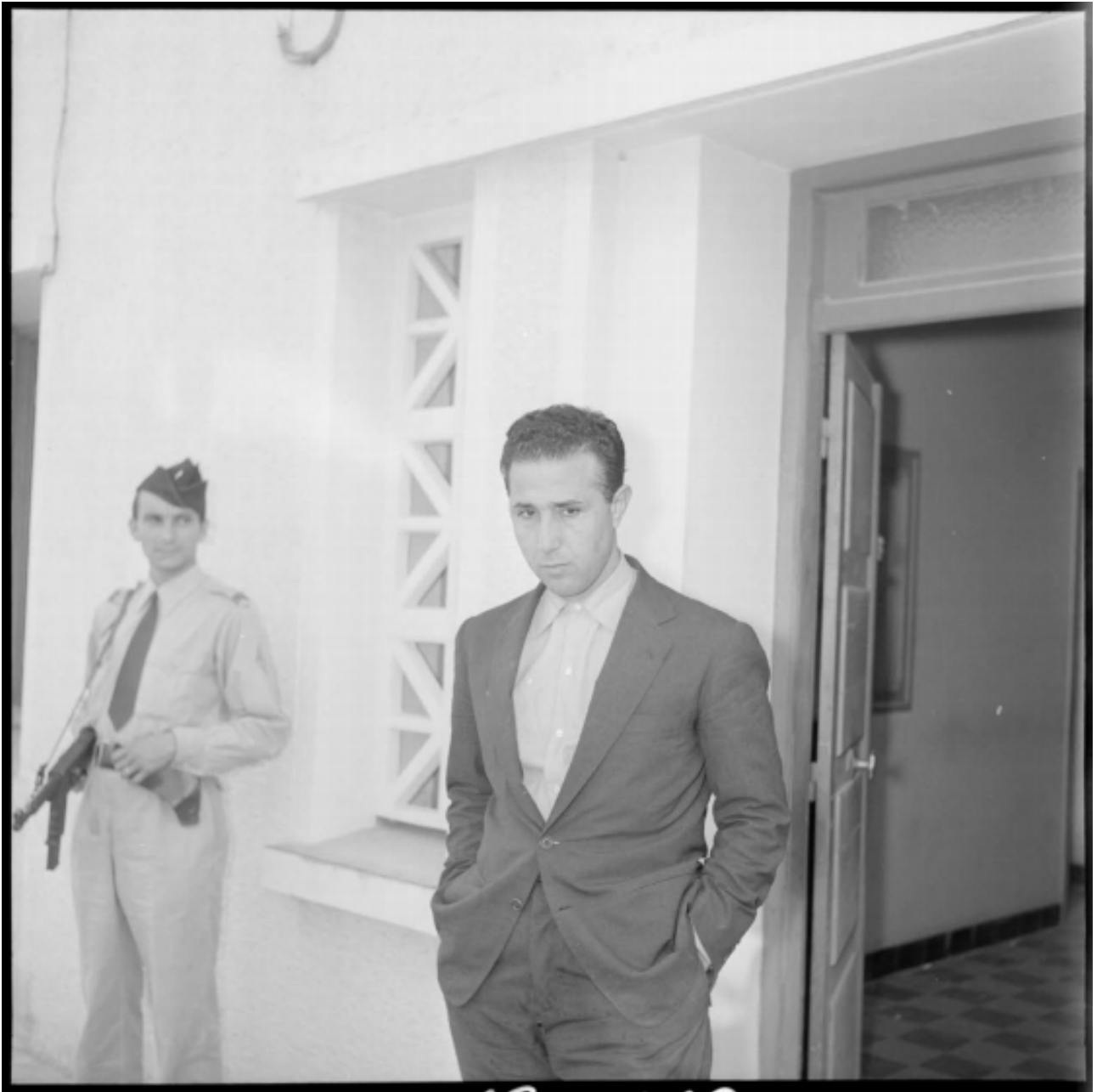
Portrait d'Ahmed Ben Bella.