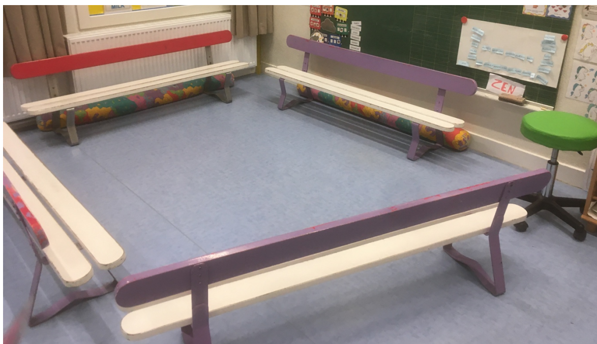
Position des bancs finalement retenue en regroupement, janvier 2021 (affichage du plan de placement au tableau).