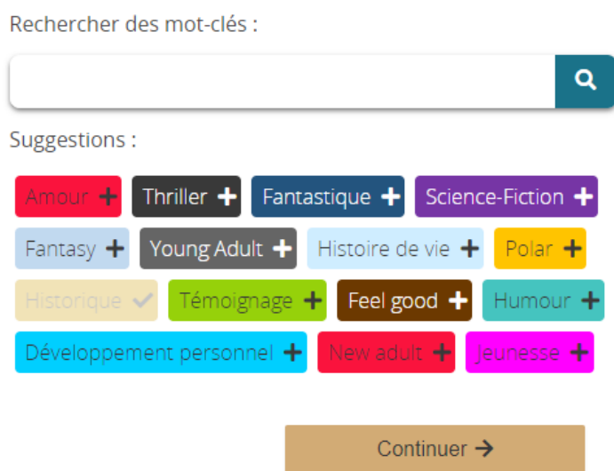
Figure 2: Système de mots-clés du questionnaire Ptit Colli