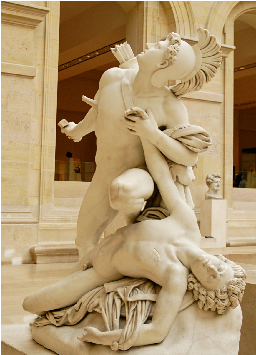
Statue de Nisus et Euryale, Jean-Baptiste Roman, Musée du Louvre, 1827