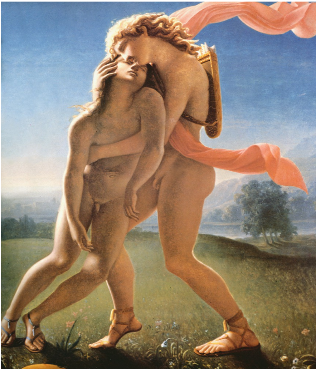
La mort de Hyacinthe, Jean Broc, 1801, Musée Sainte-Croix, Poitiers