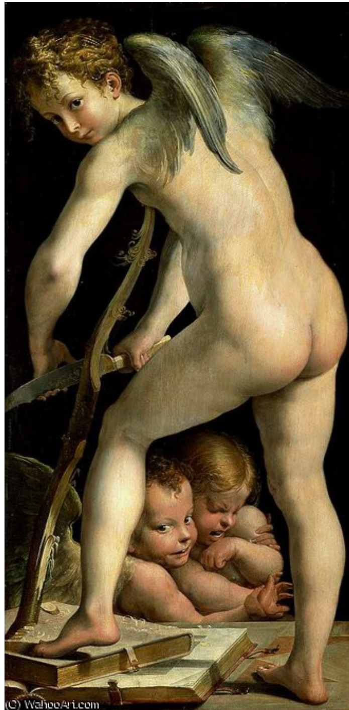
Cupidon taillant son arc , Parmigianino, 1534, Musée des beaux-arts de Vienne