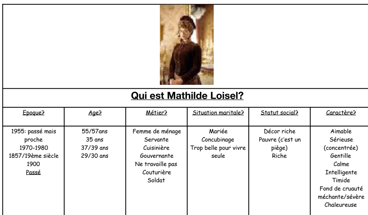
Document 10: Extrait séance 1, séquence La nouvelle réaliste, La parure , Maupassant, 1884

A partir d’une photo de Mathilde Loisel, le personnage principal, les élèves ont émis des hypothèses pour répondre à la question « Qui est Mathilde? ». Ils ont imaginé son âge, l’époque dans laquelle elle a vécu, sa situation maritale, si elle travaillait, quels pouvaient être son caractère et le milieu social dans lequel elle évoluait.