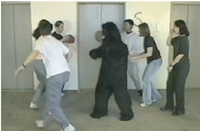
Document 8 : Expérience du gorille invisible, 1999, Simons et Chabris

La consigne est de compter le nombre de passes effectuées par l'équipe blanche. Pendant cette expérience, une personne déguisée en gorille traverse la scène.