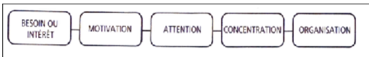
Document 7 : Shéma du fontionnement mnésique, Danielle Lapp, 1997

Enfin ,Danielle Lapp, nous montre que l'attention est un maillon essentiel aux apprentissages et elle définit le processus ainsi: