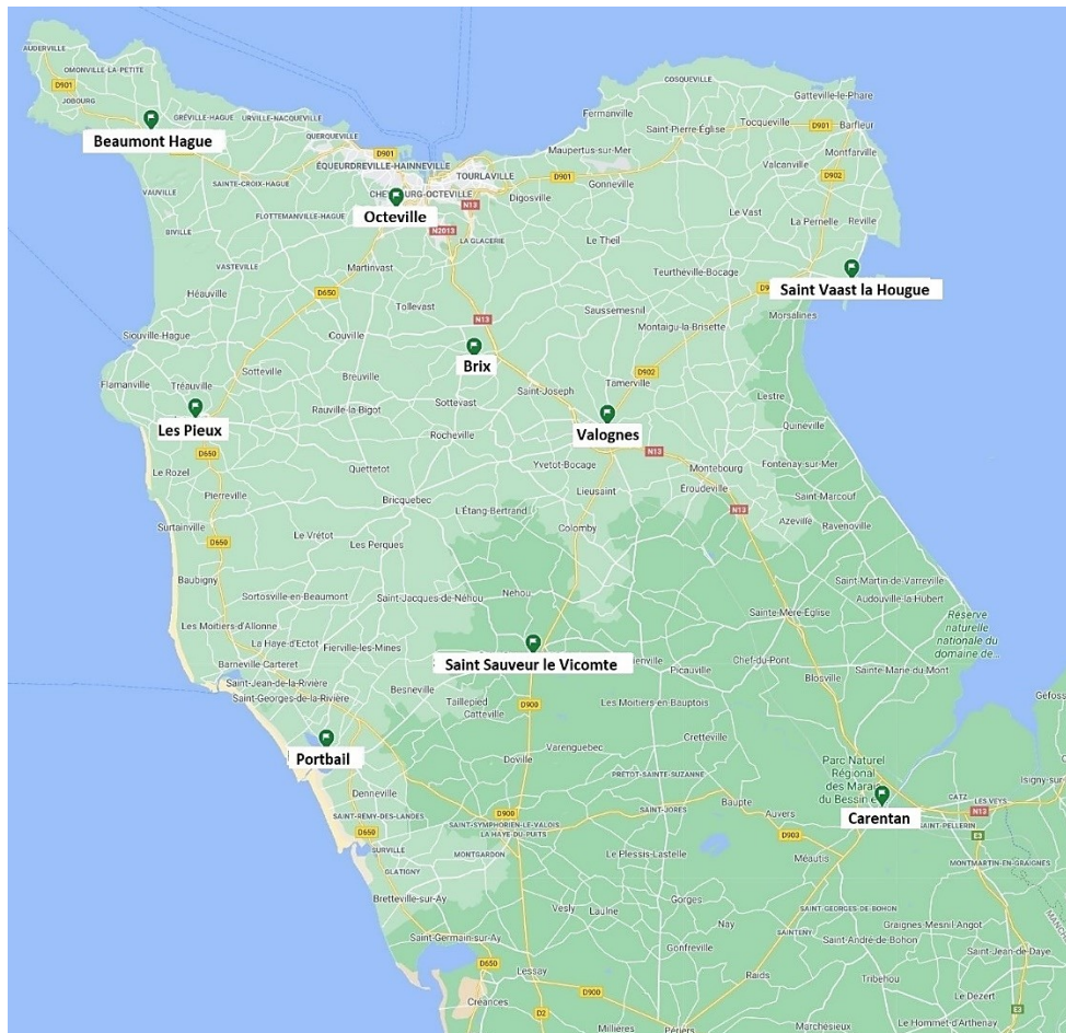
Carte issue de Google Maps et modifiée via le logiciel Paint

Un médecin généraliste interrogé pratiquant seul dans la ville où il exerce, nous n'avons pas cité sa localisation sur la carte afin de garantir son anonymat.