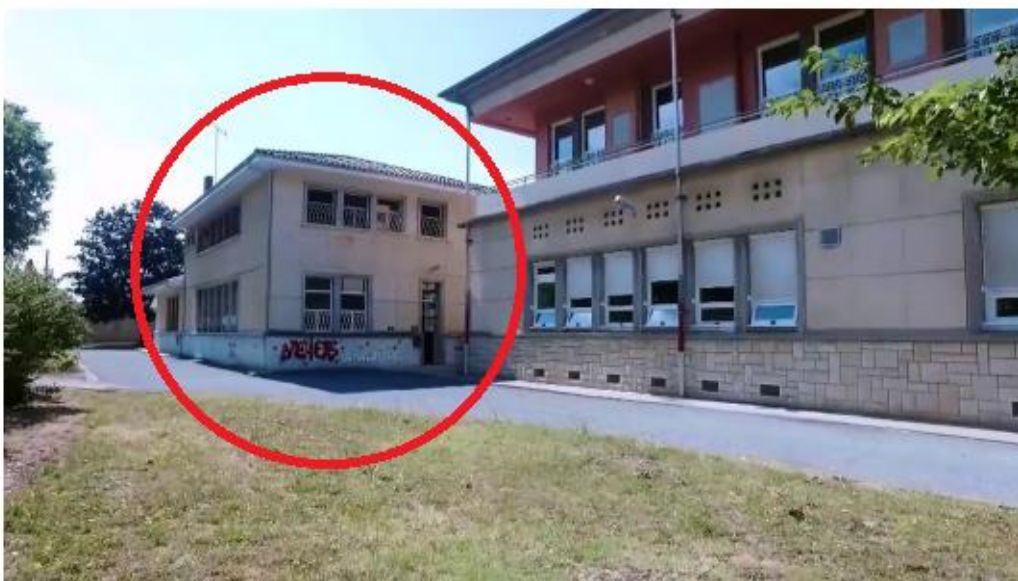
À droite de la photo, le bâtiment d'Ergothérapie.