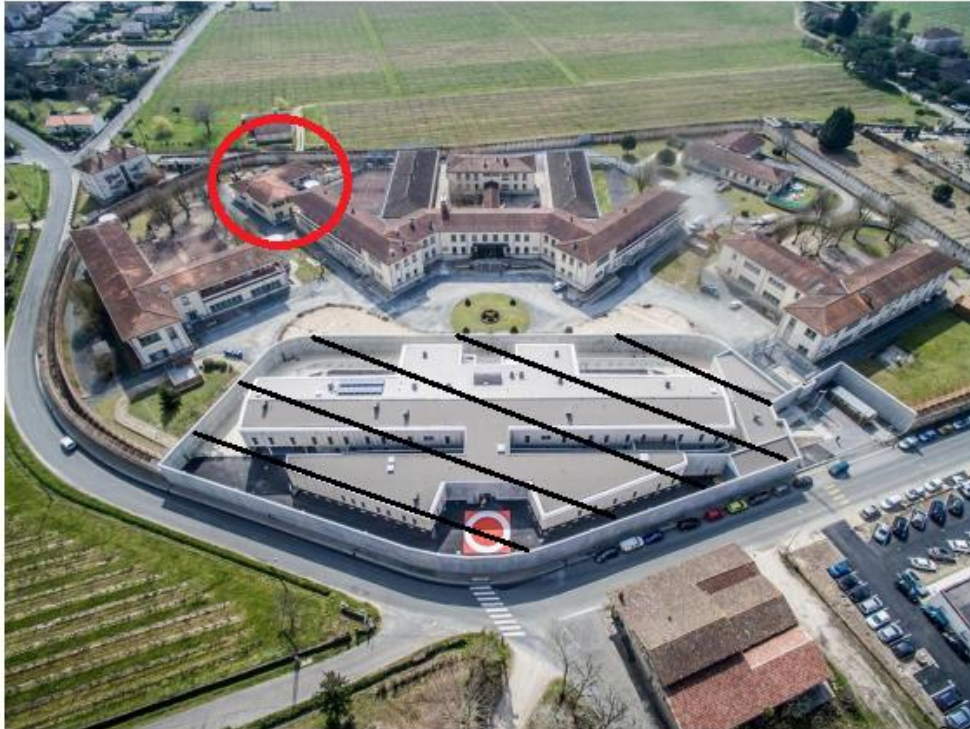
Vue aérienne de l'Unité pour Malades Difficiles. La partie entourée est le bâtiment d'Ergothérapie. La partie achurée correspond à l'Unité Hospitalière Spécialement Aménagée, structure indépendante de l'UMD, mais faisant partie du Pôle Médico-Légal.