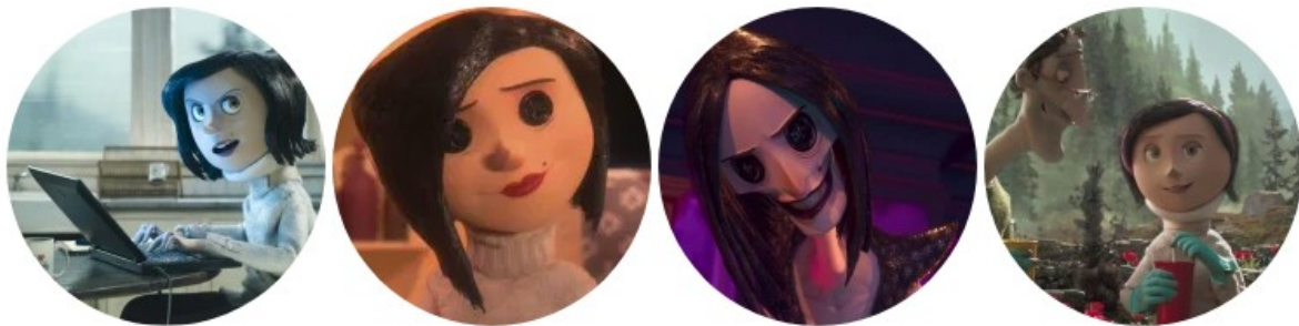
Illustration 5: Les quatre figures maternelles de Coraline (Henry Selick, 2009)

l'autre monde. Par cette image, Henry Selick présente les résidus de cet autre monde dans la réalité, qui finissent par disparaître en gouttes d'eau. Comme pour mettre fin au monde de l'enfance, les parents évitent les questions de leur fille sur l'autre monde, justifiant l'eau sur leur manteau de manière rationnelle, par la tempête qui se déroule à l'extérieur. Yasmine Phan traduit ce retour à la réalité comme l'achèvement d'une ère pour la jeune fille, qui adopte une vision plus réaliste, plus adulte du monde réel : « Cette prise de conscience lui permettra de changer les visions initiales qu'elle avait de la mère du monde adulte [...] pour en percevoir une nouvelle, plus réaliste 88 ».