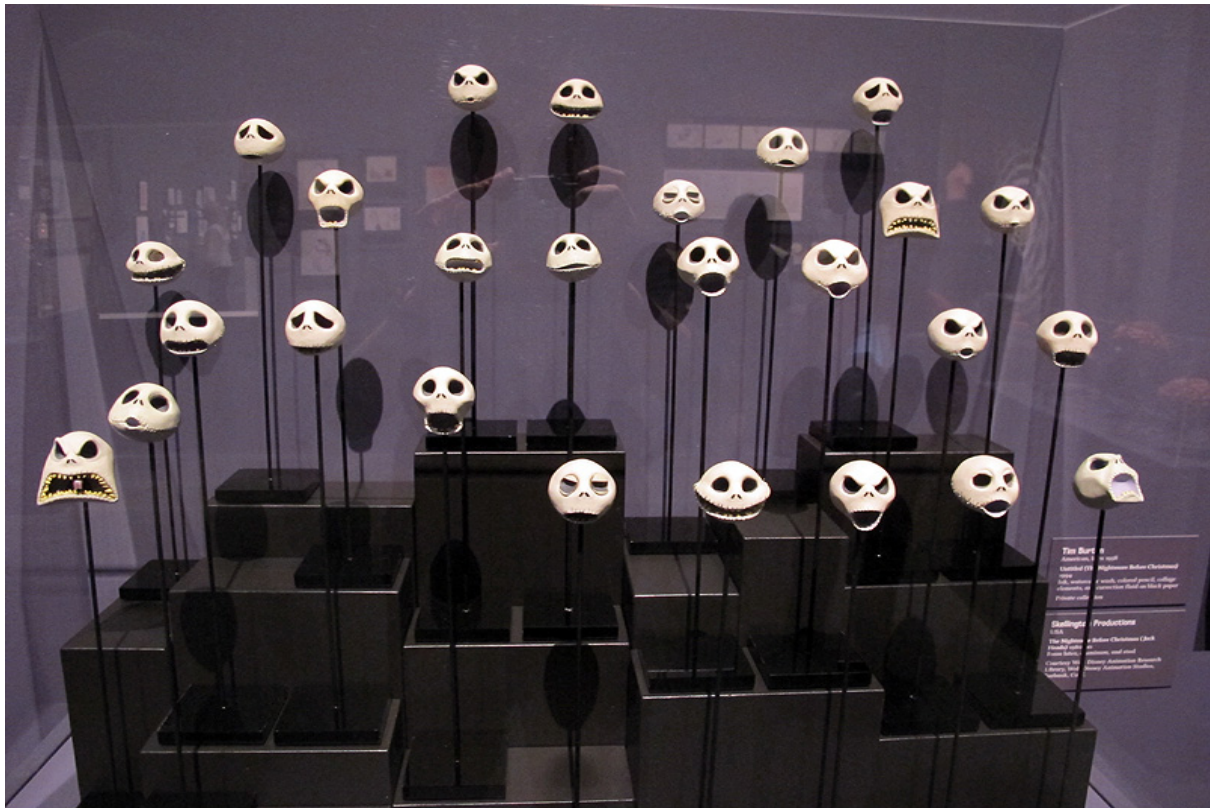
Illustration 1 : Exposition New-Yorkaise sur Tim Burton en 2019

problématiques du protagoniste : « Ce visage-masque dessine donc une forme incomplète [...] Ce vide peut même parfois être marqué matériellement par un vide à la place des yeux ou de la bouche par exemple. Il sera comblé par l'imagination du spectateur en fonction des circonstances et de l'histoire qui se jouent 23 . ». Les expressions de Jack (cf Illustration 1) sont soumises à de nombreuses variations puisqu'elles sont reliées à l'état d'esprit changeant du squelette.