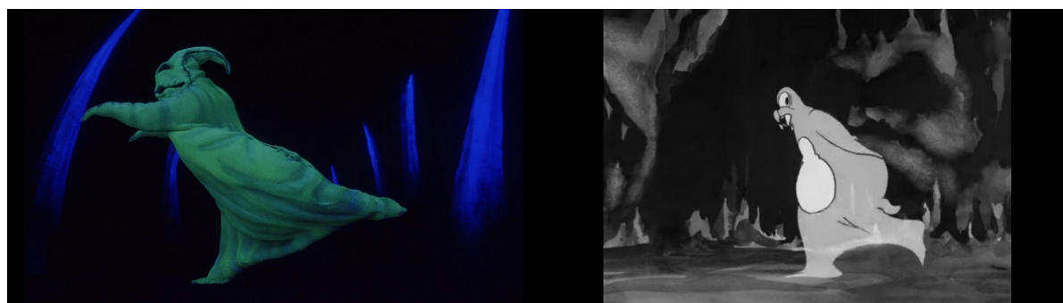
Illustration 6 : La danse d'Oogie Boogie L'Étrange Noël de M. Jack (Henry Selick, 1994) à 1.04.50 et du morse dans Minnie The Moocher (Dave Fleischer, 1932)

Ces deux enveloppes vides parodient les mouvements d'un être humain, sans pour autant s'y conformer d'un point de vue visuel puisque dans le premier cas c'est un animal patibulaire tandis que, dans le second, c'est un matériau disgracieux, animé pour donner une impression d'humanité. En ce sens, le personnage d'Oogie Boogie approfondit la parodie de Dave Fleischer pour ne finalement dévoiler qu'un sac qui renferme le mal de ce monde, exilé aux confins de la ville d'Halloween. En résumé, le personnage d'Oogie Boogie représente la facette sombre de la personnalité de Jack, puisque ce personnage n'obéit et ne s'intéresse à personne, à l'image d'un enfant capricieux, colérique et égoïste.