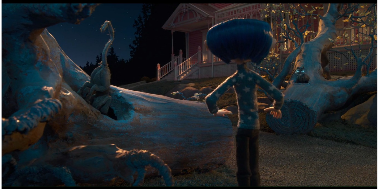
Illustration 4 : Double apparition du Chat dans Coraline (Henry Selick, 2009) à 0.45.50

histoire, les capacités d'apparition et de disparition de l'animal (voir Illustration 2) ancrent l'idée que celui-ci provient de l'imaginaire de la jeune fille puisqu'il est capable de parler, mais aussi parce qu'il l'entraîne à retourner dans le monde réel, comme un instinct de survie intrinsèque à l'esprit de Coraline.