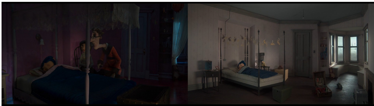
Illustration 3 : Coucher dans l'autre monde et réveil dans le monde originel dans Coraline (Henry Selick, 2009) à 0.21.39

De plus, par cette transition en fondu enchaîné, le réalisateur ancre le monde de l'enfance dans l'esprit et l'imagination de Coraline, rappelant par la même occasion son statut solitaire dans son monde d'origine.