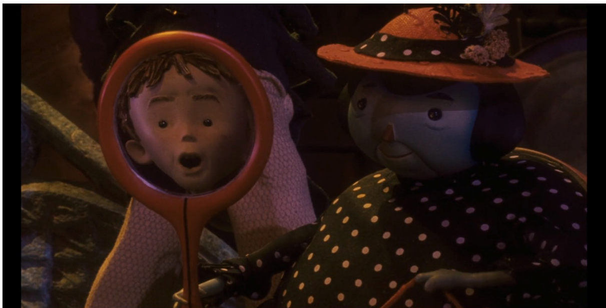
Illustration 2 : James découvre son nouveau visage sous la forme d'une figurine dans James et la pêche géante (Henry Selick, 1996) à 0.21.12