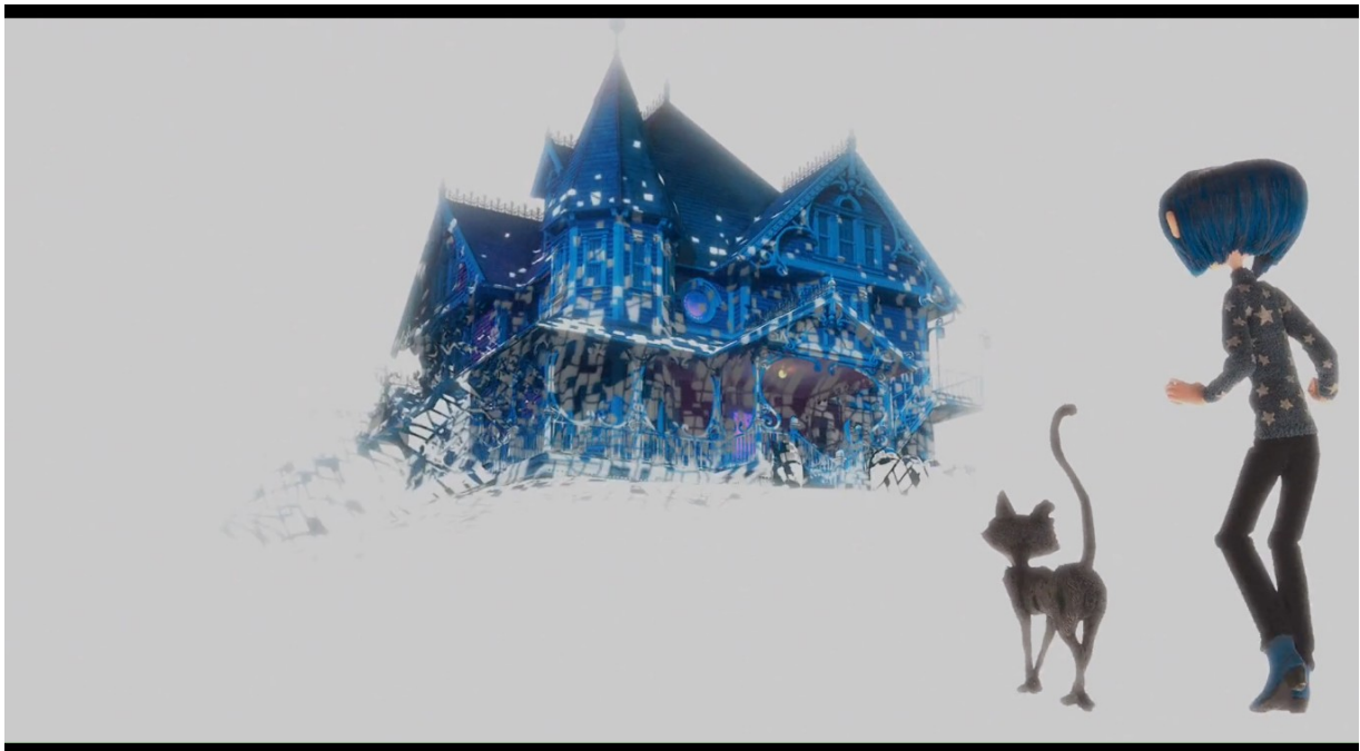
Illustration 8 : Ré-actualisation de l'autre monde après que Coraline en ait fait le tour dans Coraline (Henry Selick, 2009) à 0.55.45

La bonne tenue du monde parallèle de Coraline repose sur la volonté de l'Autre Mère de séduire la jeune fille pour lui voler ses yeux et par extension, son âme. Dès lors que Coraline affirme plus fermement son refus, l'autre monde se désagrège puisqu'il ne remplit pas la mission d'attirer la jeune fille dans les griffes de l'Autre Mère. De ce fait, cet univers merveilleux est métamorphosé en un piège mortel, comme exsangue des belles couleurs qu'il arborait, pour finir par ne présenter que les volumes les plus simples, sans texture, laissant voir les pixels du ciel. Après un énième argument avec l'Autre Mère, Coraline erre sur le chemin de Terre qui s'éloigne de l'autre Pink Palace, accompagnée par Le Chat. Au cours de leur discussion, un champ/contre-champ s'installe entre la jeune fille cadrée en contre-plongée et l'animal présenté selon le point de vue de Coraline, en plongée. D'un plan à l'autre, le ciel se morcelle en petites figures géométriques, trahissant l'artificialité de la voûte céleste ponctuée d'étoiles.