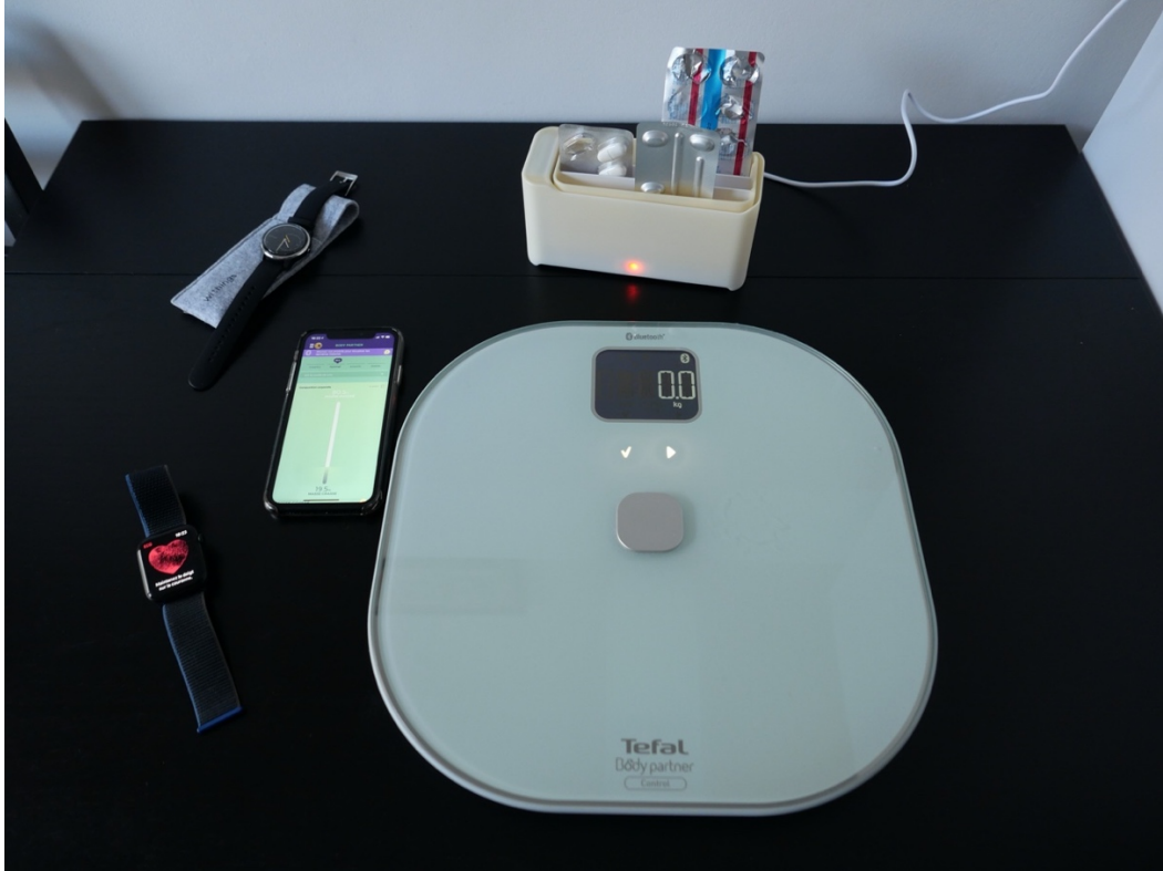
Figure 2 : La montre Move ECG de Withings®, l'Apple Watch Series 6®, le pilulier P-Heal® et la balance Tefal Body Partner® et son application associée.