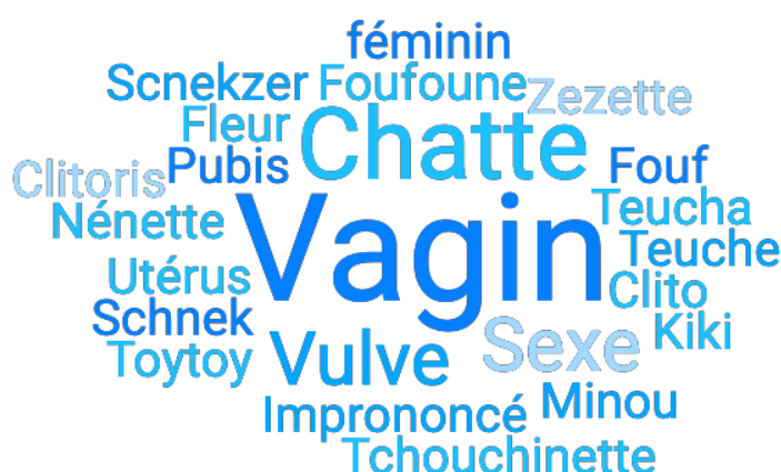
Figure 2 : Nuage de mots des noms donnés au sexe féminin

Trois personnes n'ont pas répondu à cette question.