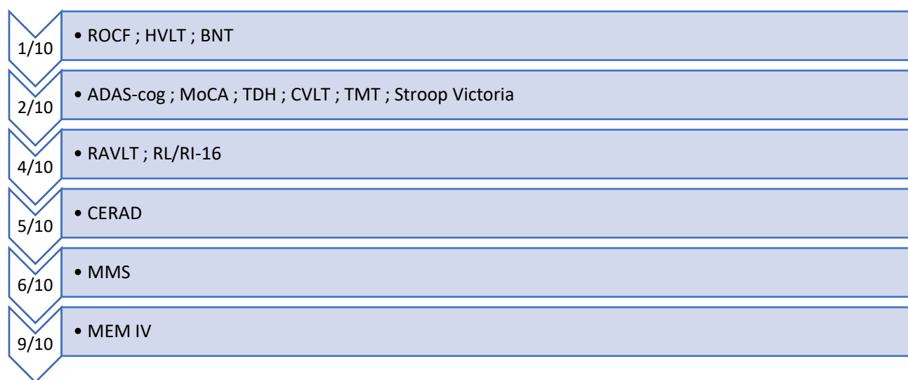
Figure 2. Liste des tests classés selon leur qualité en référence aux résultats du tableau 10.

Concernant le MMS, cet outil présente une bonne qualité d'étalonnage et psychométrique d'une part et permet l'évaluation de plusieurs fonctions cognitives d'autre part. Cependant, il ne peut être, lui non plus, considéré comme le test optimal pour l'évaluation des fonctions cognitives, car il présente une limite majeure. En effet, le MMS ne permet qu'un « screening » de l'évaluation des fonctions cognitives, il est donc utile dans la pratique du dépistage, notamment par le médecin généraliste, mais il apparaît comme insuffisant pour une pratique d'évaluation plus approfondie.