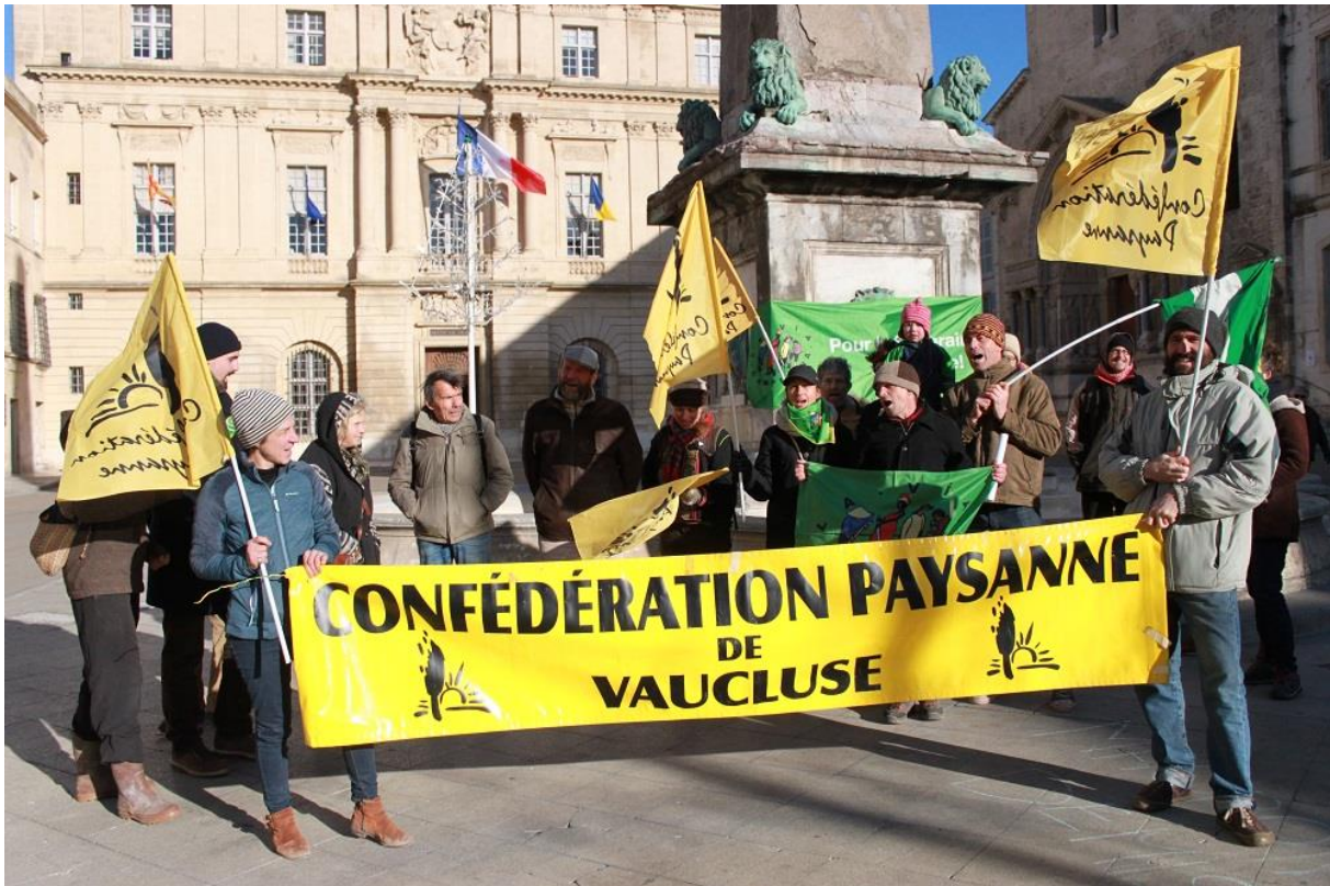
Rassemblement de soutien aux travailleurs détachés à Arles, le 10 décembre 2019.