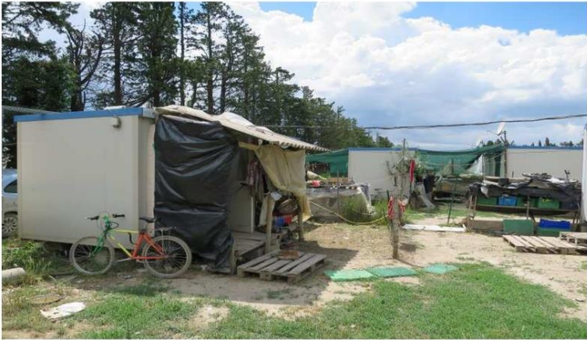
Un lieu d'hébergement fermé après une visite de l'inspection du travail et des gendarmes.