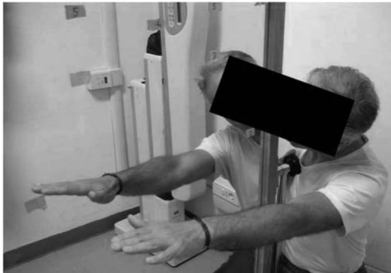
Figure 4 : Thérapie miroir du membre supérieur [17]

La thérapie par le miroir utilise le retour visuel pour compenser le déficit de proprioception, dans laquelle on demande au patient de réaliser des mouvements doux et lents avec les 2 mains. Le retour visuel de son membre sain doit lui faire oublier les troubles de son membre lésé. [1]