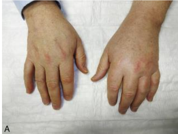
Figure 1 : Œdème de la main dû à un SDRS [2]

Phase II : phase dystrophique ou froide, s'étend de 3 à 6 mois