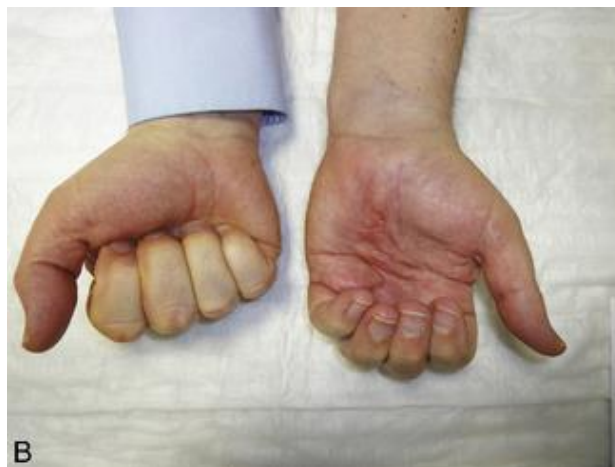
Figure 2 : Raideurs de la main dues à un SDRS [2]

Les troubles trophiques eux, sont souvent accentués à ce stade.