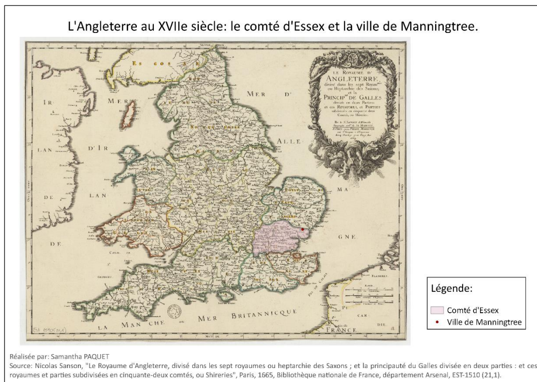
Figure 2 : L'Angleterre au XVII e siècle : le comté d'Essex et la ville de Manningtree.