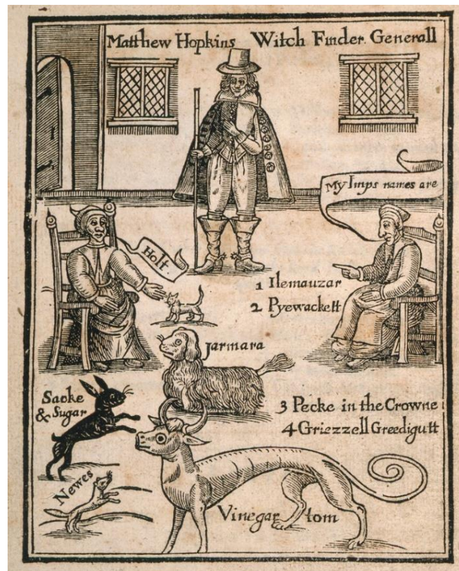
Figure 3 : Le frontispice de The Discovery of witches , auteur inconnu, Londres, 1647.

Par ailleurs, Matthew Hopkins choisit également d'illustrer son ouvrage avec un frontispice le montrant en train de démasquer deux sorcières, ce frontispice étant la représentation de l'une des réponses de son ouvrage, dans laquelle il décrit comment il a gagné son expérience de witchfinder . On peut considérer que cette gravure, dont l'auteur est inconnu, est tout autant un poing levé vers ses détracteurs que l'ouvrage lui-même.