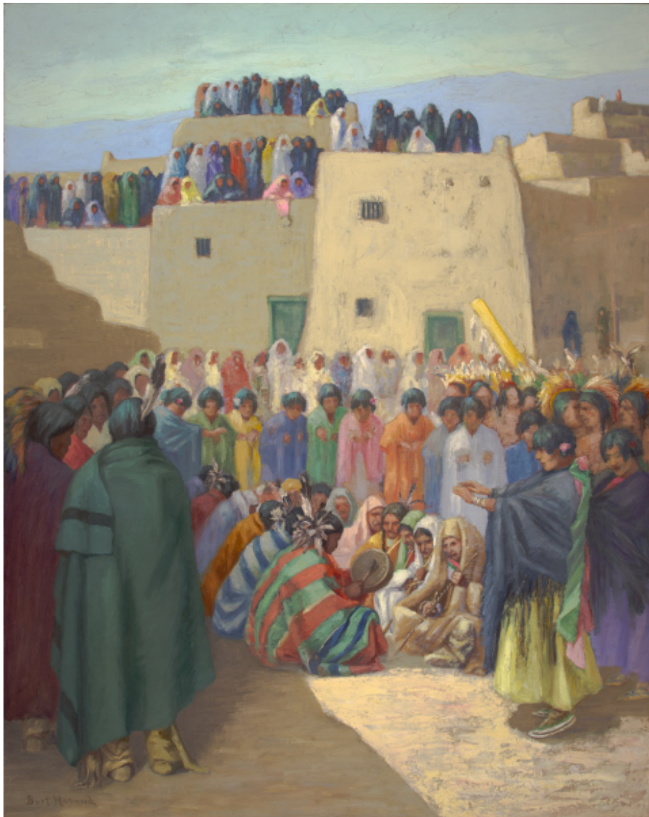
Illustration 1 Comanche Dance, Taos Pueblo par Burt Harwood (1920)