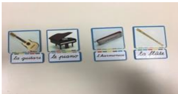
Document 36 : images des instruments et mots à associer

J'ai fabriqué les images manquantes des instruments avec le même procédé de couleurs.