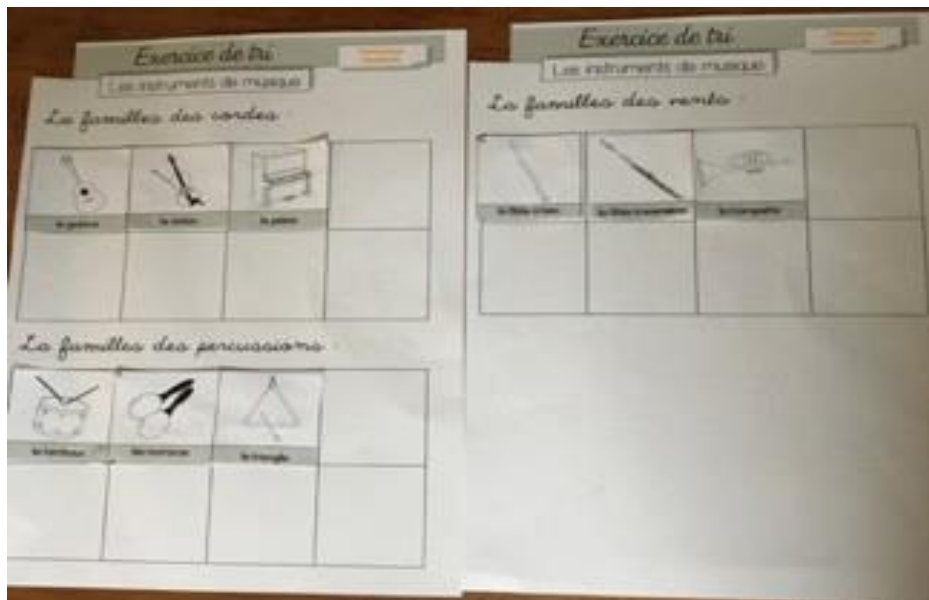
Document 34, classement des instruments en fonction de leur famille

Puis pour renforcer cet apprentissage, je leur ai proposé pendant plusieurs jours de rappeler sous forme de jeux ces 3 familles et de classer les instruments dans la bonne famille.