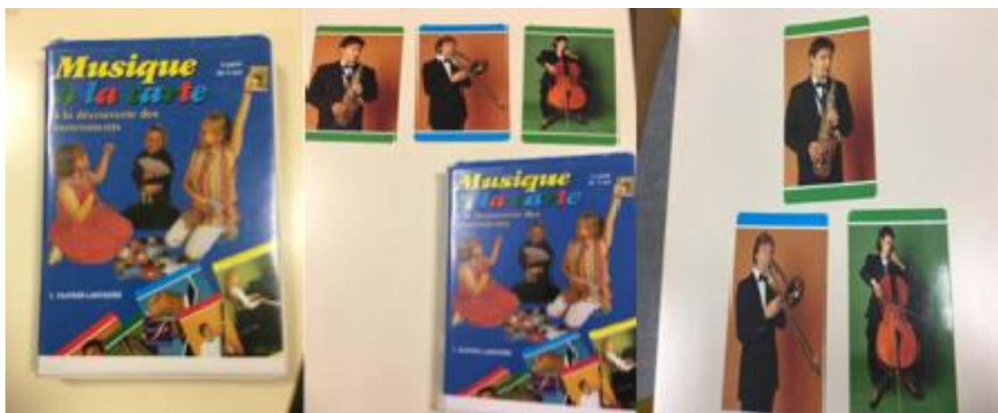
Document 35 : photos du livret « musique à la carte », éditions Fuzeau

J'ai donc utilisé ce livret : « musique à la carte » éditions Fuzeau