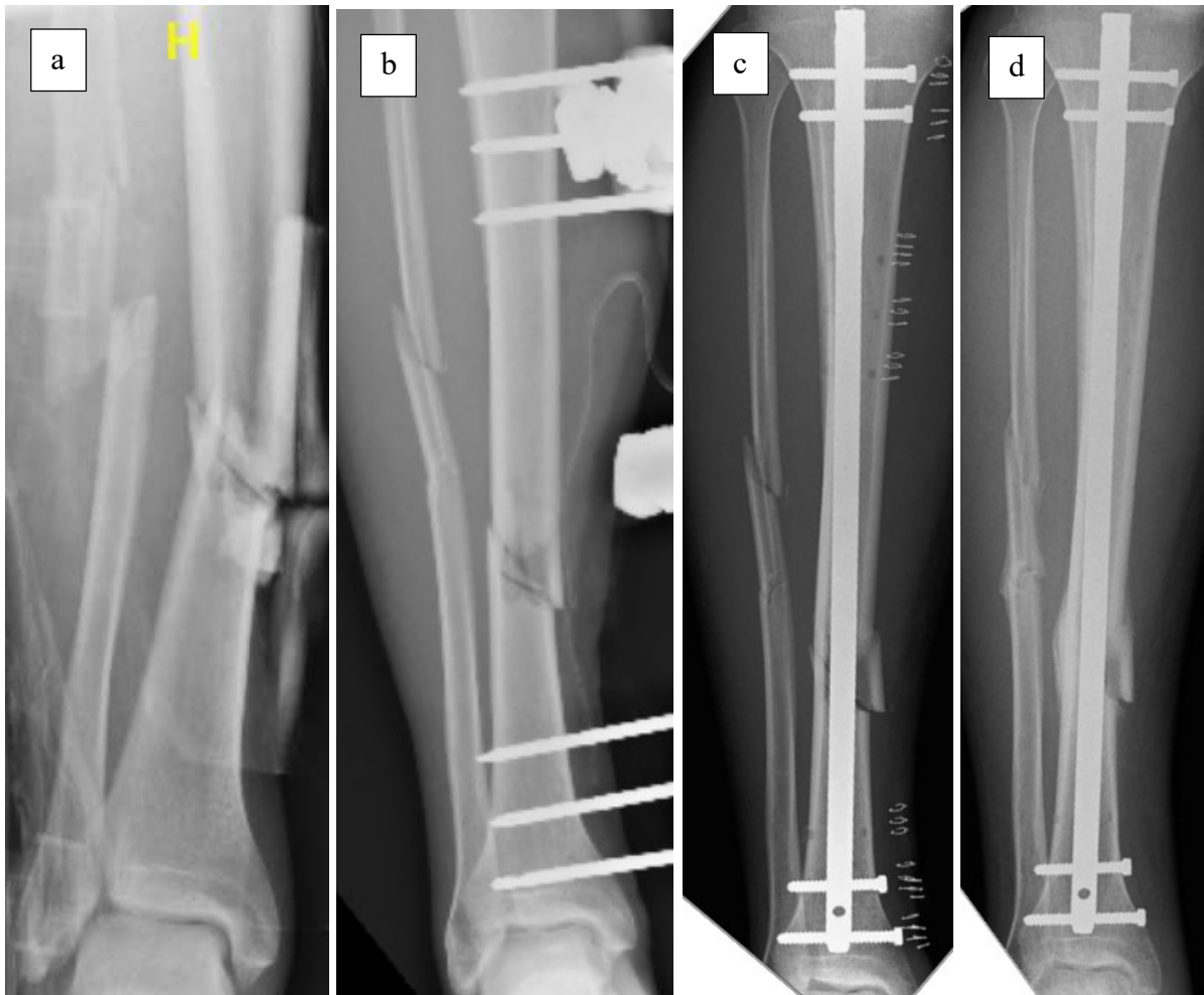
Figure 2 : Patient de 53ans victime d'un écrasement par une charge lourde ayant présenté une fracture ouverte Gustilo 3a. Radiographie pré opératoire (a). Post opératoire après fixation externe(b). Post opératoire après conversion en 1 temps à J18(c). Consolidation osseuse à 5 mois de la fracture (d)