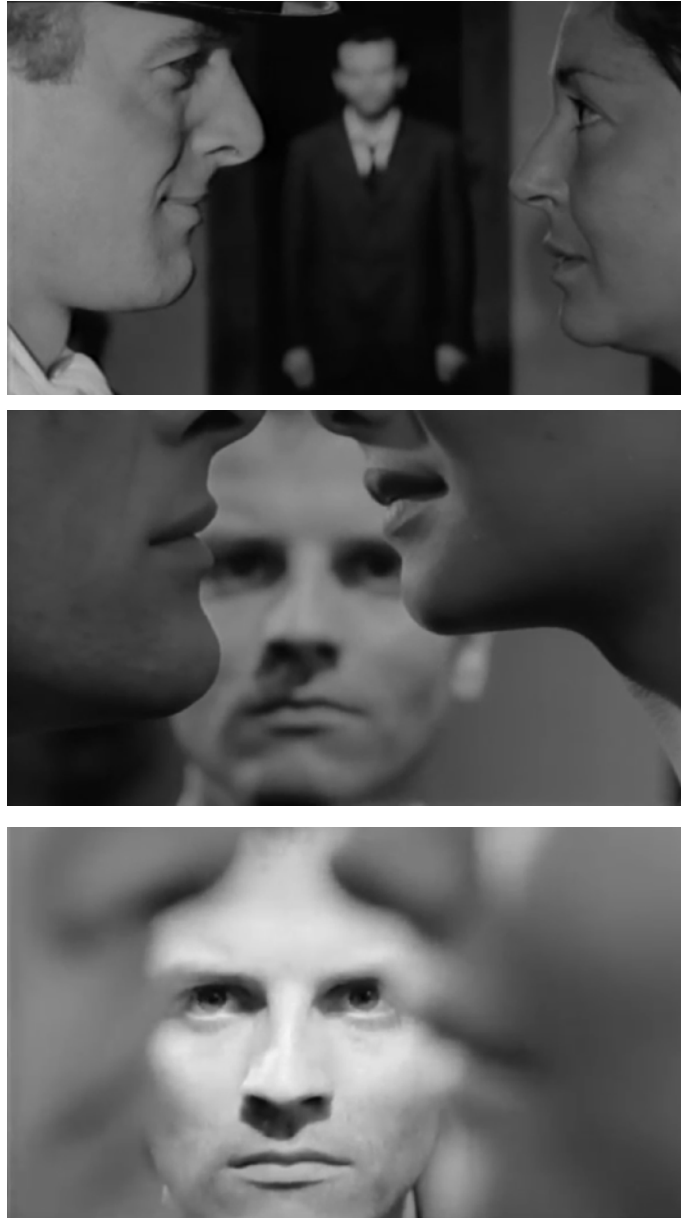
Fig. 50, 51, 52. Un homme à moitié

L'emplacement qui se constitue pour le sujet se façonne telle une sorte de « kinésphère », notion théorisée par Rudolf Laban dans le champ de la danse, que Benjamin Thomas décrit comme « l'espace accueillant les gestes [...] du corps individuel. C'est l'espace défini par les capacités de ce corps, qui permet de qualifier ce corps à son tour » 186 . Si l'immobilité du personnage semblerait en apparence se donner à percevoir comme la négation d'une kinésphère, considérer sous cet angle la spatialité relative au corps de Michele qui se dessine dans cette séquence permettrait en réalité de mesurer la frustration des gestes qui y seraient intuitivement actualisables : on peut retrouver dans ce travail sur le flou