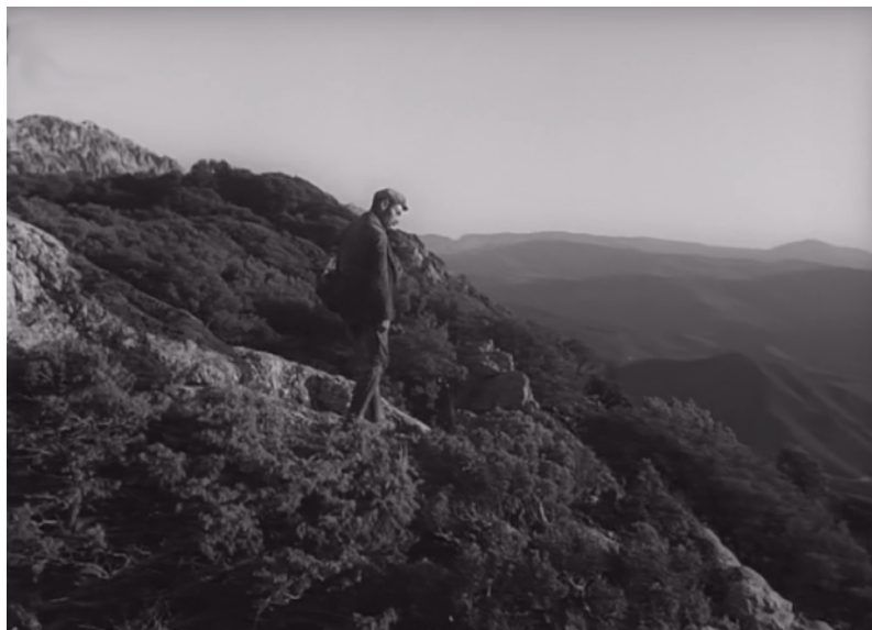
Fig. 1. Bandits à Orgosolo

effectivement observer ce principe dans le rapport que la mise en scène tisse entre les personnages principaux et le Supramonte, lieu d'isolement et d'exclusion par excellence de la société barbaricina , fréquenté uniquement par les bergers et les bandits, traversé par Michele et son frère pendant leur fuite des forces de l'ordre. Sur la base de la valeur attribuée par la communauté à l'espace référent, mais en remaniant sa matière pour la rendre signifiante, De Seta propose en ce sens à plusieurs reprises des plans des deux personnages se penchant sur le bord des falaises des montagnes, où les deux figures s'étalent sur les paysages s'ouvrant à la vue infinie en bas des rochers. Ces plans exposant un corps-observateur, tourné vers les plaines et les précipices au-delà des ravins d'où peut arriver la menace (les autorités mais aussi, au début du récit, les voleurs de bétail), départagent l'espace du cadre, où cohabitent un volume d'air immense et le sol sèche où s'appuient les personnages.