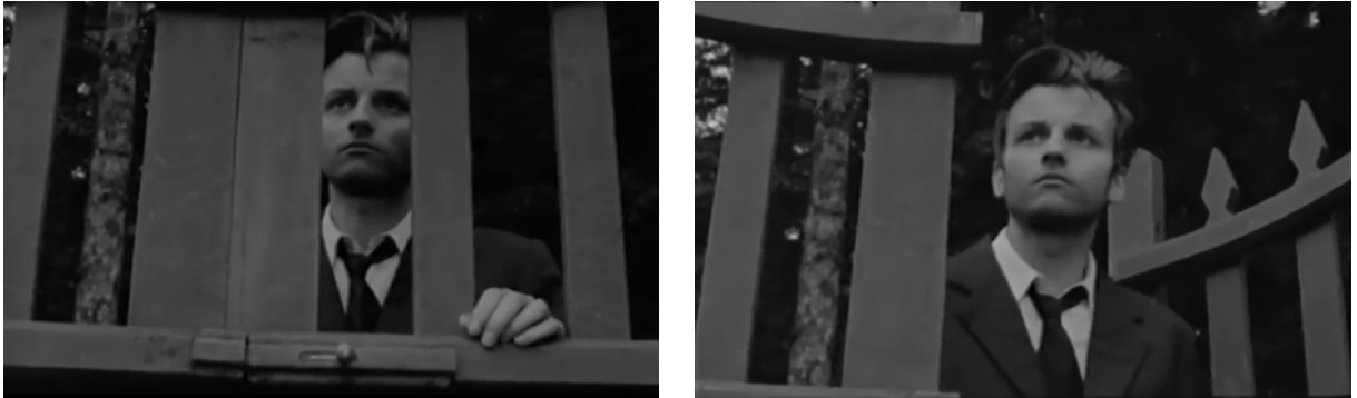
Fig. 37, 38. Un homme à moitié (à partir de gauche)

derrière le portail du jardin de la villa de son adolescence, désormais déserte (Figure 37). Son regard est tourné vers ce qu'il y a au-delà de cette dernière barrière encadrant son visage. Sa main rejoint le loquet et l'ouvre ; il accomplit le franchissement, fait un pas vers l'autre côté. Toujours en voix-off, Michele peut finalement considérer tout son parcours : 'Il ne suffisait pas de se souvenir. J'ai dû revivre. Éprouver à nouveau les mêmes souffrances du passé pour revenir à la vie' 152 .