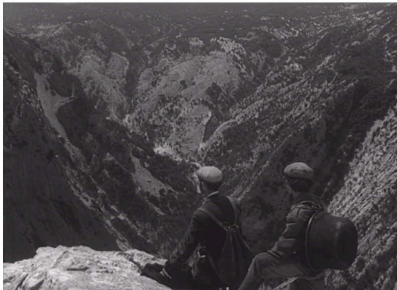
Fig. 28. Bandits à Orgosolo

Michele : 'Derrière les montagnes, dans un bercail que je connais. Là-bas ils ne nous chercheront pas.' 135