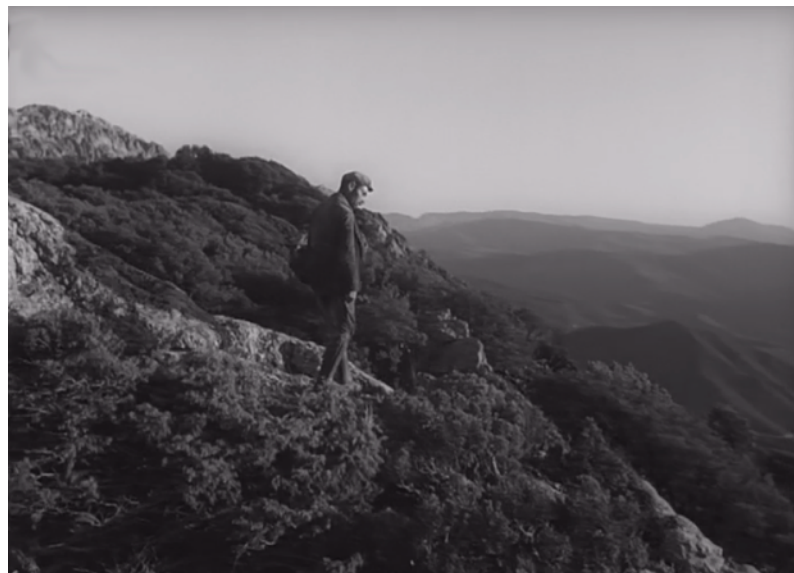
Fig. 1. Bandits à Orgosolo

effectivement observer ce principe dans le rapport que la mise en scène tisse entre les personnages principaux et le Supramonte, lieu d'isolement et d'exclusion par excellence de la société barbaricina , fréquenté uniquement par les bergers et les bandits, traversé par Michele et son frère pendant leur fuite des forces de l'ordre. Sur la base de la valeur attribuée par la communauté à l'espace référent, mais en remaniant sa matière pour la rendre signifiante, De Seta propose en ce sens à plusieurs reprises des plans des deux personnages se penchant sur le bord des falaises des montagnes, où les deux figures s'étalent sur les paysages s'ouvrant à la vue infinie en bas des rochers. Ces plans exposant un corps-observateur, tourné vers les plaines et les précipices au-delà des ravins d'où peut arriver la menace (les autorités mais aussi, au début du récit, les voleurs de bétail), départagent l'espace du cadre, où cohabitent un volume d'air immense et le sol sèche où s'appuient les personnages.