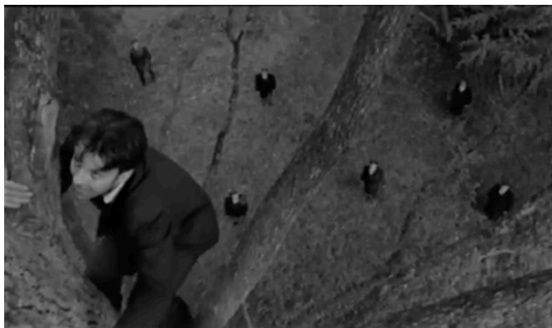
Fig. 29. Un homme à moitié

« Ce qui auparavant donnait lieu à de terribles conflits et à d'effrayantes tempêtes émotionnelles, apparaît maintenant, comme une tempête dans la vallée vue du sommet d'une grande montagne. La tempête n'est pas moins réelle, mais on est au-dessus d'elle, et non pas dedans. » 138