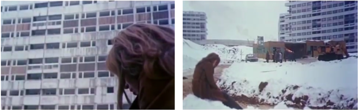
Fig. 9, 10. L'Invitée (à partir de gauche)

caractérisée par des décadrages, en sorte qu'Anne habite ainsi véritablement les marges du cadre, ce-dernier étant constamment envahi par les bâtiments en construction, qui semblent s'imposer comme des structures inquiétantes et menaçantes sur son corps réduit aux coins de l'espace de la représentation.