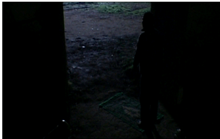
Fig. 23. Lettres du Sahara

abandonnée et décrépite où son cousin et d'autres immigrants habitent. Pendant la première nuit, le film s'arrête sur un moment où le jeune étudiant, de confession musulmane, accomplit les mots et les gestes de la prière individuelle. Dans deux plans analogues, Assane est montré en plan moyen et en contre-jour sur le seuil de la maison, sa silhouette à peine visible dans le noir (Figure 23). Cette composition à l'éclairage fortement contrasté, la seule source lumineuse étant située à l'extérieur vers où le jeune se tourne, dessine clairement les contours de la porte ouverte et se caractérise encore une fois par un angle de prise de vue cadrant le personnage de dos. Au-delà de l'orientation due à la Qibla , la position sur le seuil du sujet ne paraît pas casuelle. Les plans dont il est ici question inscrivent à l'image, spatialement, une coexistence particulière d'ouverture et de fermeture, qui se croisent dans le positionnement du sujet : aucune marge tangible sépare Assane de l'extérieur, rien ne lui empêche physiquement de franchir le seuil ; mais, en même temps, ce mouvement potentiel n'est pas actualisé.