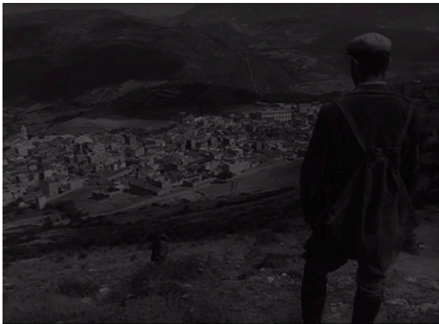
Fig. 47. Bandits à Orgosolo

La division que les films tracent dans l'espace l'extérieur, celle dont il a fait l'expérience qui a été rendue sensible à l'image, s'insinue à l'intérieur du sujet. Le retour lui est alors interdit. Parfois, la ligne de démarcation s'absente, la marge est à peine suggérée dans l'espace. Et pourtant, elle est là, on la perçoit, elle se manifeste dans le corps du film : le personnage en fait l'expérience corporelle, spatiale, bien qu'elle ne se situe que dans un espace intérieur . C'est ainsi que Michele constate l'impossibilité de revenir à Orgosolo, de revenir à la communauté qui ne lui sera plus accessible, dans l'une des dernières séquences du film, celle qui suit la mort des moutons, montrant le chemin des deux frères vers le village.