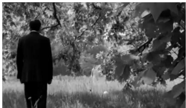
Fig. 11 Bandits à Orgosolo (gauche) ; Fig. 12 Un homme à moitié (droite).

Or, le fait de mettre en scène l'exclusion du sujet dans l'espace et plus précisément de l'espace tel que celui-ci l'effectue semble répondre à une exigence de positionnement qui est propre au cinéma desertien, comme l'illustre bien la contribution de Goffredo Fofi citée par Franco Blandi à propos Lettres du Sahara , mais facilement applicable à toute l'oeuvre de l'auteur : « Il y a une certaine façon de se situer de ce côté-là, autrefois en Italie on disait de la part des “classes subalternes”, ici il s'agit de “populations subalternes”. » 89 Chez De Seta, le positionnement de ce côté-là ne se réduit pas pourtant au choix de sujets, de thèmes, ni à un fait éthique, mais exprime un véritable être-avec de la part de la caméra, contribuant décisivement à la perception de la topographie des films. On pourrait alors identifier une certaine cohérence dans la revendication du réalisateur d'une méthode de tournage qu'il