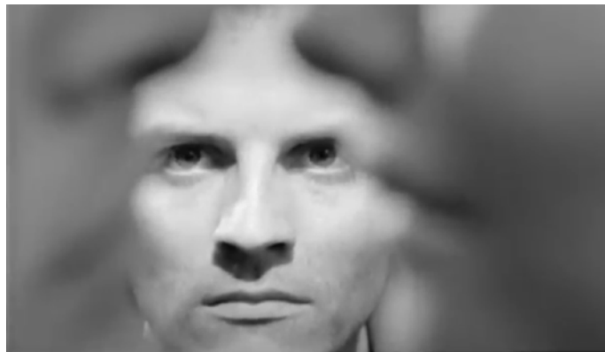
Fig. 50, 51, 52. Un homme à moitié

L'emplacement qui se constitue pour le sujet se façonne telle une sorte de « kinésphère », notion théorisée par Rudolf Laban dans le champ de la danse, que Benjamin Thomas décrit comme « l'espace accueillant les gestes [...] du corps individuel. C'est l'espace défini par les capacités de ce corps, qui permet de qualifier ce corps à son tour » 186 . Si l'immobilité du personnage semblerait en apparence se donner à percevoir comme la négation d'une kinésphère, considérer sous cet angle la spatialité relative au corps de Michele qui se dessine dans cette séquence permettrait en réalité de mesurer la frustration des gestes qui y seraient intuitivement actualisables : on peut retrouver dans ce travail sur le flou