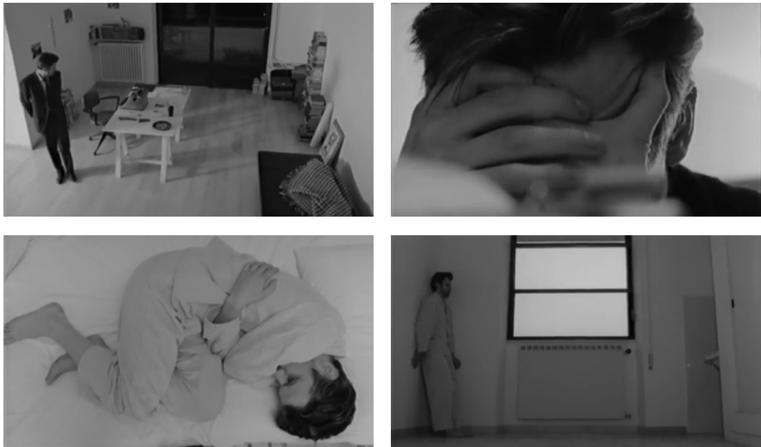
Fig. 13, 14, 15, 16. Un homme à moitié (à partir de gauche en haut)

de ses visions du passé. Dans ces lieux, tout est mis en relation avec l'intime du protagoniste, avec son incapacité à établir un contact avec les autres, avec une inadaptation qu'il éprouve mentalement et à la fois spatialement (la concordance de l'enfermement physique et psychologique est flagrante lors de son hospitalisation). Dans le même mouvement que celui de son âme qui n'arrive pas à s'ouvrir à l'extérieur, l'espace qu'il vit semble rétrécir, et ainsi le piéger. Les plans, souvent très brefs et toujours fixes, se multiplient, en décrivant par petites touches les contours des lieux clos. Les cadrages en plongée, très recourants, s'alternent à de gros et de très gros plans sur le visage souffrant de Michele, fréquemment couvert par ses mains. La seule possible modalité d'être à ces lieux pour le sujet est l'immobilité. Un sens de spatialité asphyxiant se produit : les murs des chambres et des maisons, les limites concrètes qui le séparent de l'extérieur, s'étreignent autour de son corps.