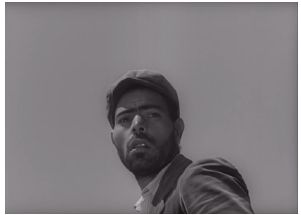
Fig. 24, 25. Bandits à Orgosolo (à partir de gauche)

D'ailleurs, les situations diégétiques et le ton narratif dans lesquels advient la fuite diffèrent considérablement d'un film à l'autre ; l'histoire de Bandits à Orgosolo fournit probablement les circonstances les plus « contraignantes ». Cependant, cette idée de