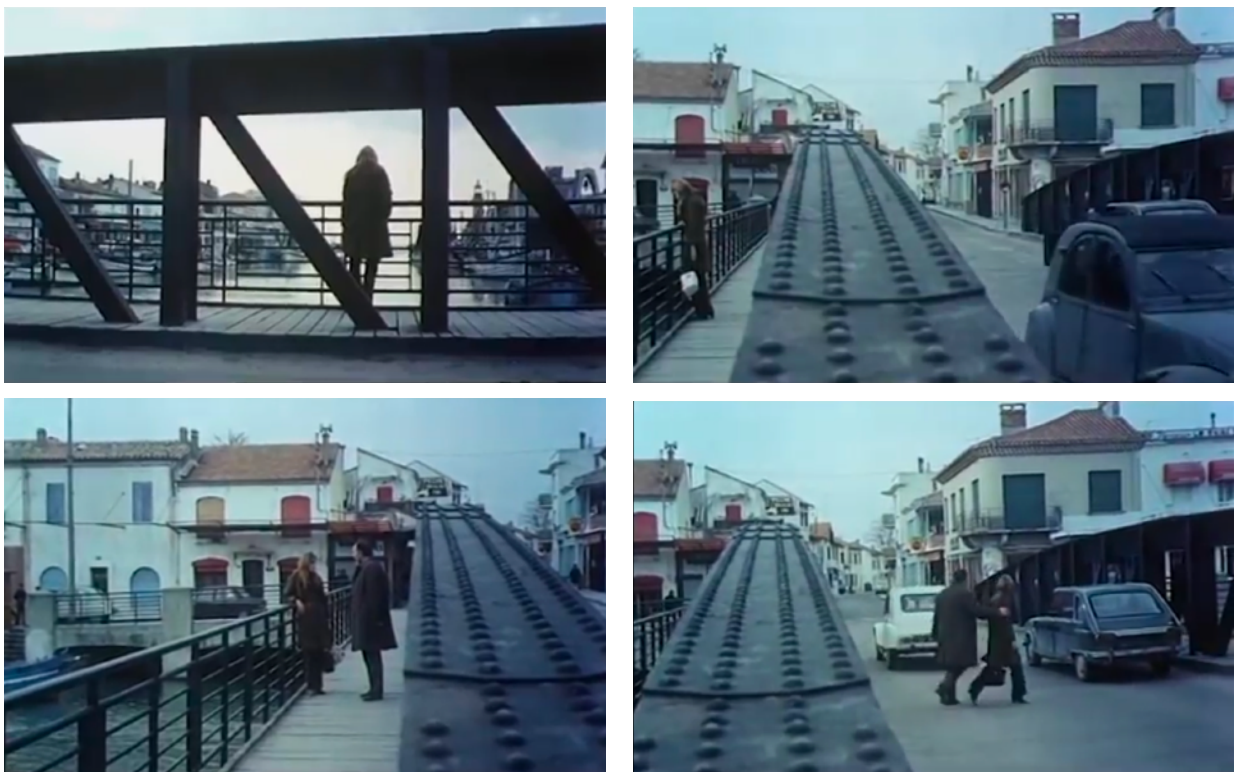
Fig. 33, 34, 35, 36. L'Invitée (à partir de gauche en haut)

plan en travelling avant, filmant la protagoniste de dos, suit son mouvement. Point culminant de la quête qu'elle a entreprise, Anne se confronte à la source de son sentiment d'exclusion, la source de sa marginalité, l'homme qui l'a trahie. L'Ailleurs dont la jeune femme a été exclue est à un pas d'elle. Mais le travelling avant s'arrête, la jeune n'avance plus vers le véhicule. À l'aide d'une ellipse, on passe au plan moyen d'Anne qui marche le long d'un pont. La structure métallique de ce lieu l'encadre, l'emprisonne presque, dans l'une des compositions fortement géométriques typiques du film (Figure 33). Malgré le voyage, malgré l'itinéraire qu'elle a parcouru, son exclusion se réaffirme à l'image, elle demeure dans cet espace marginal construit par la mise en scène, correspondant à un espace existentiel qu'elle ne semble pas encore être en mesure de quitter. Un changement d'axe de prise de vue, déplaçant la position de la caméra de 90° par rapport au plan précédent, renforce dans un premier temps l'exclusion de la protagoniste, en l'isolant distinctement dans une portion du cadre : la structure métallique départage transversalement l'image en deux, en traçant plastiquement la limite qui détermine, encore une fois, la mise en marge du personnage (Figure 34).