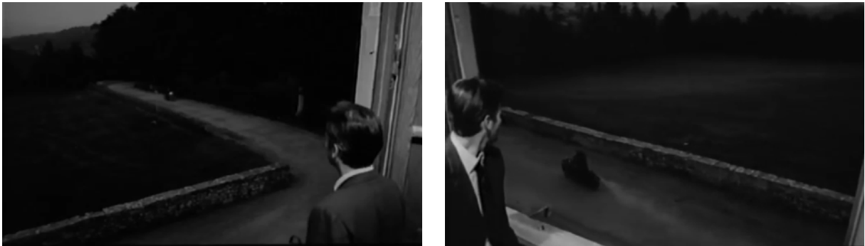
Fig. 21, 22. Un homme à moitié (à partir de gauche)

Au premier abord, le seuil se donne à voir et percevoir comme un espace-liaison, l'espace (minime) de conjonction entre deux espaces, l'ouverture vers un espace Autre. Dans cette perspective, on pourrait supposer que le seuil puisse laisser respirer le corps essoufflé et renfermé de Michele dans Un homme à moitié , qu'il puisse soulager sa conscience tourmentée. Motif qui s'apparente en quelque sorte au seuil pour sa portée spatiale et symbolique, une fenêtre grande ouverte s'étale effectivement dans sa chambre d'adolescent, lors de la scène du retour du frère aîné. Le personnage s'étant approché du rebord après avoir entendu le bruit de la motocyclette du frère dehors, le cadre s'emplit d'air, et l'atmosphère de constriction des quatre murs est pendant un instant brisée.