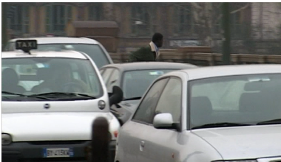
Fig. 8. Lettres du Sahara

La ville chez De Seta constituerait alors non seulement l'espace d'une non-synchronisation du sujet à ses rythmes, de trajets aux modalités confuses et limitées, mais deviendrait aussi susceptible de fournir les formes visibles et sensibles du malaise du personnage, contraint à une existence aux marges. Même si dans L'Invitée il n'y a pas exactement de moments qui se déroulent en ville, la séquence du chantier semble s'inscrire dans ce traitement particulier des formes urbaines, apparaissant comme inhabitables.