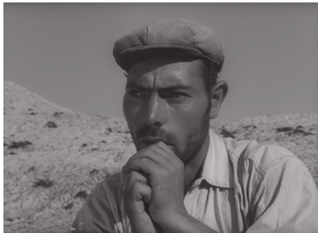
Fig. 41, 42. Bandits à Orgosolo

À l'envers de L'Invitée , le franchissement ne mène pas à bien parce que c'est un passage intérieur qui a été réalisé sans même que le sujet s'en rende compte. La marge-limite demeure indépassable, le personnage desertien doit revenir à son exclusion, à l'isolement et la marginalité qui, au fond, lui étaient propres dès le début. L'emplacement de l'autre côté ne peut s'effectuer pour Michele qu'au moyen de cette reconnaissance, qui le mènera finalement à la répétition de l'injustice initiale, lorsqu'il dérobera un autre pauvre berger, tel qu'il l'était lui aussi, de son troupeau. Le film se conclue ainsi sur un plan général où l'on voit Michele s'éloigner vers l'horizon avec les moutons volés. Le protagoniste s'avance dans l'espace rocheux jusqu'à disparaître, se confondre avec sa texture, tandis que depuis le hors-champ le berger braqué, immobilisé, prononce le mot final du film, en le criant contre Michele : ' Bandito '. C'est à ce moment uniquement que le protagoniste peut faire pleinement corps avec la pierre du Supramonte, et que l'entr'appartenance d'espace et sujet assume le sens fatal du cycle, réitérant sa marginalité absolue.