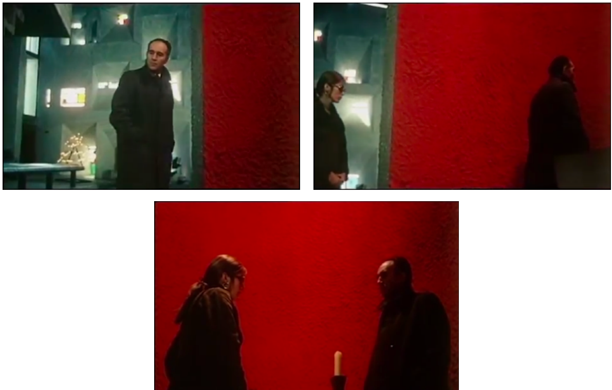
Fig. 30, 31, 32. L'Invitée (à partir de gauche en haut)

construction du cadre » 145 , en particulier par rapport à l'évolution de la répartition des masses visuelles au cours du plan et à la position des personnages dans le champ. François est d'abord montré seul en plan américain au centre du cadre (Figure 30). Ceci est découpé nettement par un mur d'un rouge très vif, en occupant précisément le tiers droite, alors que le reste de la composition laisse voir le fond gris de la chapelle où apparaissent les vitraux d'où filtre la lumière. L'élément architectural paraît ici établir une limite, démarcation géométrique qui tranche l'espace du cadre en deux. Lorsqu'un recadrage accompagne lentement le déplacement de l'homme vers la droite, vers le mur rouge, Anne apparaît à l'extrémité gauche du cadre (Figure 31). Le mouvement suit les deux personnages, jusqu'à ce que le mur rouge ne s'étende entièrement derrière eux (Figure 32). Le pivotement sur l'axe donne l'impression d'exclure progressivement tout volume d'air de l'espace du plan, en l'ôtant de profondeur.