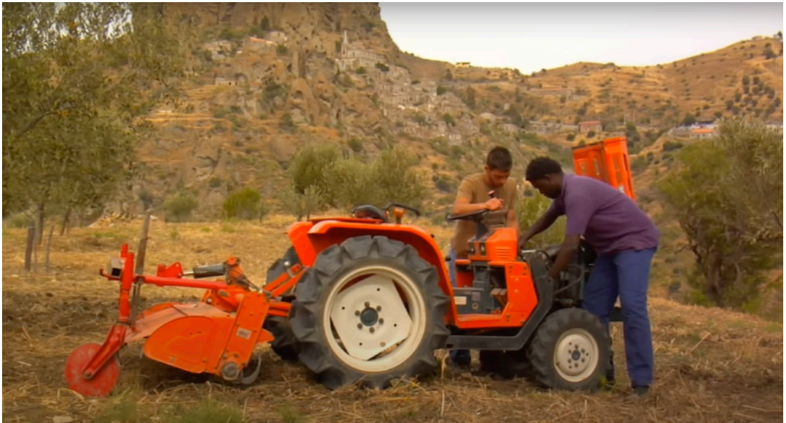
Fig. 66, 67. Articolo 23 (Pentedattilo)