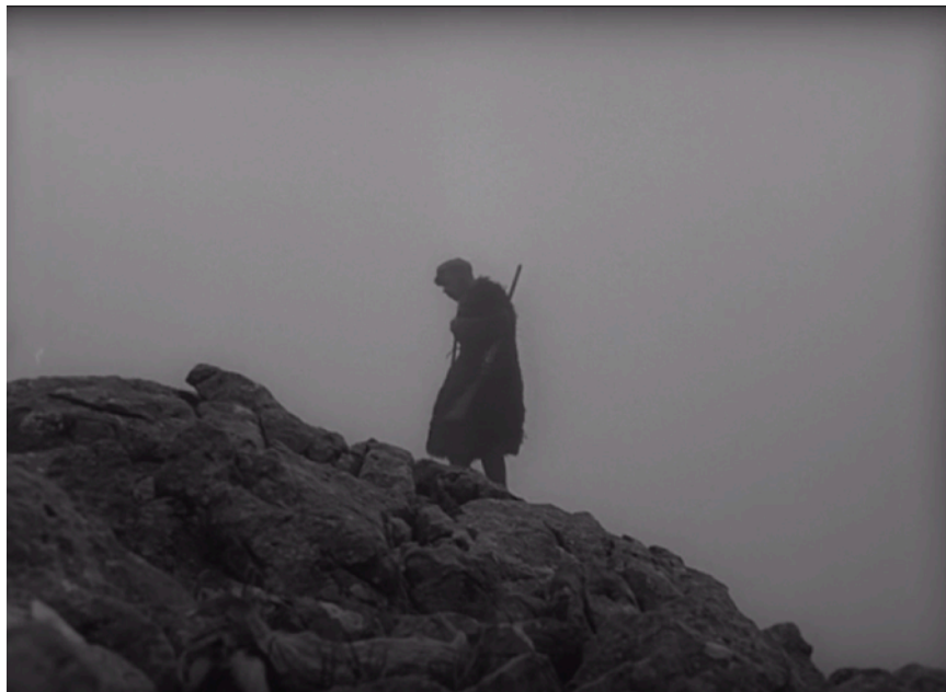
Fig. 53. Bandits à Orgosolo

il le pratique. Le premier est un plan en légère contre-plongée, où le cadre se départage nettement entre les rochers dans la partie inférieure et le ciel brumeux et monotone en haut. Michele entre dans le champ en bas, en plan moyen, en train de monter — sa silhouette se manifeste progressivement, avançant derrière les rochers qui le cachaient partiellement à la vue. Il s'arrête et tourne la tête. Un gros plan rapproche le regard de la caméra, alors qu'il continue de chercher l'animal. Il entend un bêlement ; on revient au plan moyen. Le berger se déplace enfin vers la gauche du cadre et, en descendant, disparaît derrière ( dans ? ) la pierre.