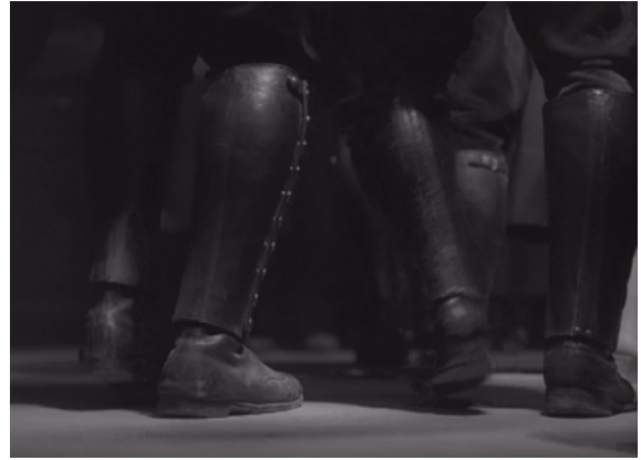
Fig. 17, 18. Bandits à Orgosolo (à partir de gauche)