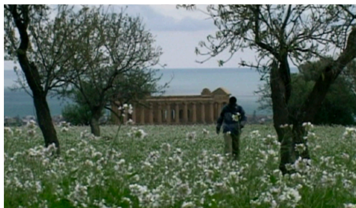
Fig. 54, 55, 56. Lettres du Sahara