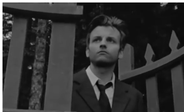
Fig. 37, 38. Un homme à moitié (à partir de gauche)

Faire les comptes avec l'origine, pouvoir la reconnaître, même si cela implique la réouverture de vieilles blessures et de déchirures intérieures. C'est ainsi que les films de De Seta suggèrent le dépassement de la marge-limite, de ce qui rend ses personnages étrangers aux autres, voire, maintenant on le comprend, à eux-mêmes. Mais le simple fait de se placer de l'autre côté, suffirait-il à pouvoir se démarginaliser , à quitter la marge ? L'ambiguïté sous-jacente au franchissement persiste pour ceux qui ne sont pas prêts à cette reconnaissance, ou pour ceux qui éprouvent le trouble du déplacement , se perdent de l'autre côté et semblent de cette manière ne pas réussir l'épreuve du passage. La possibilité d'une double lecture d'une scène de Lettres du Sahara perce la complexité des effets du franchissement sur celui qui l'opère.