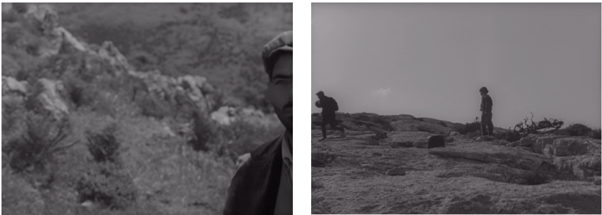
Fig. 48, 49. Bandits à Orgosolo (à partir de gauche)

fonctionner comme le « cadrage décentré » que José Moure identifie comme un effet plastique se présentant dans le cinéma d'Antonioni, condamnant « le (ou les) personnage(s) à une présence périphérique » 177 . Le déplacement du personnage le mène en effet jusqu'au bord de l'image, jusqu'à ce que la limite du cadre ne découpe son visage. Mais le cut intervient avant qu'il puisse sortir complètement du champ, ne permet pas à son corps de s'échapper complètement de cet espace qui est pourtant devenu inhabitable. Le personnage est pris dans une sorte de mouvement de soustraction, une soustraction à peine entamée à l'espace où il ne peut pas s'ancrer, auquel il ne peut plus appartenir et avec lequel il ne peut plus faire corps, mais aussi en quelque sorte à la compréhension, à l'espace de la représentation. Et pourtant, le film lui nie l'accomplissement de ce mouvement.