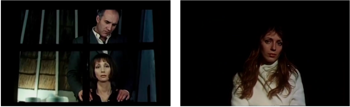
Fig. 19, 20. L'Invitée (à partir de gauche)

Du corps dans l'espace jusqu'au corps des images , De Seta inscrit dans les lieux clos, en le circonstanciant, l'Ailleurs dont ses personnages sont mis à l'écart, évoqué indirectement ou s'imposant dans le flux filmique. La marge-limite s'atteste de caractère consubstantiel à un être-au-monde qui se définit par l'exclusion de ce qui lui est extérieur, une exclusion à l'apparence d'enfermement presque organique, ainsi à la fois spatialisée telle une expérience corporelle et rendue plastiquement sur la surface de l'écran.