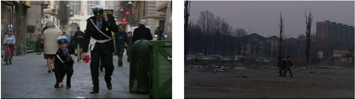
Fig. 26, 27. Lettres du Sahara (à partir de gauche)

en plan d'ensemble d'un terrain vague dans la banlieue turinoise (Figure 27), où le groupe de migrants marche lentement. En accord avec l'apparence répulsive des formes urbaines, Assane se retrouve chassé du centre ville, ne peut habiter que des zones limitrophes, où l'on ressent à l'image une sorte de relâche, en raison du sens de spatialité étouffante qui disparaît pour laisser sa place à un volume d'air plus important — même s'il s'agit d'une zone à l'apparence dégradée.