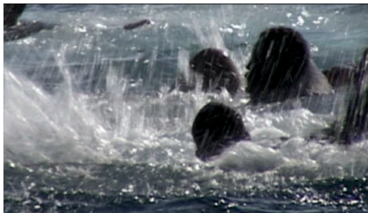
Fig. 43, 44. Lettres du Sahara

L'échec d'emplacement de l'autre côté, parfois brutal, oblige le personnage desertien à se mettre face à soi-même. Le franchissement révèle alors l'imperfection, le déséquilibre, de