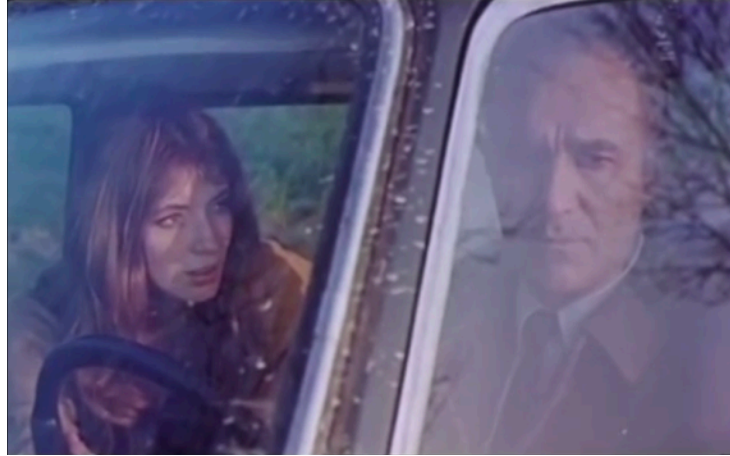
Fig. 2. L'Invitée

travail très recherché sur la présence à l'écran de la voiture où se trouvent pour la plupart du film les deux personnages principaux, la protagoniste Anne et son employeur François qui l'accompagne dans son voyage.