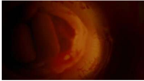
Fig. 57 Hannibal S03E10