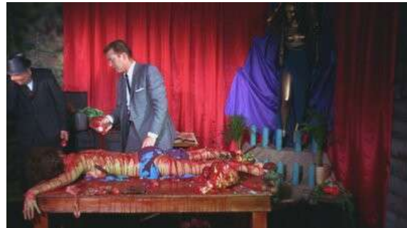
Fig. 26 Blood Feast (1963)