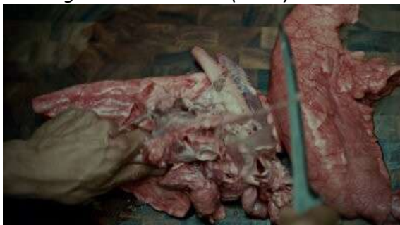
Fig. 27 Hannibal S01E01