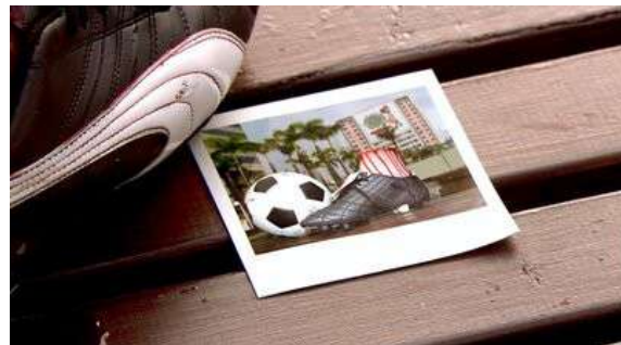
Fig. 105 Dexter S01E04

Le modèle de la scène de crime est lié au passé de Dexter qui est inconnu du spectateur ; l'imitation n'est donc de facto reconnaissable. Au contraire, The Following réfléchit directement des événements perçus par les spectateurs puisqu'ils sont issus de la précédente saison. Mark, l'un des deux jumeaux tueurs de la saison 2, se sert de la scène de crime comme d'un moyen de pression