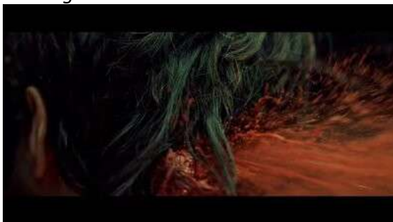
Fig. 51 Hannibal S03E04