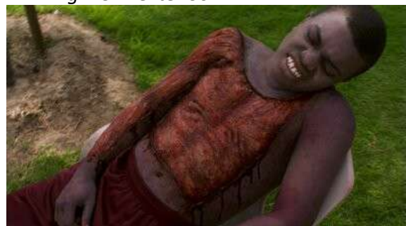
Fig. 75 Dexter S03E06

The Following propose une dernière modalité d'apparition du cadavre. Nous avons remarqué dans nos parties précédentes que dans cette série la mort était plus ou moins évacuée et que le cadavre était peu questionné. Néanmoins, évitons d'aplanir les propositions figuratives des séries en