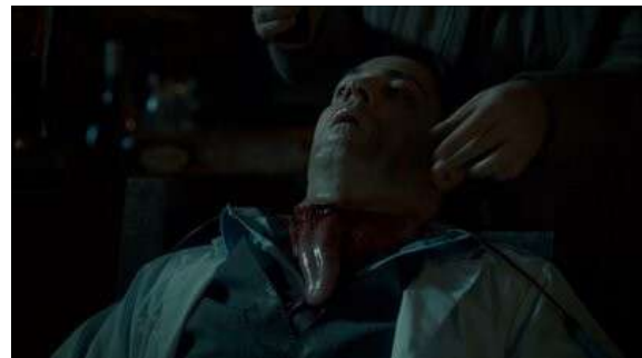
Fig. 36 Hannibal S01E11