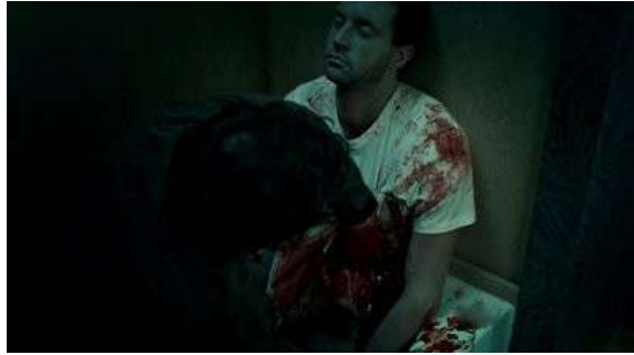
Fig. 32 Hannibal S01E07