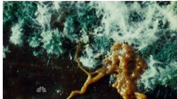
Fig. 67 Hannibal S01E02

Si les corps autopsiés apparaissent dans leur plus pur dénuement, des corps inutiles, sans secrets et entièrement visibles, les corps végétaux du modèle organique sont toujours un peu vivants puisqu'ils continuent, même après la mort, de participer à l'élaboration du vivant, toujours dans une forme de devenir : devenir-arbre, devenir-ruche, devenir-champignons. Dans Hannibal , les cadavres d'Hannibal sont autant visibles que ceux des tueurs épisodiques, puisqu'il est dans l'intérêt d'Hannibal que nous ne soyons pas en mesure de les distinguer. Dexter fait cependant le choix de distinguer très nettement le traitement des cadavres de Dexter et ceux des autres tueurs.