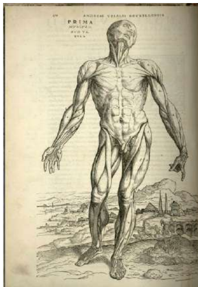
Fig. 74 André Vésale, De humani corporis fabrica