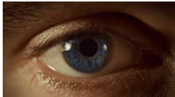
Fig. 30 Hannibal S01E04

Ce relâchement des schèmes sensori-moteurs 40 est ce qui différencie radicalement Will et Hannibal. L'un est le point de focalisation récurrent, qui tue en série lors de scènes de profiling , mais qui s'avère être incapable d'entrer réellement en action dans le monde « réel », tandis que l'autre est paradoxalement le plus actif des deux, mais ses crimes restent dans un premier temps cachés. Ce qui donne à la série ce rythme et ce ton si particulier. Par la suite, les rôles évolueront, mais restons-en pour l'instant à ce constat.