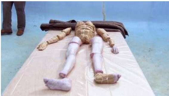
Fig. 68 Dexter S01E01

accorde une grande importance à la monstration des cerveaux directement sur la scène de crime ; Dexter semble presque s'adresser au spectateur lorsqu'il pointe les morceaux manquants (Fig. 70-71). Cette focalisation sur la représentation du cerveau est thématiquement justifiée par l'introduction du Dr Vogel, une neuropsychiatre spécialiste des psychopathes. C'est d'ailleurs elle qui dissèque des cerveaux dans son atelier et le tueur modèle sa pratique sur le métier de sa mère puisqu'il s'agit du fils du Dr Vogel. Dexter retrouve même un cerveau dans le réfrigérateur du cannibale de l'intrigue formulaire de l'épisode 8, c'est dire à quel point chaque saison possède son esthétique propre dont les motifs vont jusqu'à contaminer les intrigues formulaires. Si la représentation du cadavre est problématique quand il s'agit des actes commis par Dexter, la série n'hésite pas à montrer frontalement les actes commis par les antagonistes. C'est pourquoi la série est en mesure de nous montrer le cadavre carbonisé de Doakes qui fut tué, non pas par Dexter, mais par Lila, dans un retournement de situation bien pratique, évitant à Dexter d'assumer ses responsabilités.