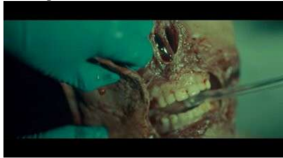
Fig. 59 Hannibal S03E04