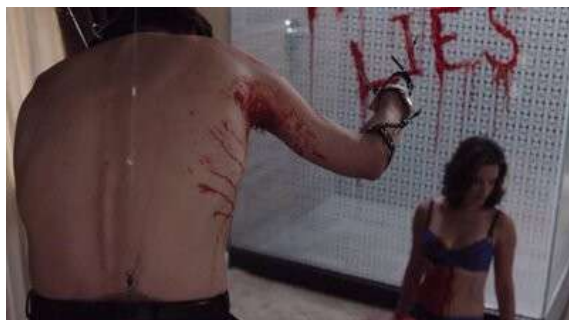
Fig. 106 The Following S03E01

Les crimes inspirés d'œuvres ou de scènes diégétiques postulent un spectateur privilégié puisque seul Dexter est en mesure de comprendre le sens de la mise en scène et que chaque imitation de Mark inscrit un nom avec du sang sur le mur soulignant fortement que le meurtre s'adresse à une personne précise. Notre dernière partie s'attardera sur les moments où le meurtre et la scène de crime postule une participation de l'enquêteur rompant avec la dichotomie entre le meurtre (le temps du tueur) et l'enquête (le temps de l'enquêteur) pour intégrer l'enquêteur à l'élaboration de l'œuvre du tueur.