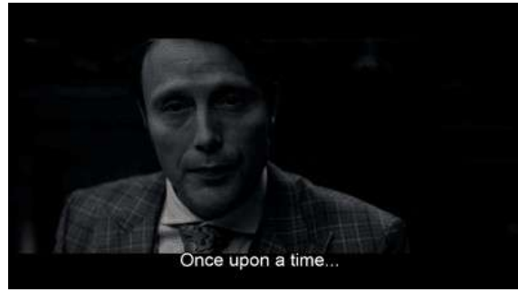
Fig. 91 Hannibal S03E01