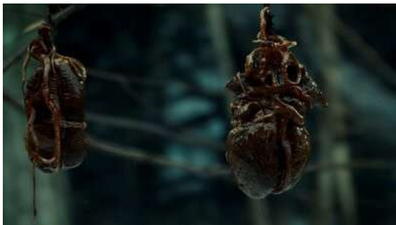
Fig. 35 Hannibal S01E11

travail de refiguration 45 . » Gideon opère un véritable travail de « refiguration » de la figure humaine tout en explorant les limites du corps humain. En effet, même si la scène n'est pas montrée, la victime est morte d'une crise cardiaque après que Gideon l'ait vidé de son sang (jusqu'à quand le cœur tiendra ?) Il finira par éventrer progressivement Frederick Chilton au cours d'une scène tragi-comique. Gideon sort méthodiquement un organe après l'autre en se demandant jusqu'à quand le corps est en mesure de supporter la perte de ses organes. La série joue le jeu de Gideon en cadrant en gros plan les organes déposés l'un après l'autre dans une bassine, ainsi que l'état critique de Chilton qui doit lui-même tenir ses tripes (Fig. 37-38). Il réorganise la relation de l'homme avec son propre corps : les organes sont en harmonie avec la nature, une langue sort de son espace privilégié pour devenir cravate, un homme doit entrer en relation tactile avec les quelques organes qu'il lui reste.