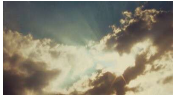
Fig. 43 Hannibal S03E06