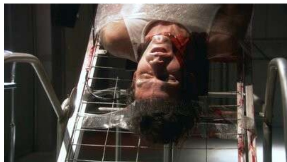
Fig. 20 Dexter S01E12