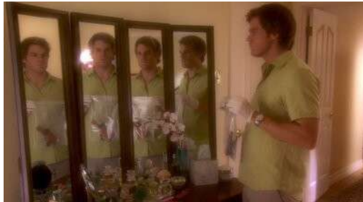
Fig. 2 Dexter S04E11

s'humanise, plus les intrigues parallèles entrent en corrélation compliquant l'aboutissement de ses objectifs. La série s'offre même un plan figurant les multiples identités de Dexter lorsque son père ironise sur la situation (Fig. 2).