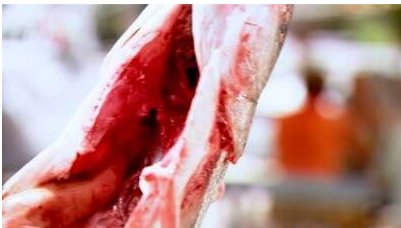
Fig. 72 Dexter S01E01

évidente. Après tout, les corps morts ne sont pas tous évacués puisque les cadavres liés aux antagonistes sont bel et bien visibles et la mort de Rita suit la logique esthétique des cadavres de la quatrième saison (notamment la femme assassinée dans son bain lors du premier épisode). L'opposition entre la visibilité de Rita et l'invisibilité des autres cadavres est donc à nuancer puisqu'elle s'inscrit dans une logique de visibilité commune aux tueurs saisonniers. De plus, il s'agit encore une fois d'une mort dont Dexter n'est pas directement responsable, ce qui justifie sa visibilité. L'analyse de Desmet n'est en aucune manière battue en brèche, nous voulions cependant rendre compte de la continuité esthétique entre la mort de Rita et les autres morts de la saison ; et plus généralement de la visibilité des cadavres qui ne sont pas liés aux actes de Dexter et qui suivent une logique esthétique propre à chaque saison.