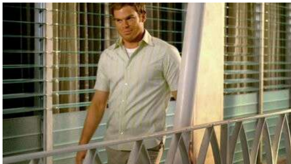
Fig. 88 Générique de Dexter

de l'épisode, cette référence au générique a pour fonction, comme dans le cas de la quatrième saison, de souligner l'évolution de Dexter au fil des saisons : il démarre comme un psychopathe serial killer mais termine la série en simple citoyen qui quitte Miami. Il s'agirait de « rebooter » la série puisque Dexter part vers de nouveaux horizons comme lorsque le générique reboot la série vers plus de formulaire ou pour s'en émanciper. Mais nous pouvons de plus envisager une autre éventualité si nous prenons en compte l'épisode suivant qui clôt la série. La présence souterraine du générique serait alors le moyen d'amorcer subtilement le retour de Dexter à la formule et au meurtre puisque la fin de la série opère une déformulation paradoxale lorsque Dexter tue sa sœur en tenue de serial killer tout en refusant de rejoindre Hannah. La série utiliserait alors le générique dans un sens assez proche de la deuxième saison lorsque la série convoque le générique au moment où Dexter retourne aux meurtres après une saison d'errance.