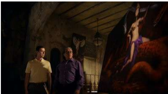
Fig. 102 Dexter S06E05