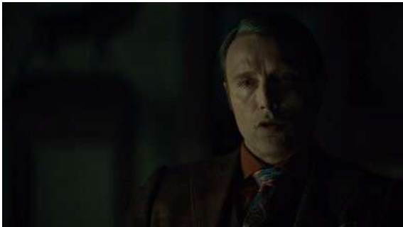
Fig. 3 Champ sur Hannibal... ; S02E11

personnages. Ce repas figure donc déjà explicitement d'un point de vue plastique le rapport très proche qu'entreprendront les personnages en cette fin de saison.