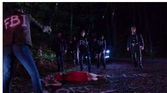
Fig. 107 The Following S03E01