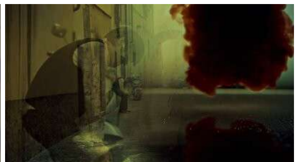
Fig. 41 Hannibal S03E06