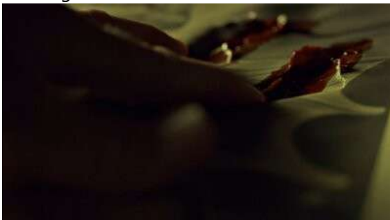
Fig. 100 Hannibal S03E12