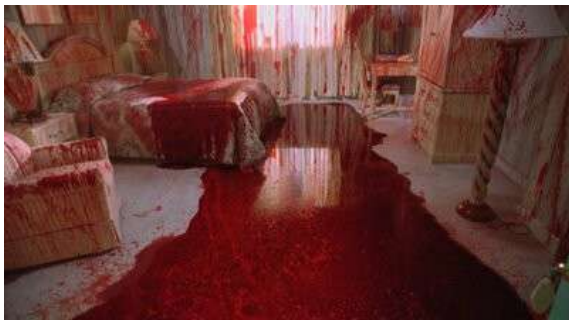
Fig. 15 Dexter S01E10

Dans un article consacré au Masque de la mort rouge 17 Florent Christol souligne qu'en renvoyant hors-champ toute représentation de l'horreur, le cinéma hollywoodien ne fait que retarder son apparition, dont le retour flamboyant sera proportionnel à la durée de son maintien hors du champ 18 . Cette interprétation allégorique du film comme représentant du cinéma hollywoodien correspond très bien à la situation du régime esthétique de Dexter . Constamment renvoyée hors-champ, la violence trouve un chemin détourné pour refaire surface sous une forme condensée. Ici, ce sont des dizaines de litres de sang que nous retrouvons au sein d'une même pièce, qui bien que correspondant aux victimes de son Némésis, est aussi symboliquement tout le sang versé par Dexter que la série refuse de montrer. Il s'agit aussi d'un retour de la scène matricielle du souvenir refoulé lorsque Dexter tombe dans la mare de sang comme lorsqu'il était enfant dans le container. Il s'agit à la fois d'une dimension psychologique (Dexter retrouve de plus en plus la mémoire) et d'une dimension figurale (un motif qui circule, se déplace).