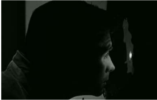
Fig. 114 Psychose (1960)