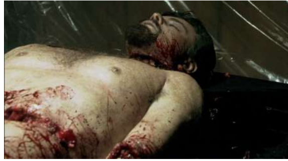
Fig. 79 Dexter S02E10