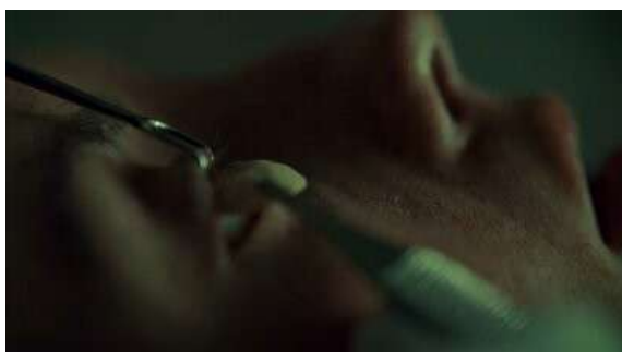
Fig. 82 Hannibal S03E02

l'esprit 75 tout en postulant qu'il n'existe rien qui soit séparable de la matière corporelle 76 . Le premier eidôlon à disparaître est celui d'Abigail lorsque la série revient dans un flashback sur son cadavre soumis à un travail de thanatopraxie (S03E02). La réalisation insiste sur la fermeture des orifices (œil et bouche) et sur l'extraction du sang propre à la pratique de l'embaumement. Cette idée sera reprise une seconde fois, toujours lors d'un flashback, lorsque Hannibal récupère le cadavre de Garret Jacob Hobbs pour qu'Abigail puisse le tuer une seconde fois. Cette apparition est la première, et la seule, qui réduit totalement le personnage à son statut de cadavre. Jusqu'à présent, le personnage restait vivant au travers des images-mentales de Will, mais ici la mort est figurée dans sa pure matérialité de corps mort : du liquide d'embaumement s'échappe de la plaie que lui octroie Abigail pour souligner la matérialité du corps et réfuter un possible eidôlon .