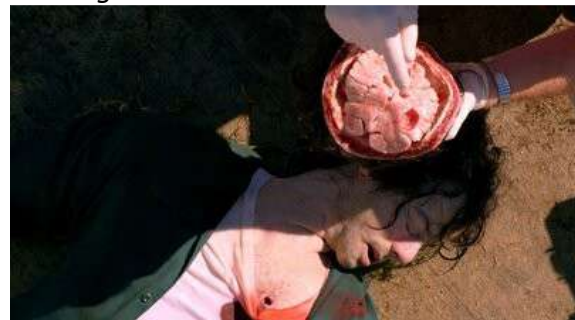
Fig. 71 Dexter S08E01

Jusqu'ici nous avons globalement affaire, concernant Dexter , à ce que Paul Ardenne nomme le « beau corps ». La saison 3 nous emmènera cependant sur le terrain du corps-viande : « parti du beau corps – celui que contient l'enveloppe charnelle du mort – l'œil du spectateur s'acheminera ainsi jusqu'au corps-viande, celui qui siège sous l'épiderme, voire jusqu'au corps intérieur dégénéralant sous l'effet de la putréfaction, qui offre des organes pourris à la vision 68 . » Le cadavre de Doakes, visible en fin de saison 2, répond déjà d'une esthétique du corps-viande (Fig. 73). Si l'on passe outre la