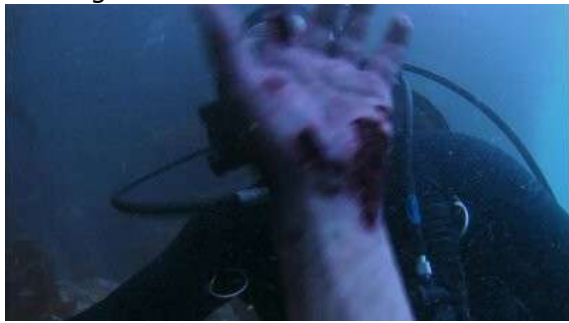
Fig. 80 Dexter S02E01