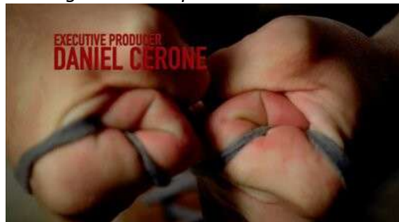
Fig. 87 Générique de Dexter

Le générique de Dexter explicite donc au travers du quotidien de Dexter la part sombre du personnage tout en convoquant les motifs de Schizophrenia 4 . Néanmoins, lorsque le générique sera convoqué au sein de la diégèse, il n'aura plus pour fonction de souligner la duplicité du personnage, mais de réfléchir son évolution et plus précisément les successifs reboot que subissent les structures narratives étudiées dans la première partie de ce travail. Si au travers du générique Dexter répète les mêmes rituels (et donc immobilise le personnage), chaque apparition du générique dans la diégèse aura pour fonction de mettre en évidence l'évolution du protagoniste.