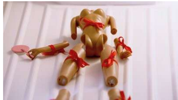
Fig. 69 Dexter S01E01