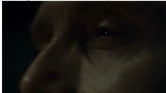
Fig. 6 Hannibal S02E11

Le traitement visuel des deux personnages renforce les enjeux scénaristiques de la saison lorsque leurs visages se mélangent et que les cadrages et le montage les unissent. Le montage produit même un dédoublement qui figure explicitement le devenir-Hannibal de Will 52 . Néanmoins à ce stade de la série Will reste un homme responsable dans le camp du bien puisqu'il tente coûte que coûte de mettre fin aux agissements d'Hannibal.