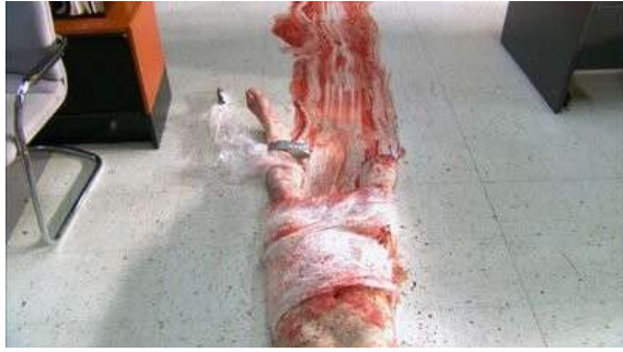
Fig. 78 Dexter S02E09