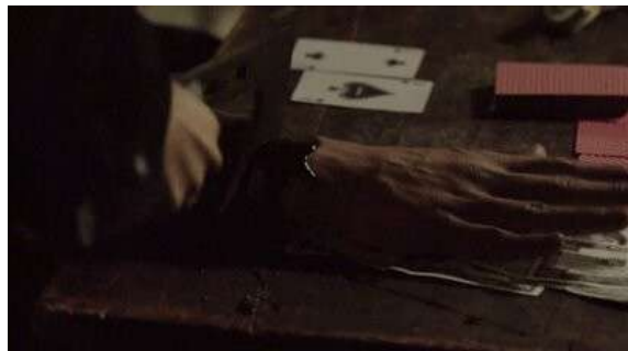
Fig. 61 The Following S03E06