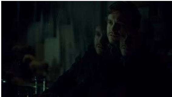
Fig. 7 Hannibal S03E03

dans l'ordre et leur redonner leur propre chronologie : Will se dédouble (figurant l'hésitation de la série concernant le statut de ce personnage) juste avant d'imaginer un autre monde possible (le meurtre de Jack), tandis que la scène suivante introduit Jack qui vient s'assurer que Will ne contredise pas la « narration officielle ». Le devenir-tueur de Will ouvre donc la série sur un feuilleton paradoxal (qui n'évolue que très peu), sur la théorie des mondes possibles (explicitement convoquée) et sur la figure du double (dédoublement figuratif de Will et association plastique avec Hannibal).