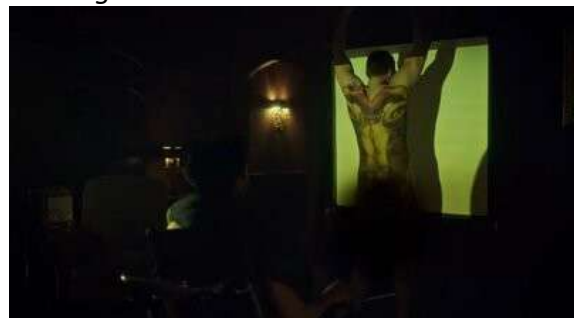
Fig. 97 Hannibal S03E12