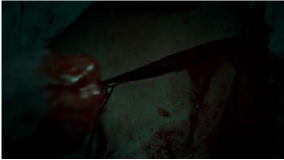
Fig. 31 Hannibal S01E07

perte de repères temporels, etc. Par contre, le profiling est le lieu privilégié pour la mise en péril de la figure humaine en dévoilant son fonctionnement. Will ouvre par exemple la cage thoracique d'un homme pour in fine lui faire manuellement un massage cardiaque (S01E07). L'intégrité du corps n'est que rarement respectée ; il s'agira souvent de creuser sous la surface pour y trouver une forme de vérité.