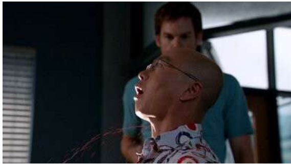
Fig. 17 Dexter S07E03

déplacement figural de la scène de meurtre, le sang coulant à flots sous une forme condensée parce qu'il est censuré par la série. Son apparition est aussi justifiée par le récit puisque Rudy (le tueur de la saison 1) a récupéré le cadavre d'une victime de Dexter pour l'exposer à la vue de tous. Dexter craint à ce stade du récit de voir ses crimes exposés et le rêve vient figurer explicitement ses craintes avec un plan qui montre tout le sang que Dexter a « sur les mains » comme le dit si bien l'expression.