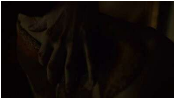
Fig. 98 Hannibal S03E12

are ? », avant de voir une version numérique kitsch du dragon (Fig. 101). Si le personnage de Francis Dolarhyde assiste à la vision d'Hannibal c'est bien ce dernier qui est à l'origine de cette figuration presque grotesque 39 . À cette version numérique du dragon s'oppose la version peinte que le personnage ingurgite à la fin du même épisode pour dépasser le modèle original et être en mesure de l'incarner véritablement. Dans Hannibal , le tueur ne s'inspire pas d'un modèle pour l'imiter (version The Following ), mais devient ce même modèle. C'est le passage de l'image fixe dessinée (la version originale) 40 à l'image organique du tableau (la transformation complète) qui conclut le véritable devenir-œuvre du serial killer .