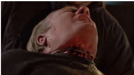
Fig. 60 The Following S03E06

simplement question d'une « mort du proche ». Une scène rend visible l'amputation d'une main ainsi que les conséquences qui résultent des actions du personnage : du sang qui coule du plafond, des cadavres baignant dans leur sang et une main restée seule sur la table (Fig. 62). Ces excès figuratifs de la violence sont sans précédent au vu du classicisme esthétique de la série, comme s'il fallait obligatoirement en passer par une représentation gore du meurtre pour donner de la consistance à ce nouveau personnage. Si elle s'avère courante dans Hannibal , cette esthétique gore et parfois même splatter (lors d'un tir à la tête ; Fig. 63), est une petite révolution esthétique dans The Following ; non pas que le gore soit l'horizon esthétique attendu et souhaitable d'une série télévisée policière, mais parce qu'elle entre en totale rupture avec les précédentes saisons.