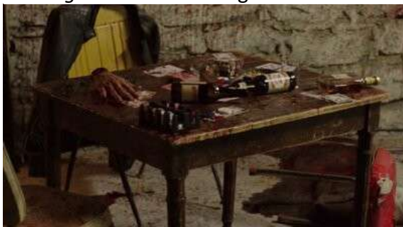
Fig. 62 The Following S03E06