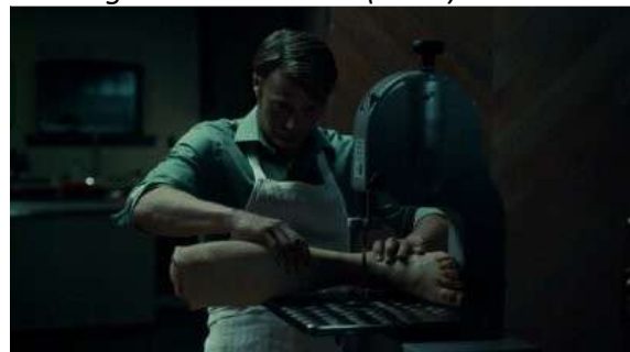
Fig. 28 Hannibal S02E02

Hannibal est un personnage dont nous ne percevons que l'apparence, le person-suit mentionné plus haut. Il est décliné en trois versions : Hannibal le psychiatre (avec sa panoplie de costumes éblouissants), Hannibal le cuisinier (où nous percevons l'atrocité organique de son activité) et Hannibal le tueur (généralement dans une tenue de protection en plastique qui recouvre les costumes). À chaque Hannibal sa tenue, caractérisant le personnage bien mieux que ne le fait le jeu de Mads Mikkelsen qui précisément tend à jouer le moins possible. Seuls un sourire ou une légère frustration sur son visage apparaissent parfois et qui sont comme autant d'événements tant le moindre signe d'humanité est bon à prendre face à ce visage tout en retenue. Revenons temporairement à Dexter . Dexter est à la fois perçu comme un manipulateur invétéré (son person-suit est parfaitement construit, bien mieux qu'Hannibal sur ce point, qui ne semble pas avoir de vie en dehors de ses meurtres et de son métier) et comme un tueur psychotique. L'acteur Michael C. Hall déploie alors deux types d'actorialité très différentes : le névrotique en manque (son excitation déborde parfois la maîtrise de soi, il rigole, gesticule, hausse le ton) et le timide réservé (le geek de laboratoire comme il aime à le rappeler). L'acteur articule ces deux rapports au jeu pour deux personnalités différentes (sans mentionner les micro-rôles qu'il endosse temporairement pour duper