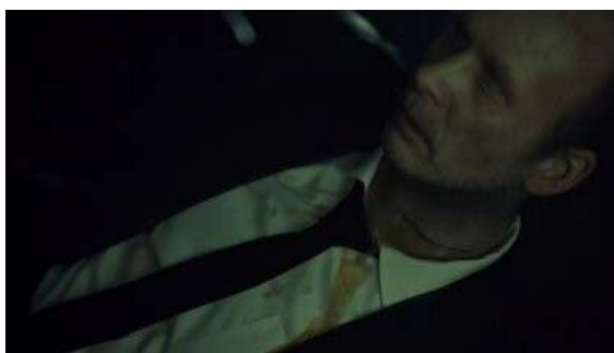
Fig. 83 Hannibal S03E09