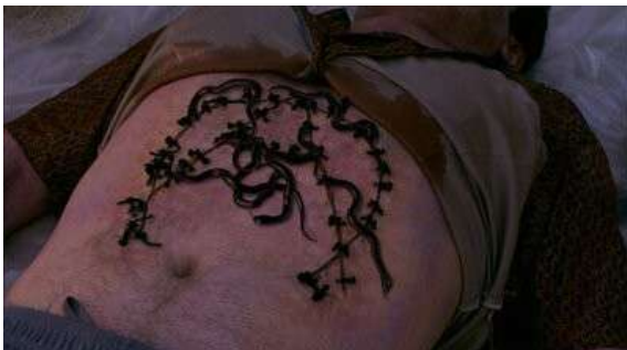
Fig. 110 Dexter S06E01

visions pour reconstituer la genèse ou compléter une œuvre, mais de participer pleinement à son élaboration. Le premier épisode de la saison annonce déjà le programme avec un cadavre sur une plage dont il faut ouvrir le ventre afin de faire sortir des serpents (Fig. 110). Si chaque meurtre est une imitation d'un événement biblique, ce n'est que par l'intervention des détectives et des experts légistes que le sens de la scène de crime peut voir le jour. Chaque scène de crime est de plus signée (presque comme on signe une œuvre de son nom) par les deux lettres de l'alphabet grec alpha et oméga. La deuxième scène de crime est encore plus explicite puisque la victime est encore vivante lors de l'arrivée de la police et c'est précisément sa précipitation qui enclenchera un mécanisme achevant la victime et déployant des ailes mécaniques (E04 ; Fig. 111). Mais la participation de la police ne s'arrête pas là puisqu'il faut encore ouvrir un placard afin de libérer des milliers de sauterelles pour que la scène de crime trouve son achèvement. Même chose pour le cadavre de l'épisode 9 où c'est la manipulation du cadavre qui enclenche le mécanisme faisant tomber tout le sang extrait du corps sur l'équipe de police. Chaque scène de crime implique donc son public puisqu'elle est par définition inachevée sans son intervention. La scène de crime devient réflexivement une œuvre d'art où le cadavre est pensé comme une installation, comme la partie d'un tout qui le dépasse.