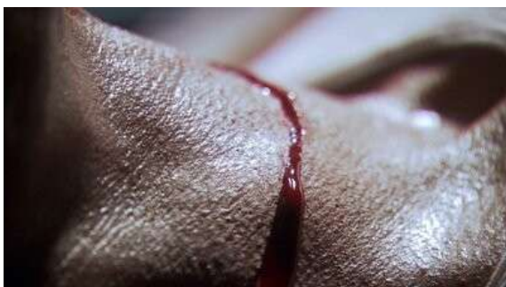
Fig. 19 Dexter S01E12

La série ne censure pas alors complètement la représentation de l'horreur issue de la pratique du serial killer . Néanmoins, ces scènes restent les exceptions qui confirment l'économie figurative générale à laquelle s'astreint la série dans son ensemble, constituée de condensations et de déplacements. Notons aussi que le pilote montre frontalement Dexter prendre un pied ensanglanté avant de le mettre dans un sac poubelle. Un plan très gore par rapport à ce que la série va tolérer par la suite (Fig. 24). C'est presque comme si le pilote n'avait pas encore mis au point l'esthétique de la série dans son ensemble et annonçait sans le savoir les exceptions futures que nous venons d'étudier.