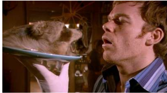
Fig. 113 Dexter S01E07