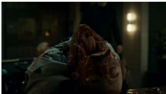
Fig. 34 Hannibal S01E10

Cette violence, qui est désormais visible, perpétrée sur les corps entame grandement leurs intégrités. Georges Didi-Huberman conceptualisera, à partir des écrits de Georges Bataille, la notion d'informe à partir de la figure humaine :