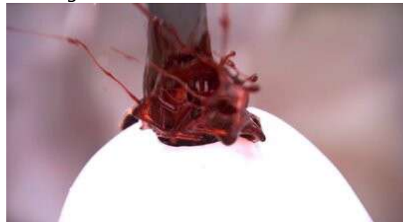
Fig. 14 Dexter S04E06

Un autre exemple encore plus probant de condensation et de déplacement est l'épisode 10 de la saison 1 lorsque Dexter rentre dans une pièce remplie d'une dizaine de litres de sang (Fig. 15-16). Cette scène a autant pour fonction de rendre lisible la progression narrative de la série (voilà où se trouve le sang des victimes exsangues) que de rendre visible ce que la série ne cesse d'occulter.