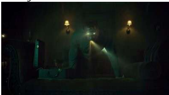
Fig. 96 Hannibal S03E08