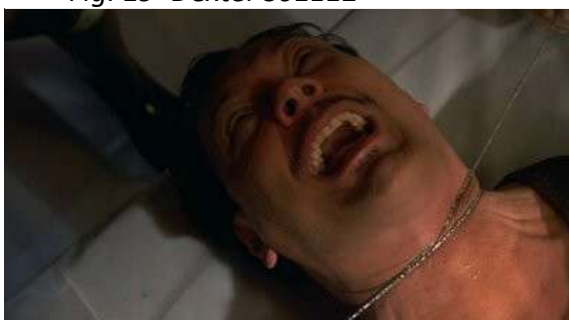
Fig. 21 Dexter S03E11