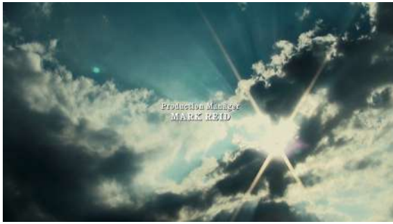
Fig. 42 Hannibal S02E13