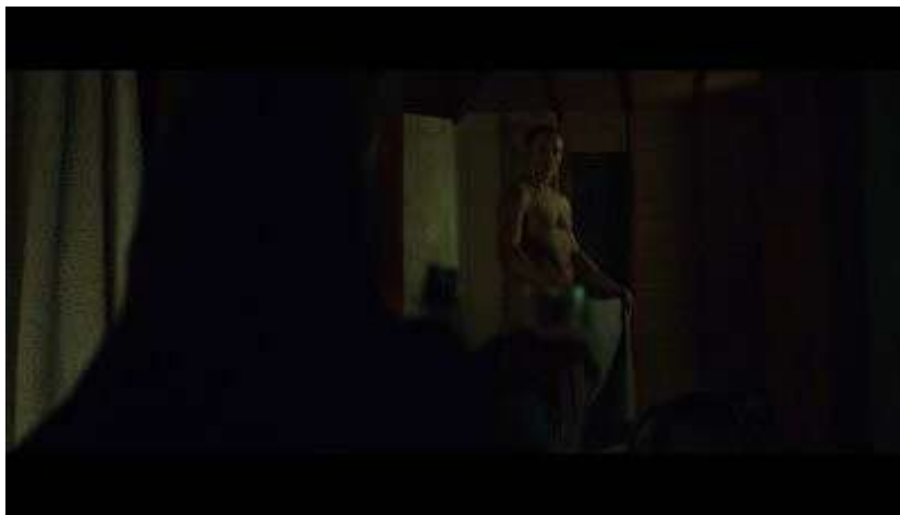
Fig. 39 Hannibal S03E01

visibles. L'un des flashbacks figure littéralement cette mise à nu. C'est une séquence qui vient combler le vide laissé entre le dernier plan de la saison 2 et la séquence post-générique où Bedelia accompagne Lecter en avion. Ce flashback met en scène le Dr Du Maurier rentrant chez elle et trouvant Hannibal sous la douche. Il sort nu et bien que le corps de l'acteur ne soit pas intégralement visible 50 , un plan derrière Bedelia insiste sur la nouvelle perception que nous aurons d'Hannibal : il a enlevé son person-suit 51 , nous plongerons avec lui dans ses atrocités (Fig. 39). Une fois que la série décide de se positionner du côté d'Hannibal (du moins en partie puisque comme dans les précédentes saisons la focalisation varie d'un personnage à l'autre), le sang ne s'arrête plus de couler.