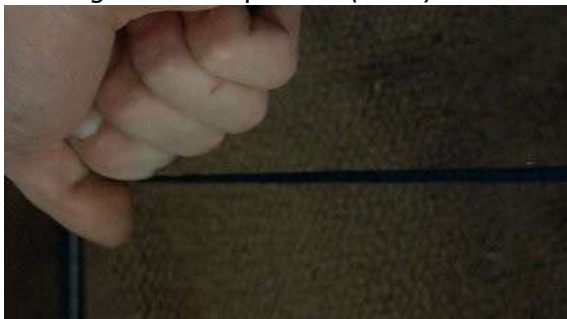
Fig. 86 Schizophrenia (1983)