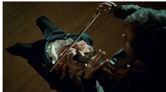
Fig. 109 Hannibal S01E08

La série de notre corpus qui ira le plus loin concernant cette idée de penser le cadavre comme une installation artistique est la sixième saison de Dexter . Il ne s'agira plus d'intervenir dans des