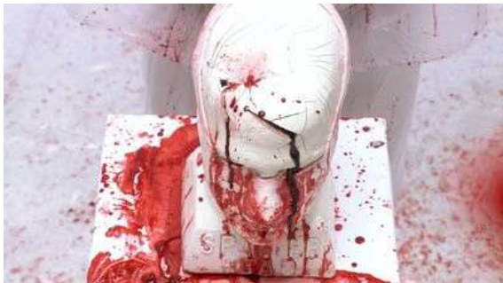
Fig. 11 Dexter S02E05

séquence de la salle de test de la quatrième saison montre les effets dramatiques d'un violent coup de marteau sur une boîte crânienne (Fig. 14/ S04E06). C'est dans l'épisode précédent que le tueur a commis son forfait avec un marteau, un acte bien entendu resté hors-champ (Fig. 13). Dans ce cadre précis, c'est presque une poétique de l'intervalle où la cause et l'effet se répondent d'un épisode à l'autre. La notion d'intervalle est généralement associée au cinéma soviétique et particulièrement à Dziga Vertov qui disait : « Les intervalles (passage d'un mouvement à un autre), et nullement les mouvements eux-mêmes, constituent le matériau (éléments dans l'art du mouvement). Ce sont eux (les intervalles) qui entraînent l'action vers le dénouement cinétique. L'organisation du mouvement, c'est l'organisation de ses éléments, c'est-à-dire la formation des intervalles dans une phrase 16 . » Les effets des actes du tueur se manifestent donc visuellement un épisode plus tard sous une forme condensée et donc déplacée.