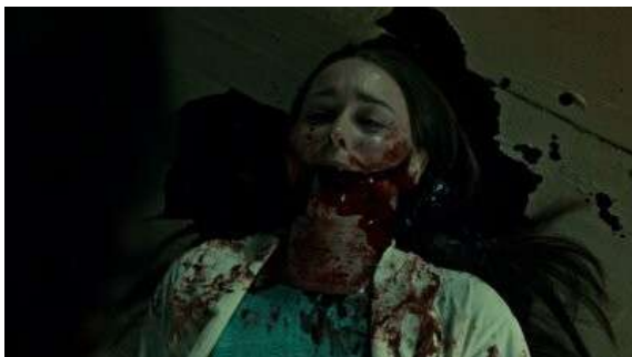
Fig. 33 Hannibal S01E10

meurtre. « En effet, pour la première fois, il agit et surtout se vit comme un assassin, ce qui a pour conséquence de rompre la frontière entre l'espace psychique du profiler et celui du criminel 41 . » Cette séquence est annonciatrice du projet d'Hannibal qui va en fin de saison faire accuser Will de tous ses crimes et le transformer aux yeux de tous les personnages en serial killer (et donc transformer progressivement la formule de la série). C'est d'ailleurs dans ce même épisode que nous pouvons voir pour la première fois, Hannibal en action. Non pas en train de commettre un meurtre, mais en train de « déguiser » son meurtre en mutilant le corps de sa victime qui est le neurologue de Will. Nous le percevons autour de deux moments clés. Le premier est le visage de la victime défigurée, mais à un niveau supérieur par rapport à la vision de Will. La mâchoire cassée et mutilée donne au visage une forme nouvelle, repoussante, que le cadrage renforce en se positionnant derrière le corps pour filmer en gros plan le visage (Fig. 34). Le second moment est la fin de l'épisode qui revient sur le cadavre en nous montrant l'acte d'Hannibal. L'effet fut visible avant la cause, même si les actes d'Hannibal restent savamment masqués par le metteur en scène de l'épisode ; nous en restons au niveau de la suggestion, mais le bruitage ainsi que la force et les outils utilisés par Hannibal suggèrent un haut degré de mutilation qui ne nous sera pas épargné.