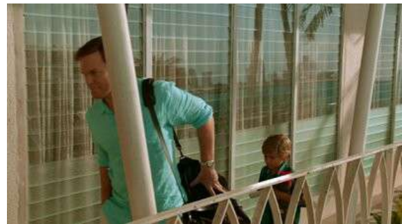
Fig. 89 Dexter S08E11

Dans Dexter , la présence du générique dans la diégèse est toujours un commentaire sur le statut du personnage. L'évolution du personnage est commentée au travers des écarts ou des ressemblances avec le générique. Dans Hannibal cependant, ce n'est pas par l'inscription d'un élément extradiégétique qu'opérera la réflexivité, mais par le personnage lui-même qui modèlera le récit à son avantage.