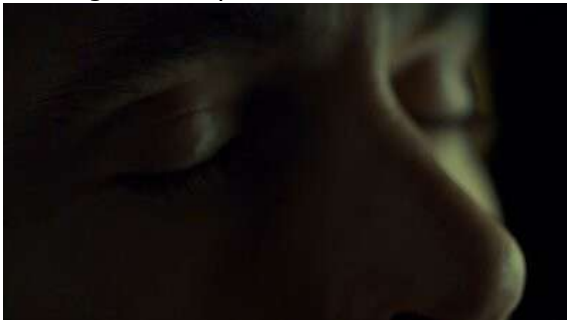
Fig. 5 Hannibal S02E11