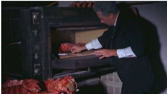
Fig. 25 Blood Feast (1963)

presque une exception puisque la série privilégie généralement les petits organes). Hannibal que l'on peut qualifier de série gore convoque, volontairement ou non, son héritage esthétique cinématographique au travers des séquences de cuisines.