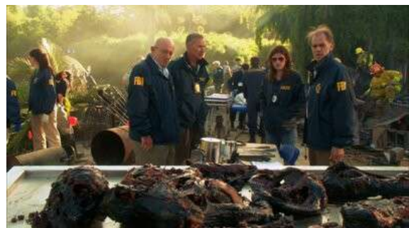
Fig. 73 Dexter S02E12