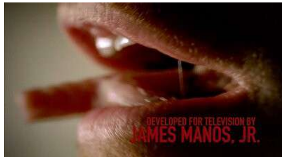
Fig. 85 Générique de Dexter