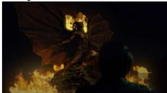
Fig. 101 Hannibal S03E10

Bien que les tueurs travaillent leurs meurtres ou leurs propres corps en fonction d'un modèle artistique, nous pouvons de plus noter une certaine tendance, concernant l'esthétique du cadavre, qui tend à prendre pour modèle des événements passés au sein même de la diégèse. La saison 6 de Dexter trouve bien sa place ici puisqu'elle propose une transition avec un modèle artistique reproduit via le meurtre, mais ce modèle est cependant directement issu de la diégèse. Le tueur de la saison 6, qui se nomme Travis, a pour habitude de créer un tableau inspiré d'un événement biblique avant de le reproduire avec le cadavre de sa victime. Travis travaille donc à partir de deux sources différentes :