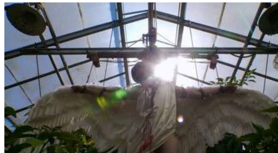
Fig. 111 Dexter S06E04

Les trois séries de notre corpus poussent jusque dans ses derniers retranchements l'assimilation entre le tueur et l'artiste qui est un lieu commun du genre, mais qui trouve des formes de condensations surprenantes au sein d'une même œuvre 50 . Le serial killer est presque par essence rapproché de l'artiste comme le rappelle Éric Dufour : « Si le meurtre, dans les films de serial killer, est élevé au rang d'œuvre d'art, c'est parce qu'il n'est pas seulement un meurtre, mais qu'il est pensé et mis en scène par son auteur, qu'il exprime un sens, certes fragmentaire, puisqu'il doit être interprété et qu'il recèle des éléments qui doivent permettre de conduire au prochain meurtre et de