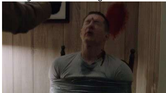
Fig. 63 The Following S03E09

Une esthétique de série n'est donc pas un ensemble de règles instaurées au cours du pilote qui seront poliment suivies par les réalisateurs successifs. Il s'agit, certes d'une forme de contrat passé avec le spectateur au cours du pilote, mais qui pourra être renégoié autant de fois que nécessaire au cours d'une série. La dimension industrielle de ce médium ne devrait pas conduire à appauvrir le regard que nous lui portons. Nous voyons donc que des séries qui à première vue sont proches (un serial killer et une structure semi-feuilletonnante qui se fonde sur sa pratique du meurtre) s'avèrent radicalement éloignées lorsque l'on commence à les envisager au travers de la théorie du cinéma en général et de l'analyse figurative en particulier. Les séries se différenciaient déjà par leurs formules narratives et leurs matrices, mais cela ne nous permettait pas de rendre totalement compte des solutions filmiques, propres à chacune, face à un même problème narratif : la