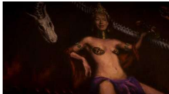
Fig. 103 Dexter S06E08

Cependant, les serial killers ne se servent pas constamment d'une inspiration artistique pour justifier leurs meurtres, mais s'inspirent parfois uniquement de l'univers diégétique de la série. C'est la proposition du tueur de glace dans l'épisode 4 de la première saison de Dexter . Le tueur s'amuse à reproduire des scènes de l'enfance de Dexter afin que ce dernier découvre où il détient sa victime tout en lui suggérant au passage qu'il vient lui aussi de son passé. La mise en scène de la scène de