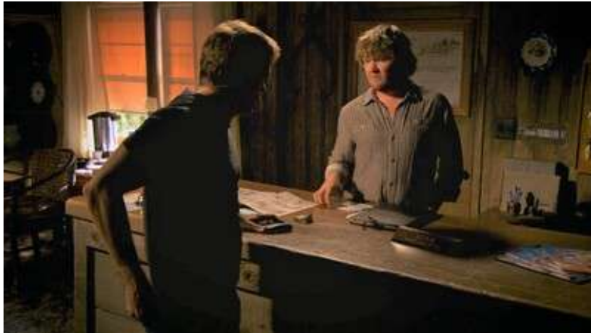
Fig. 114 « Norm » est écrit sur l'écrêteau ; Dexter S06E07