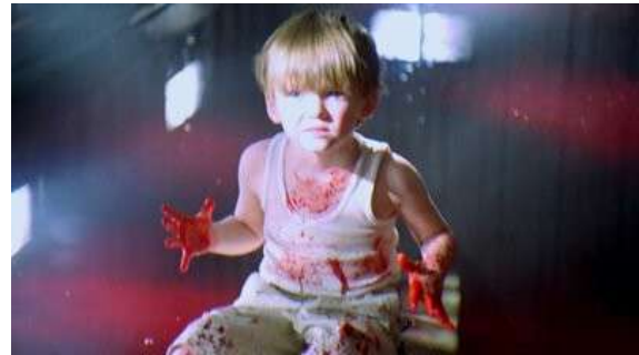
Fig. 10 Dexter S01E10