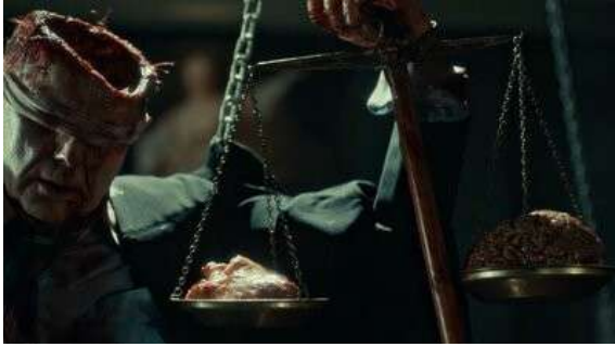
Fig. 64 Hannibal S02E03