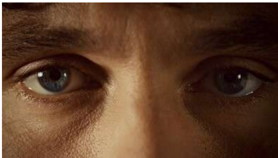
Fig. 29 Hannibal S01E04

Will entre pourtant en action dans ses visions puisqu'il en est le personnage principal, mais ces séquences ne débouchent pas sur un changement de situation. L'action de Will est coupée de son environnement immédiat puisqu'elle est mentale. L'action deleuzienne se caractérise par une situation donnée qui engage une action et qui résulte sur une situation changée 39 . L'action des visions de Will n'aboutit pas à un changement de situation puisque la situation s'évapore une fois l'exercice mental terminé. Will Graham est un personnage visionnaire, un don maudit qui est associé à la mort. Will ne fait que tuer dans ses visions ; la dimension gore ou plus précisément splatter est le plus souvent associée à ce personnage ; c'est lui qui paradoxalement tue en série.