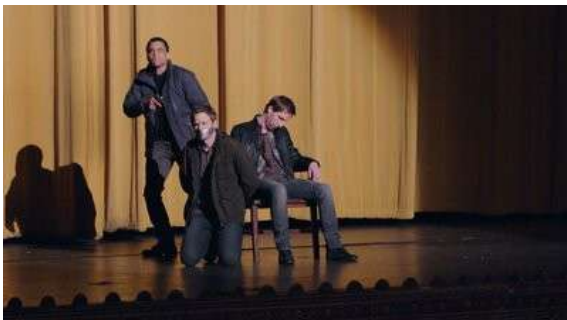
Fig. 108 The Following S03E13