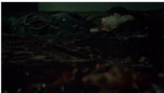
Fig. 46 Hannibal S03E02

Enfin, le retour au réel de Will où la plaie d'Abigail s'ouvre toute seule. Notons encore une fois que c'est après le basculement narratif lié au personnage d'Hannibal que la série se permet tous les excès figuratifs mentionnés. Loig Le Bihan note que dans un film de Jean Epstein, le visage ne se reflète pas sur l'eau en tant que reflet, ni en tant que transparence, mais en tant que devenir 58 . Dans Hannibal , l'écoulement du sang engage toujours un devenir des figures et des personnages. Toujours convoqué lors d'instant critiques, le sang comme matière liquide autonome menace d'envahir le champ en englobant les personnages ou bien signale une transformation : le devenir-tueur de Will qui commande le meurtre d'Hannibal (où le sang tend déjà à s'autonomiser), le changement de perception que nous aurons d'Hannibal (une scène de douche le lave de ses crimes et ouvre un nouveau moment au sein du récit et de l'économie figurative de la série ; S03E01), ainsi que le passage d'un état vivant à mort et ce indépendamment d'une logique temporelle (Hannibal qui meurt progressivement lorsque son sang vient remplir le lavabo de Will, ou bien Abigail décédée, mais qui ne cesse de venir mourir sous nos yeux)