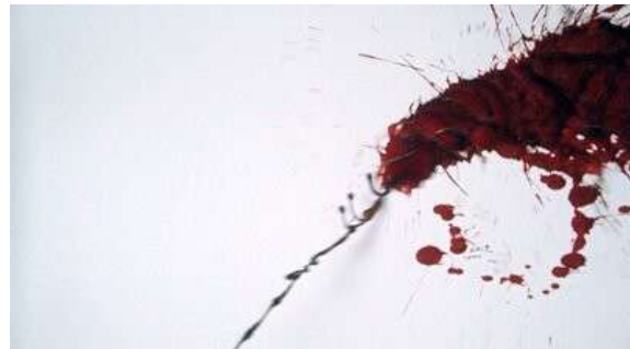
Fig. 12 Dexter S02E05