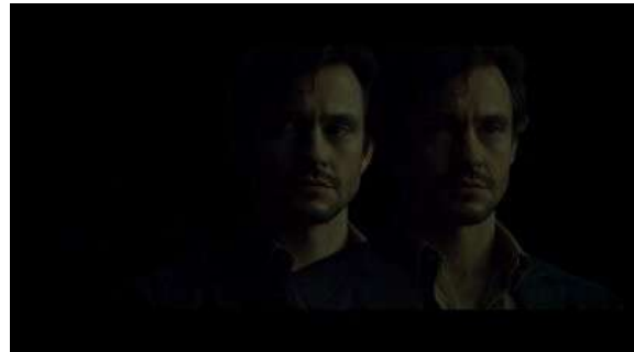
Fig. 8 Hannibal S03E04