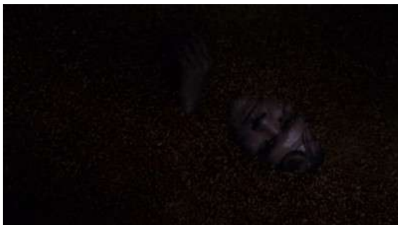
Fig. 115 Engloutissement dans le silo ; Dexter S06E07