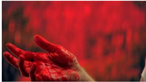
Fig. 18 Dexter S01E06