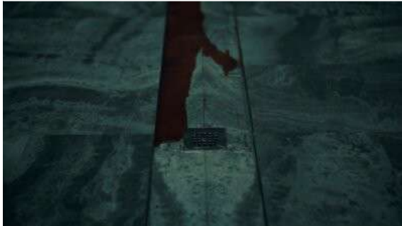
Fig. 44 Hannibal S02E05