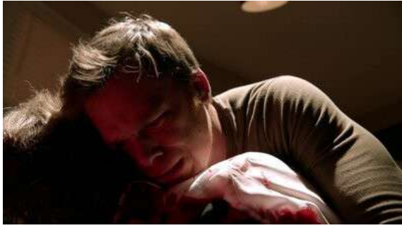
Fig. 23 Dexter S08E10