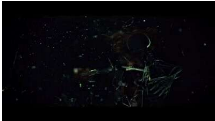
Fig. 55 Hannibal S03E04

Cette logique figurative qui consiste à retravailler une ancienne scène déborde le cadre de l'épisode puisqu'elle concerne aussi d'autres personnages : Bedelia qui tue son patient (avec un nouveau plan qui plonge dans l'œsophage ; Fig. 56-57), et les blessures de Mason Verger d'abord masquées dans l'ombre puis dévoilées à la lumière d'une opération chirurgicale (Fig. 58-59). La gravité des scènes associées aux flashbacks se prolonge tout au long de la saison avec les personnages qui portent sur leur corps les stigmates de leurs blessures. Will montrera sa cicatrice à Chiyoh, celle de Jack est à de nombreuses reprises visibles dans son cou, Alana boitera pendant plusieurs épisodes, Chilton dévoile sa prothèse dentaire et se maquille pour retrouver son visage d'antan. Chilton est le personnage le plus violenté de la série. La série ressuscite à de multiples reprises, et au-delà de toute vraisemblance, Chilton pour en faire le support de sévices de plus en plus insoutenables : d'abord éviscéré, il subit par la suite un tir dans la tête, pour finalement perdre ses lèvres avant d'être brûlé vif. Toutes les séquences mentionnées sont directement ou indirectement liées à Hannibal Lecter. La saison 3 est donc la saison, vous l'aurez compris, du basculement, d'une relation distante à Hannibal qui maîtrise son apparence (avec ses meurtres invisibilisés) à une relation plus intime (avec ses meurtres plein cadre).