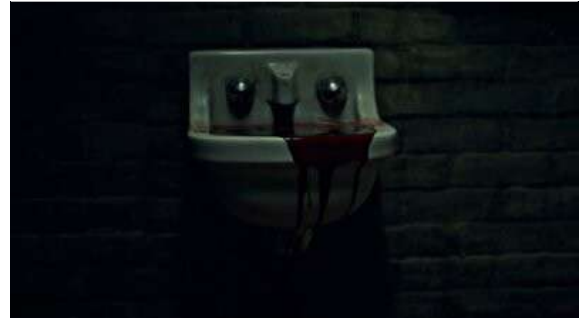
Fig. 45 Hannibal S02E05