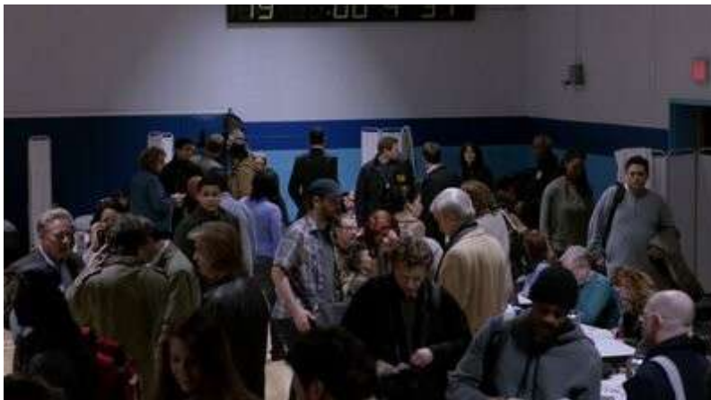
Fig. 1 The Following S01E14

Le début de la saison 2 réitère l'expérience avec la possible histoire d'amour entre Ryan et Lily, une victime de l'attaque terroriste de l'épisode 1. Mais il s'agit en réalité d'un subterfuge pour obtenir des informations de la part de Ryan, Lily se révélant être une fanatique de Joe Carroll. Ryan, comme le spectateur, n'est pas suffisamment resté sur ses gardes alors que la saison 1 nous avait pourtant habitués à voir une menace potentielle s'actualiser dans des figures parfois inoffensives. Le manoir est une autre incarnation de cette idée puisque s'y trouve une multitude de nouveaux personnages