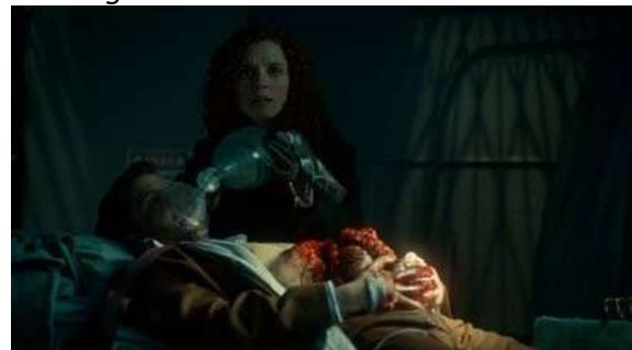
Fig. 38 Hannibal S01E11

Jusqu'à présent c'est Will Graham et Abel Gideon qui ont porté à eux seuls la dimension gore/splatter de la série. « Chaque scène gore est un précis de décomposition. Elle raconte comment un personnage (de préférence jeune et vigoureux pour accentuer le contraste) devient un cadavre 46 . » C'est en effet tout l'enjeu du travail de Will Graham, être en mesure de voir et de faire voir le passage du statut d'être vivant au statut de cadavre.