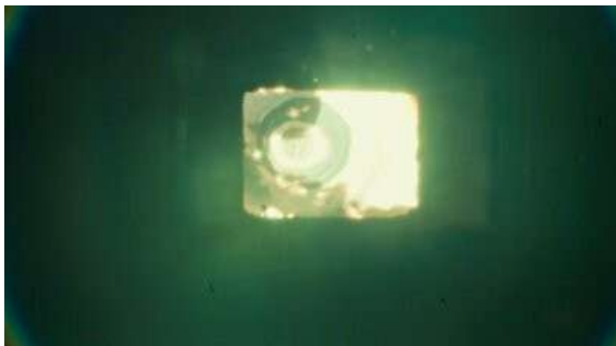
Fig. 94 Hannibal S03E08