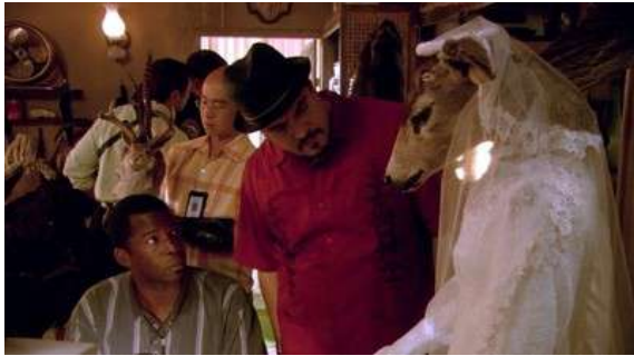
Fig. 112 Dexter S01E07