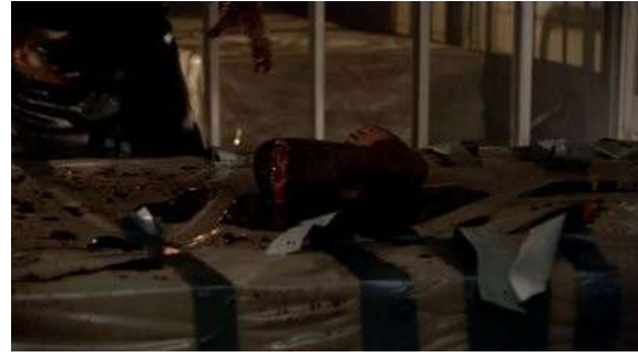
Fig. 24 Dexter S01E01

Dexter se situe alors sur deux terrains à la fois. Le terrain du cinéma américain des années 70 : ambiguïté morale des personnages d'anti-héros et justice personnelle issue des Vigilante Movie de cette période. Jean-Baptiste Thoret synthétise de plus le cinéma d'horreur classique comme la confrontation entre soi et un Autre 21 . Notre corpus ayant comme personnages principaux des tueurs en série, l'horreur ne repose donc pas sur cette confrontation, puisque ce que le cinéma classique considère comme « Autre » est ici érigé en point de focalisation. Mais son économie figurative répond pleinement à une logique du hors-champ qui la situe sur le terrain du cinéma classique concernant les actes de Dexter. « Le hors-champ n'est plus ce lieu invisible où le champ règle ses problèmes de digestion [...], mais un espace poubelle, un dépotoir saturé de déchets toxiques impossibles à contenir. Le refoulé ne se contente plus de faire un petit retour et de s'en aller [...], mais, à l'instar des zombies de Romero, s'accroche au cadre et s'exhibe 22 . » Nous voyons bien avec cette définition du hors-champ moderne que Dexter reste encore confortablement dans une logique du hors-champ classique. L'horreur est bien contenue hors-champ, elle refait ponctuellement surface avant de retourner dans son espace privilégié hors du cadre. La série correspondrait alors à une hybridation entre les thématiques du cinéma américain des années 70 et le traitement plastique du cinéma classique.