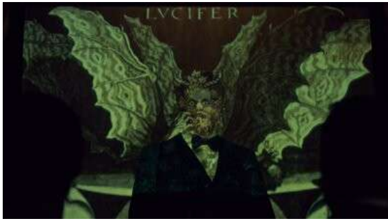
Fig. 90 Hannibal S03E01