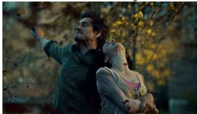
Fig. 48 Hannibal S01E03