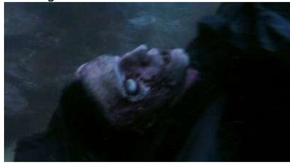
Fig. 81 Dexter S02E01