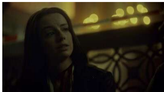
Fig. 47 Hannibal S03E02