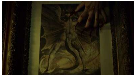
Fig. 99 Hannibal S03E12