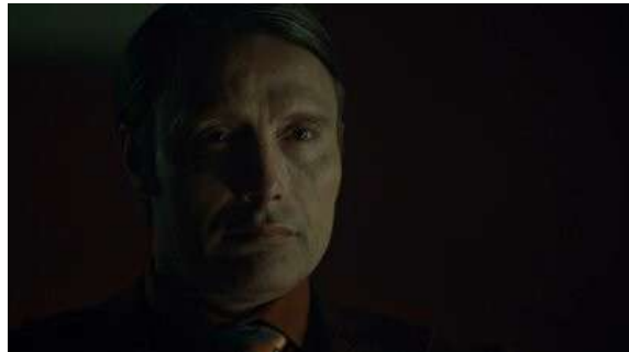
Fig. 4 ...Et contre-champ sur Hannibal