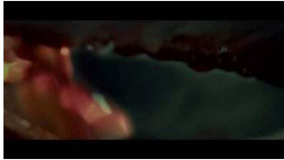
Fig. 54 Hannibal S03E04