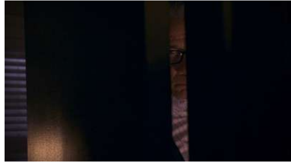
Fig. 115 Dexter S06E04

Tous ces exemples sont disséminés tout au long de la saison, mais il faut pour conclure définitivement ce travail mentionner un épisode spécifique qui fait de l'intertextualité son enjeu principal en laissant temporairement la logique des intrigues formulaires et feuilletonnantes de côté.