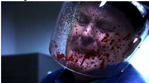
Fig. 13 Dexter S04E05