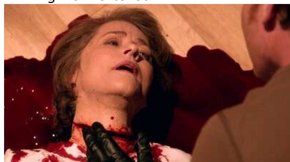
Fig. 22 Dexter S08E10