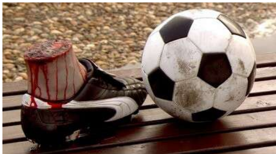
Fig. 104 Dexter S01E04