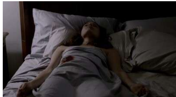
Fig. 77 The Following S02E06

Si The Following ne s'attarde pas habituellement sur les corps des personnages, force est de constater que certains personnages introduisent des exceptions. Chaque série s'accommode à sa façon de la répétition de meurtres et chacune d'entre elles trouve des solutions filmiques différentes concernant la monstration des cadavres : le refoulement hors-champ (les morts de Dexter), la subversion par la visibilité (la copie par le travail de copycat d'Hannibal), ou la feintise (traiter le cadavre comme s'il était vivant). Néanmoins, le rêve peut aussi être le lieu d'une négociation par rapport aux normes esthétiques des séries : dans Dexter c'est par le rêve qu'apparaîtront enfin les