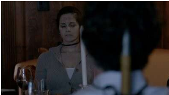
Fig. 76 The Following S02E02