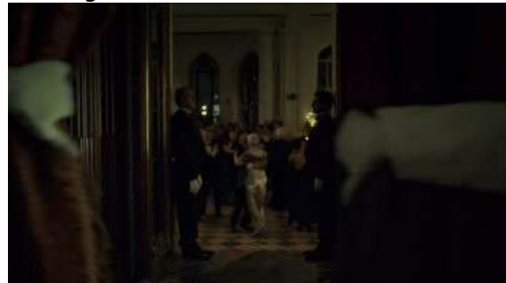
Fig. 93 Hannibal S03E01