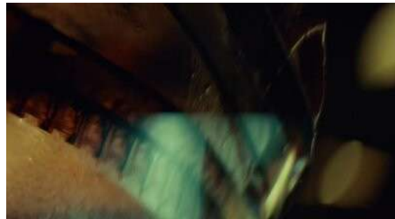
Fig. 95 Hannibal S03E08