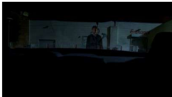
Fig. 116 Le double de Dexter qui disparaît ; Dexter S06E07