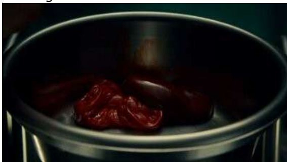
Fig. 37 Hannibal S01E11