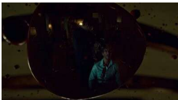
Fig. 40 Hannibal S03E06