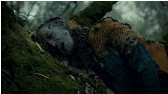
Fig. 66 Hannibal S02E04