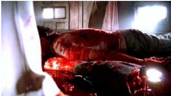
Fig. 9 Dexter S01E10

C'est d'ailleurs dans ces plans que nous verrons les images les plus gore avec un cadavre baignant dans son sang et un membre sectionné. Ce souvenir est en quelque sorte la matrice figurale des images gore de la série.