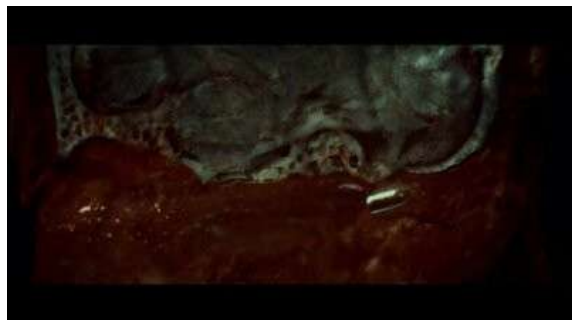
Fig. 50 Hannibal S03E04