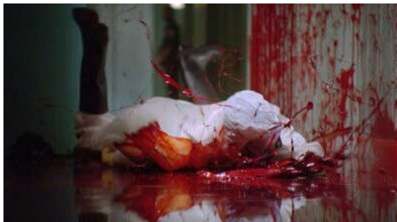
Fig. 16 Dexter S01E10

Si nous poursuivons avec le vocabulaire de la psychanalyse freudienne nous pourrions dire qu'une autre façon de contourner la censure de la série est d'en passer par les images mentales. Sous couvert du statut du rêve, de la rêverie et donc du faux, de l'irréel, la série se permet une esthétique plus outrancière. Dexter exécute Vince Masuka de sang-froid dans une très courte séquence où il plante son stylo dans le cou de son collègue et s'ensuit une giclée de sang (S07E03). L'une des rares mises à mort montrées dans son intégralité. Il s'agissait bien sûr d'une rêverie de Dexter. Un autre déplacement du flux sanguin se situe aussi dans un rêve (S01E06). Dexter sort de chez lui et il se met à pleuvoir des torrents de sang. Comme précédemment nous pouvons lire cette séquence comme un