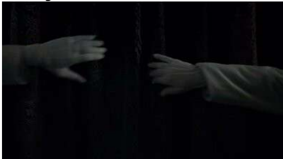
Fig. 92 Hannibal S03E01