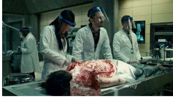
Fig. 65 Hannibal S01E05