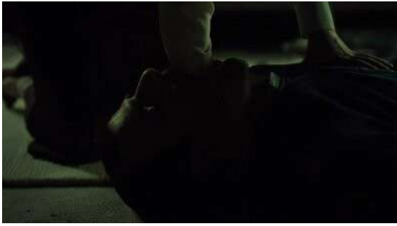
Fig. 56 Hannibal S03E10