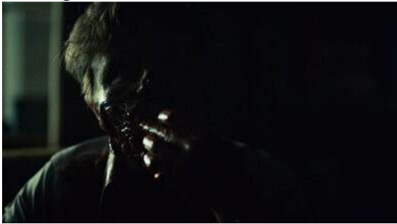
Fig. 58 Hannibal S02E12