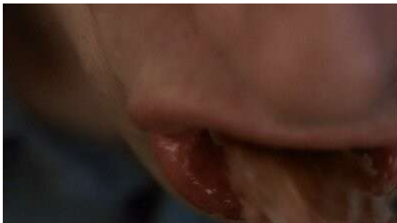
Fig. 84 Schizophrenia (1983)

venaient soutenir la thèse. La scène de rasage est reprise dans le générique de Dexter mais en plan plus rapproché, plus proche de la chair, avec une même insistance sur le son. Les deux autres motifs sont un très gros plan de bouche en train de mastiquer et la présence de lacets utilisés en vue d'une strangulation. Au début du film, le tueur de Schizophrenia fait un arrêt dans un restaurant. Cette scène est construite par tout un ensemble de faux raccords où se télescopent des plans de face et notamment de bouche en train de mastiquer grossièrement. La même impression se dégage du générique de Dexter lorsqu'apparaissent les plans de mastications accompagnés de leurs sons caractéristiques. Pour finir, dans Schizophrenia , le tueur se retrouve dans un taxi et tente d'utiliser ses lacets pour étrangler son chauffeur tandis que dans Dexter , le générique nous montre Dexter serrer très fort ses lacets au-delà de toute justification pour suggérer insidieusement qu'il pourrait tout aussi bien être en train d'étrangler quelqu'un.