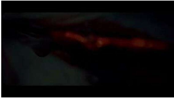
Fig. 53 Hannibal S03E04