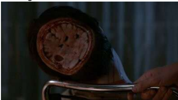
Fig. 70 Dexter S08E08