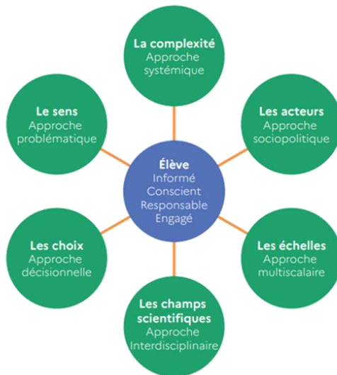
Illustration Vademecum de l'EDD

Cependant, ces recommandations ne proposent pas de réelles stratégies pour les enseignants, on fait donc appel à des chercheurs académiques pour établir un plan d'action 9 .