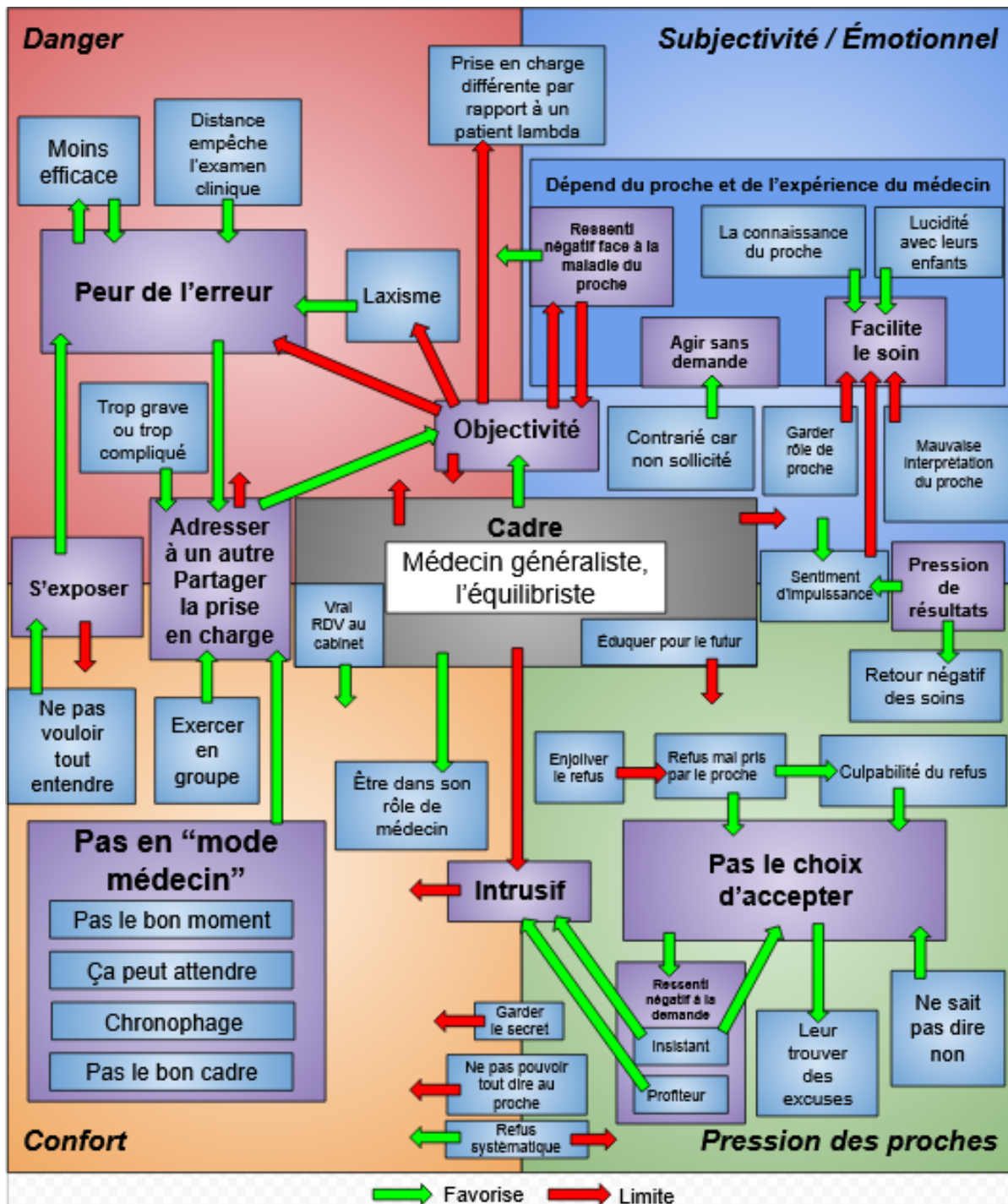
Schéma 1 : Modèle explicatif