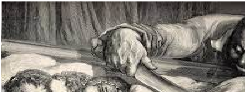
Illustration 8: Arrière-plan ambigu

L'arrière-plan prête effectivement à confusion. D'une part, ce décor semble représenter des rideaux. Ces rideaux accentuent le côté intime de la chambre. Selon Banu 351 , le rideau symbolise l'attente, le secret. Il sépare et unit, divise et expose. Le rideau souligne également la passion dans les scènes de meurtres. Mais nous remarquons que ces « rideaux » dévoilent et représentent autre chose. En effet, le noir et blanc insiste sur l'obscurité de la scène. En tant que couleurs symboliques, ils témoignent à la fois de la mort et de l'innocence – soit de la mort de l'innocence des petites filles de l'ogre. Ce noir et blanc en l'arrière-plan, évoque également des racines d'arbres, une forêt. L'ogre appartiendrait donc physiquement à cette forêt. Celle-ci accentue la dimension sauvage et bestiale de l'ogre. Gustave Doré représenterait donc un ogre à l'affût de chair fraîche. Nous remarquons que cette gravure se divise en deux parties, d'un côté nous avons les enfants qui dorment et de l'autre un ogre surgissant d'une forêt sombre.