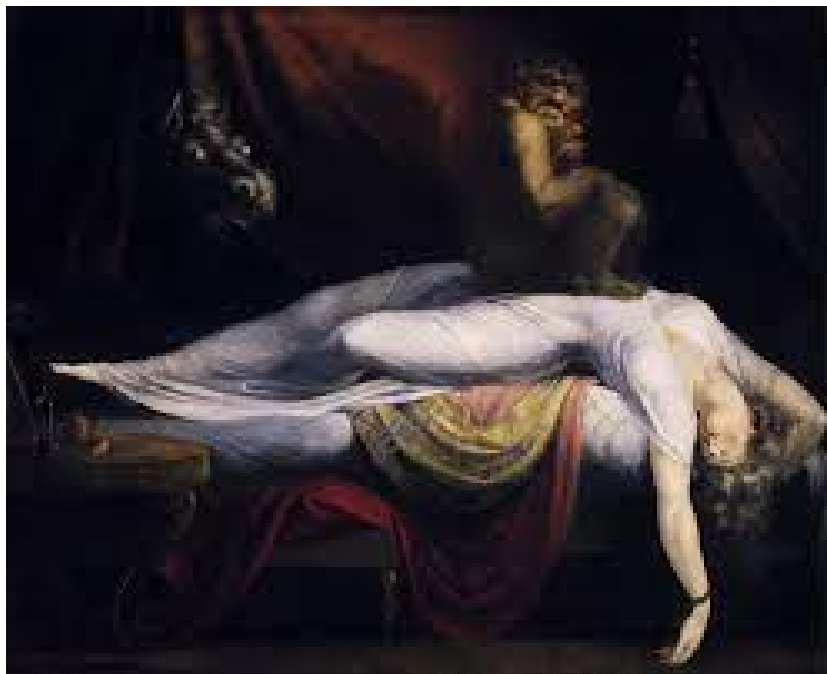
Illustration 16: The Nightmare , Heinrich Füssli, 1781, huile sur toile, (h. 101, l. 127), Détroit, The Detroit Institute of Art.