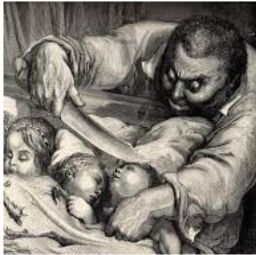
Illustration 5: Posture de l'ogre :

Goya et de Pierre Paul Rubens où Saturne est représenté accroupi. Il est contorsionné, voire désarticulé afin de pouvoir entrer intégralement dans le cadre.