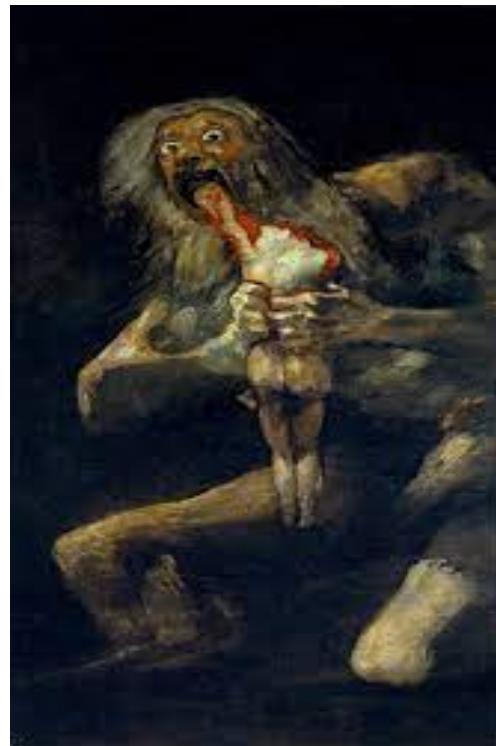
Illustration 6: Francisco de Goya, Saturne dévorant un de ses enfants , Peinture murale 146x83 cm, Musée du Prado, 1819-1823