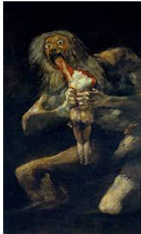
Illustration 14: Francisco de Goya, Saturne dévorant un de ses enfants , Peinture murale, 146 x 83 cm, Musée du Prado, 1819-1823.