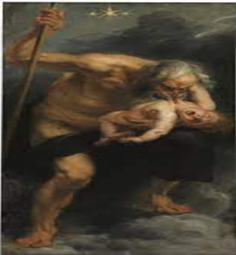
Illustration 7: Pierre Paul Rubens, Saturne, père de Jupiter; dévore un de ses fils , Huile sur toile, 180cm x 87cm, Musée du Prado à Madrid, 1636-1638.

Charles Perrault, Contes , Le petit Poucet , L'ogre égorgeant ses enfants , Gravure sur bois de fil, Hetzel, Paris, 13,5x24,5 cm