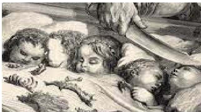
Illustration 4: Le visage crispé des filles :

L'onirisme se présente chez Doré par le lit situé au centre du tableau et les yeux clos des filles. Nous remarquons néanmoins que ces dernières ont le visage crispé et les sourcils froncés. Certaines d'entre elles détournent le regard et tentent de se cacher. Elles sont donc plongées dans un sommeil agité, dans un véritable cauchemar.