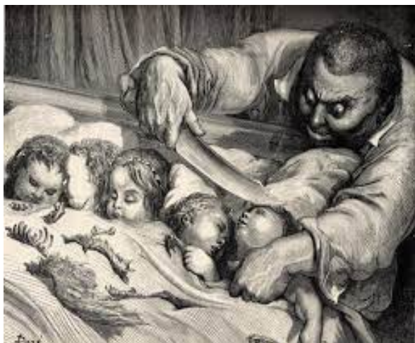
Illustration 11: Charles Perrault, Contes , Le petit Poucet , L'ogre égorgeant ses enfants , Gravure sur bois de fil, Hetzel, Paris, 13,5x24,5 cm