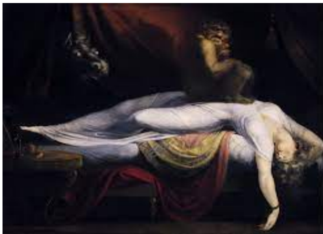
Illustration 10: Johann Heinrich Füssli, The Nightmare , Huile sur toile, 101,6 x 127, 7 x 2, 1 cm, Detroit Institute of Arts, 1781