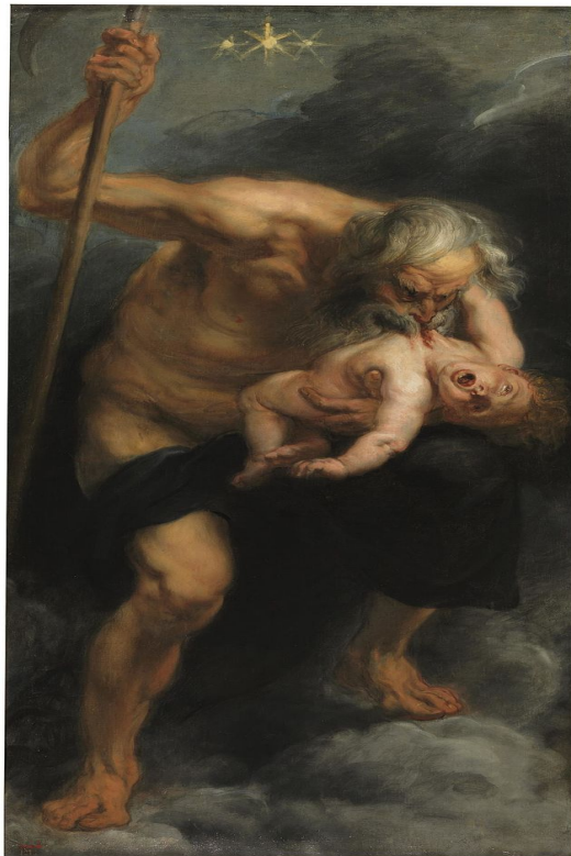
Illustration 13: Pierre Paul Rubens, Saturne, père de Jupiter, dévore un de ses fils , Huile sur toile, 180 cm x 87 cm, Musée du Prado à Madrid, 1636-1638