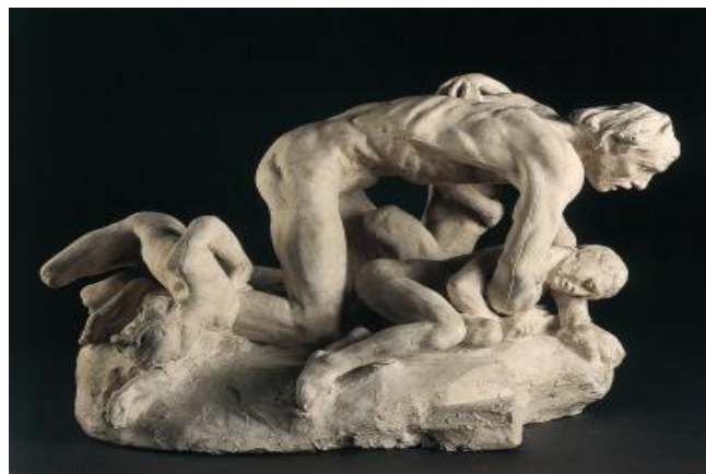
Illustration 1: Rodin Auguste, Ugolin et ses enfants , vers 1881, Plâtre, H. 41,5 cm ; L40,3 cm ; P. 58, 7 cm, Musée Rodin.