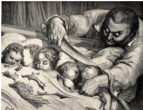
Illustration 2: Charles Perrault, Contes, Le petit Poucet , L'ogre égorgeant ses enfants, Gravure sur bois de fil, Hetzel, Paris, 13,5x24,5 cm

Au premier plan, sur cette gravure, nous avons cinq petites filles étendues sur leur lit, les unes à côté des autres, les yeux fermés. Sur elle, se trouvent des carcasses d'os. Au second plan se trouve l'ogre armé d'un couteau, penché au-dessus de ses filles. Sa main gauche est posée sur la poitrine de l'une de ses filles, et sa main droite empoigne un couteau. Nous notons que les garçons sont absents de la gravure. Doré accorde de l'importance uniquement au père et au lien l'unissant à ses filles. Il s'agit du moment où l'ogre s'apprête à tuer ses filles.