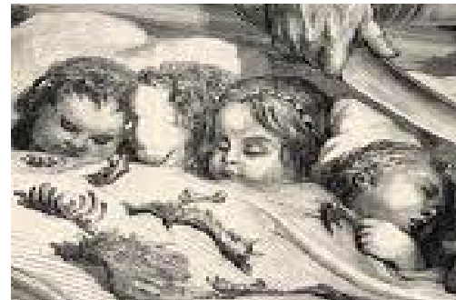
Illustration 3: Les couronnes des filles :

Charles Perrault, Contes, Le petit Poucet , L'ogre égorgeant ses enfants, Gravure sur bois de fil, Hetzel, Paris, 13,5x24,5 cm