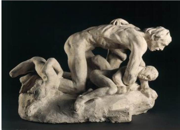
Illustration 15: Rodin Auguste, Ugolin et ses enfants , vers 1881, Plâtre, H. 41,5 cm; L 40, 3 cm; P. 58, 7 cm, Musée Rodin