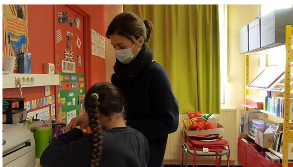
Captures d'écran des trois cadrages utilisés pour filmer l'activité réelle de la classe

Quelques semaines après la réalisation de ces courts films, j'ai visionné les trois extraits vidéographiques avec Sarah dans sa salle de classe pour réaliser des entretiens d'autoconfrontation. Ces entretiens avaient pour objectif de « faire revivre la situation passée pour appréhender l'expérience vécue qui est en partie inconsciente mais conscientisable sous certaines conditions » (Leblanc, s.d., p.1). C'est pour mener au mieux ces entretiens que j'ai pris du temps pour les préparer en amont. En effet, Leblanc détermine trois grands principes à respecter dans ce type d'entretien :