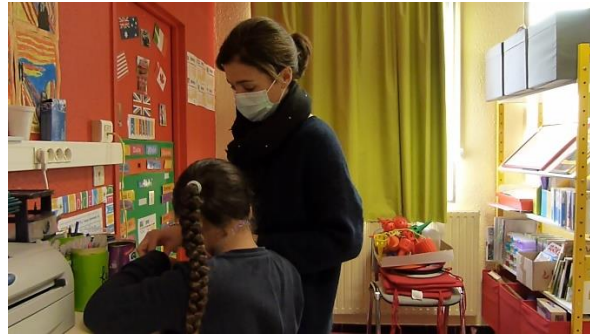
Captures d'écran des trois cadrages utilisés pour filmer l'activité réelle de la classe

Quelques semaines après la réalisation de ces courts films, j'ai visionné les trois extraits vidéographiques avec Sarah dans sa salle de classe pour réaliser des entretiens d'autoconfrontation. Ces entretiens avaient pour objectif de « faire revivre la situation passée pour appréhender l'expérience vécue qui est en partie inconsciente mais conscientisable sous certaines conditions » (Leblanc, s.d., p.1). C'est pour mener au mieux ces entretiens que j'ai pris du temps pour les préparer en amont. En effet, Leblanc détermine trois grands principes à respecter dans ce type d'entretien :