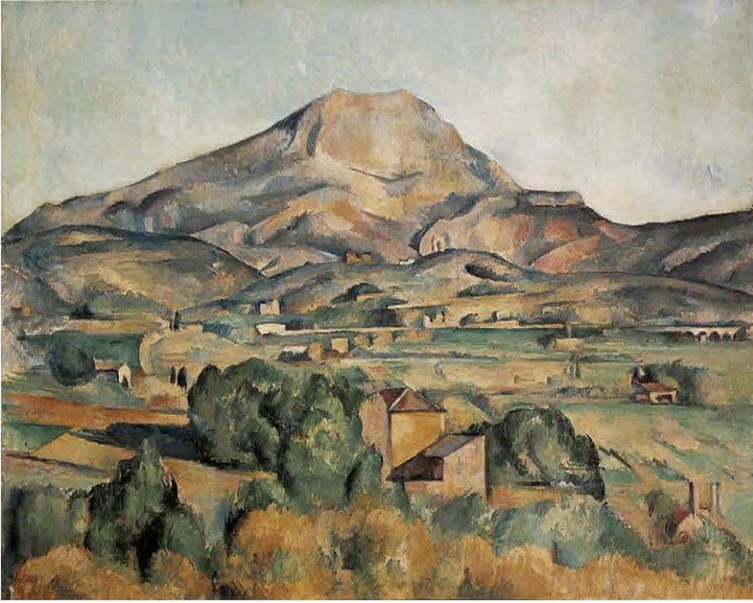
Montagne de la Sainte Victoire vue de Bellevue, (1885), Paul Cézanne, Huile sur toile, (73 × 92)