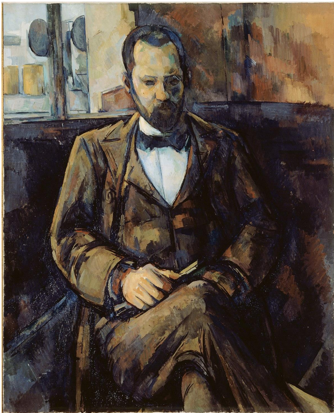
Portrait d'Ambroise Vollard , 1999, Paul Cézanne, Huile sur toile (100,3 x 80,3)