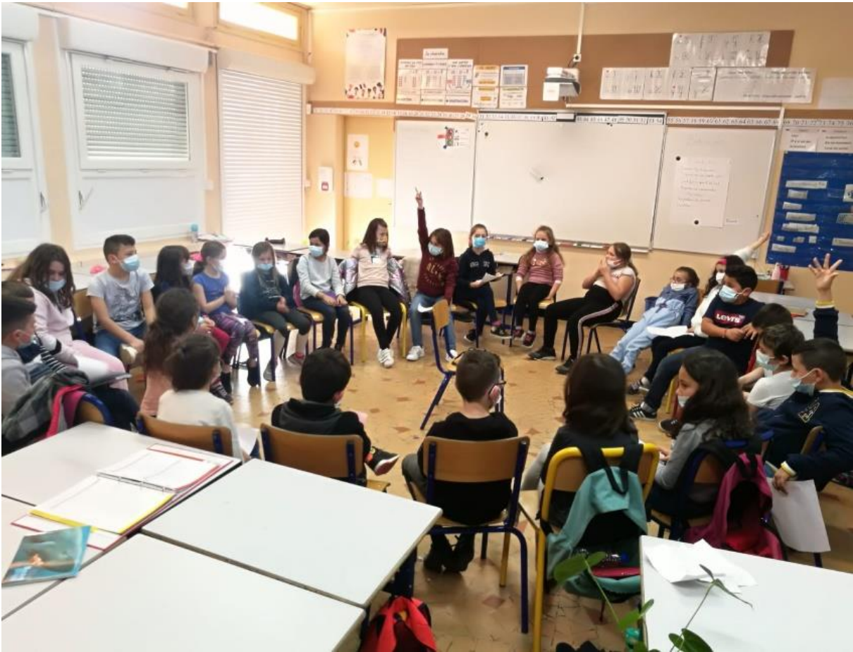
Annexe 5 : disposition de la classe durant les débats philosophique