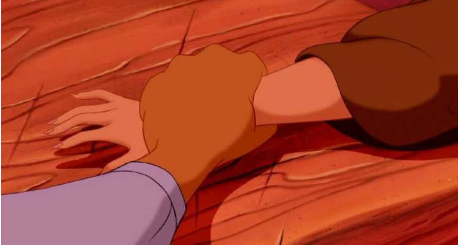
Illustration 13 : La main de Jasmine sur le comptoir où d'autres mains semblent avoir été coupées, 00:18:43

Jasmine permet d'entrevoir la violence intrinsèque d'Agrabah à travers ces deux exemples de lois qui retirent à l'individu son libre-arbitre et qui vont jusqu'aux châtiments corporels sévères. Ainsi, la ville qui est supposée concentrer tous les aspects du Moyen-Orient démontre l'hostilité qui fait partie intégrante des décors aux couleurs chaudes. Cette séquence dénote qu'implicitement, le Moyen-Orient a un système de justice arriéré qui témoigne de sa cruauté intrinsèque. Le simple don d'une pomme à un enfant affamé équivaut sans débat à un vol, qui résulte en la perte de sa main, autant pour les femmes que les hommes. Cela fait aussi écho au chant du départ qui ouvre le film et qualifie Agrabah de lieu barbare mais qui reste son chez lui.