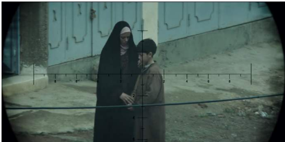
Illustration 19 : Mère irakienne et son enfant dans le viseur du sniper américain, 03:12

La figure de la femme arabe en tant que terroriste au grand écran semble être tout de même moins commune que celle de la danseuse de harem dans le passé ou celui de la femme voilée en arrière-plan, mais Shaheen note qu'il apparaît pour la première fois en 1948 194 dans le film Federal Agents vs the Underworld, Inc. où Nila est la première femme arabe terroriste. Ce cliché se perpétue par la suite dans plusieurs films, notamment dans Nighthawks 195 , où Shakka, une dangereuse terroriste marocaine, sévit en compagnie de Wulfgar qui est un terroriste international. Plus récemment, le film American Sniper 196 de 2014, vivement critiqué par certains médias comme le Huffington Post 197 , dépeint aussi ce genre de représentation dès le début du film. En effet, après une scène d'ouverture sombre avec en fond sonore la prière musulmane pour mettre en place le décor qui se trouve en Irak, le personnage principal Chris Kyle, tireur d'élite américain est témoin de l'avancée entre les ruines d'une femme complètement voilée et de son enfant.