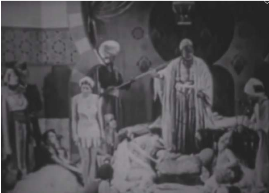
Illustration 4 : A Harem Knight , le harem, 11:46