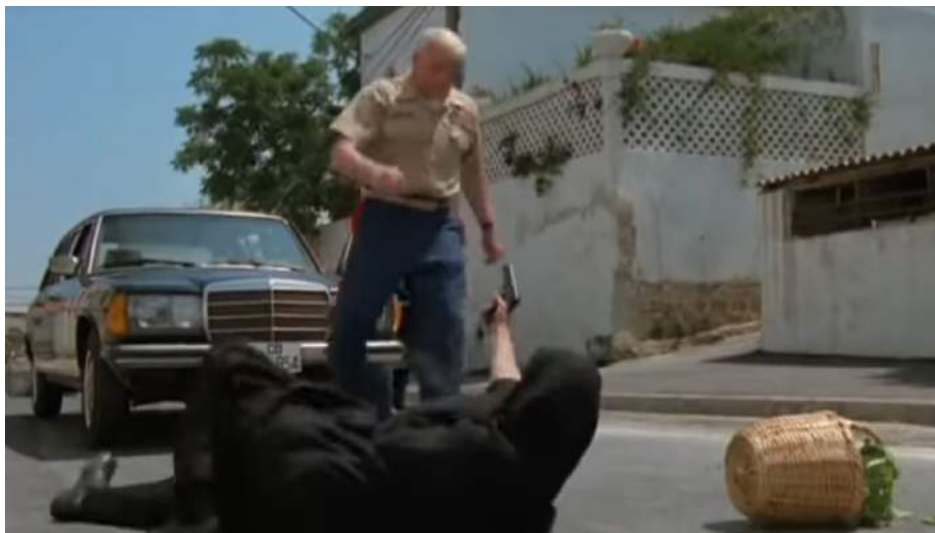
Illustration 18 : La femme voilée cache en réalité un terroriste, 35:47

Quant à Death Before Dishonor , il n'existe pas de scène comme dans Protocol qui laisserait voir plus longtemps dans le champ de la caméra les femmes arabes. Elles n'ont jamais de temps, d'interactions avec les personnages ni d'importance claire tout au long du film. Néanmoins, lors du film, la scène où le supérieur du sergent Burnns se fait kidnapper est plutôt intéressante à aborder. C'est à 34:45 que commence l'action. Accompagné de son chauffeur, le supérieur discute avec celui-ci jusqu'à ce qu'ils renversent par inadvertance ce qui apparaît être une femme voilée sortant du marché, portant sur sa tête un panier en osier plein de verdure. A la suite de ce malencontreux accident, le supérieur militaire descend de sa voiture par honnêteté et inquiétude envers ce qu'on suppose être une femme. Il se révèle que sa bonté lui coûte très cher puisque sous le voile se cache en réalité un homme armé, et tout était en réalité un guet-apens organisé par les terroristes qui, en nombre, kidnappent les deux hommes et les emmènent à bord d'une camionnette verte.