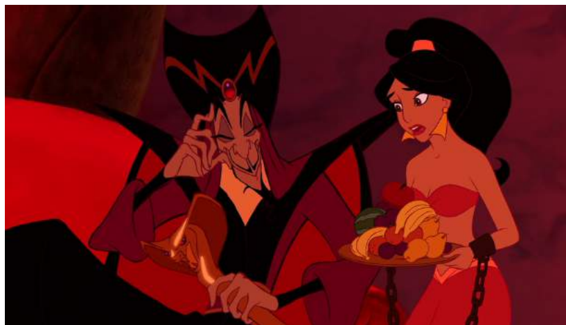
Illustration 12 : Jasmine sert la corbeille de fruit à Jafar, menottée et dans une tenue rouge légère, 1:15:42

Lors du climax du film, celle-ci se fait capturer par Jafar. Menottée, esclave du vizir, elle lui sert une corbeille de fruits (1:15:42).