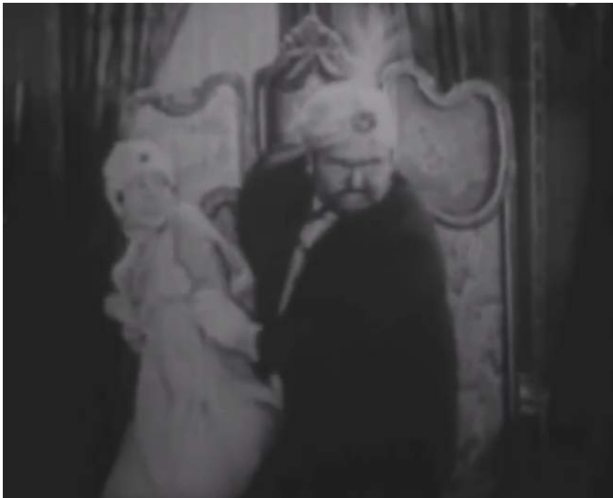
Illustration 5 : A Harem Knight , le cheikh forçant la jeune fille du harem à le suivre, 18:08.