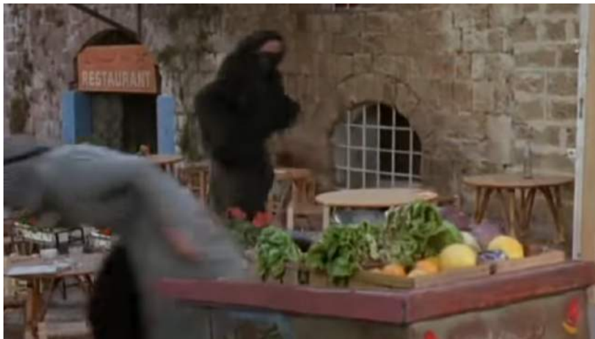
Illustration 15 : Femme voilée intégralement fuyant la fusillade du marché dans Death Before Dishonor , 25:12

Les deux films comportent la présence de ces femmes en arrière-plan qui sont presque toujours inactives et ne font que marcher pour signaler leur présence qui est pourtant invisible voir inconsciente pour le spectateur du fait de leur manque d’importance scénaristique. Aussi, les deux films présentent ces femmes lors de scènes d’action comme des hystériques qui fuient dans tous les sens et hurlent à outrance quand les coups de feu commencent. Dans Protocol , c’est lorsque Sunny parvient à s’enfuir lors d’une révolte; dans Death Before Dishonor , c’est dès le départ notamment avec la scène de la fusillade sur le marché que l’on voit des femmes voilées fuir la scène : l’une d’elles, dans sa course, tombe contre une table (25:11).