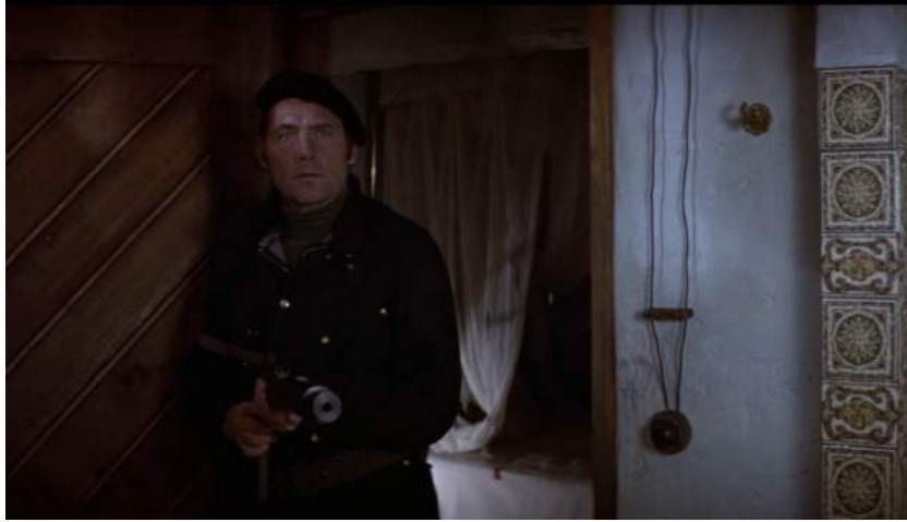
Illustration 20 : Kabakov face à Dahlia dans la salle de bain, 14:23