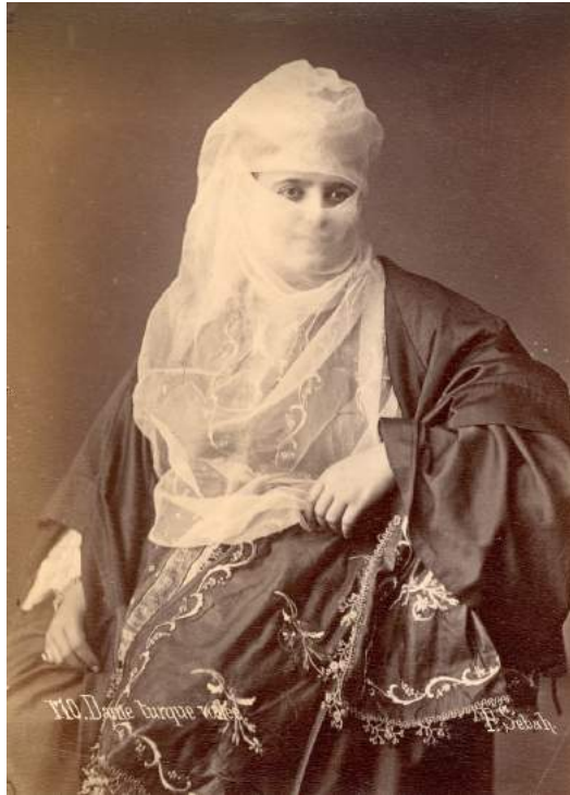
Illustration 7 : Pascal Sébah. Dames Turques , 1870s, Los Angeles, Getty Research Institute.

Ces représentations existaient déjà notamment dans la peinture orientaliste, mais la photographie, surtout, lorsqu'elle a commencé à être achetable, accessible aux personnes de classe moyenne pour un bas prix dans la forme dite de "carte de visite", a donné la possibilité de posséder cette femme mise en scène, érotisée, transformant l'image de la femme orientale un cliché culturel. Ces images se sont multipliées et ont démocratisé la mythologie de la femme arabe érotique 110 .