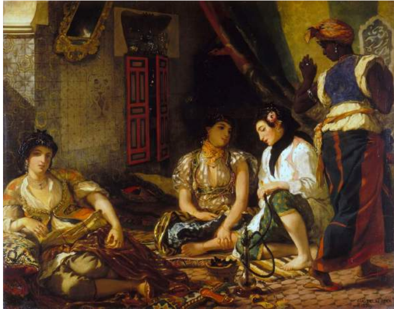
Illustration 11 : Femmes d'Alger dans leur appartement , Eugène Delacroix, 1834, Musée national Eugène-Delacroix

Jasmine incarne cette dimension orientaliste qui érotise et imagine comme sensuelle la femme arabe. Contrairement à toutes les autres protagonistes de la société Disney, Jasmine est bien plus entreprenante sur le plan amoureux. Elle n'hésite jamais à embrasser Aladdin et n'a pas la timidité d'Ariel ou Cendrillon (56:44 ou 1:01:56). Même si l'on pourrait croire en une sorte de libération sexuelle qui pourrait être positive, le fait que Jasmine ressemble tant à l'imaginaire du cliché orientaliste de la femme arabe pose question.