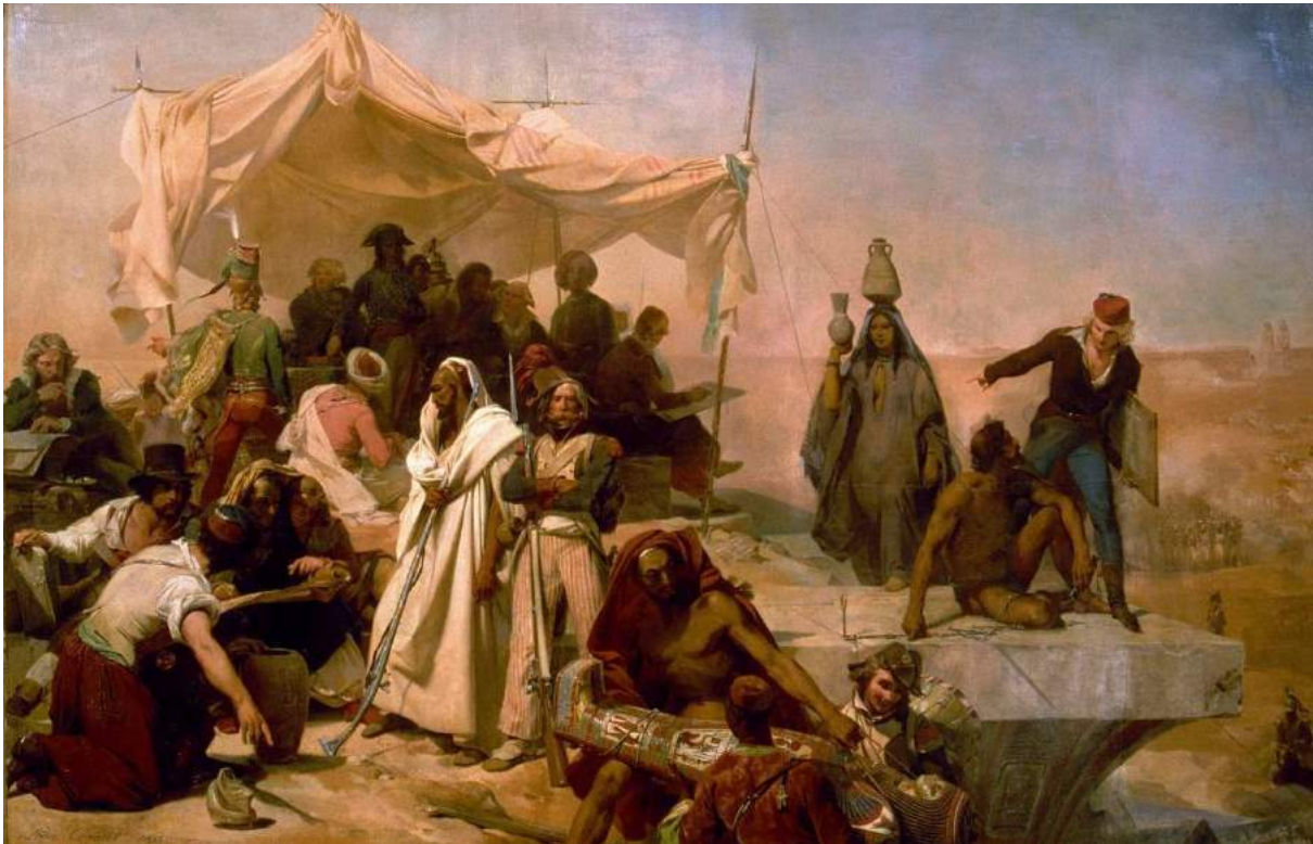
Illustration 1 : Expédition d'Égypte sous les ordres de Bonaparte , Léon Cogniet, huile sur toile, musée du Louvres, 1835 18 .

Cette peinture est très intéressante et complexe et résume à elle seule une bonne part de l'orientalisme, qui se trouvera retravaillé dans l'imagerie hollywoodienne.