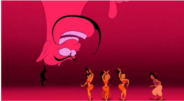
Illustration 10 : Second exemple du stéréotype des danseuses, femmes de harem que l'on retrouve dans le film, 00:38:51

Les autres femmes visibles dans le film sont toujours au second plan, ne bénéficient pas de dialogues conséquents et n'interagissent jamais réellement avec les personnages principaux. Le célèbre test de Bechdel 166 , qui établit trois critères pour mettre en évidence la sous-représentation de personnages féminins dans une œuvre de fiction, consiste à observer si deux femmes nommées par un nom et un prénom dans l'œuvre parlent ensemble, et parlent de quelque chose qui est sans rapport avec un homme. Le film Aladdin ne remplit pas ces critères et échoue au test de Bechdel. Jasmine n'a jamais une seule interaction avec une autre femme; d'ailleurs, aucune autre femme n'est nommée et il n'y a qu'une seule référence à sa mère absente dans le film, qui est jugée par son père comme "moins difficile" qu'elle (00:14:28).