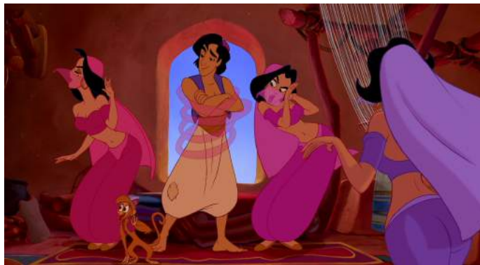
Illustration 8 : Aladdin a une courte apparition dans un harem, 00:08:15

Au-delà même de la princesse, les personnages féminins arabes du film sont aussi enfermés dans une dichotomie au niveau de leur physique qui les montre comme passives et statiques. Soit elles sont de vieilles femmes hideuses aux poitrines, nez et maquillage exagérés (0:08:47 et 00:38:51) ou des jeunes filles sexualisées, portant de petits hauts montrant leur décolleté, comme lorsque Aladdin tombe dans une pièce pleine de femmes qui semblent être des danseuses du ventre (0:08:15).