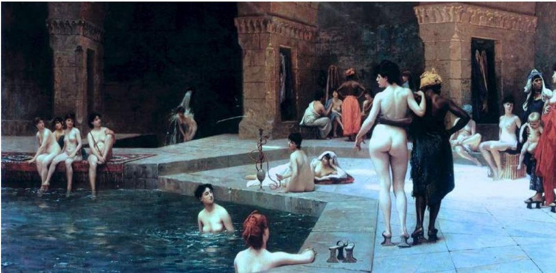
Illustration 2 : Grande piscine de Brousse , Jean Léon Gérôme, 1885, huile sur toile, collection particulière, Londres.

Nues sur cette toile, les baigneuses sont érotisées et le spectateur transgresse leur intimité rien que par le regard. Gérôme recrée ici, mais aussi sur nombreuses autres peintures l'Orient attendu par ses contemporains, renforçant le mythe sur la région 22 . L'Orient est synonyme de tentation : tentation de l'Ailleurs géographique, du fait de sa différence de peuples et de paysages mais aussi de la tentation féminine également 23 car souvent, on retrouve des représentations comme celles de Gérôme dans des bains ou des harems 24 . On retrouve dans la sphère culturelle américaine les tableaux de Frank Holman comme Fleur d'Orient ou les odalisques de Frederick Arthur Bridgman, comme Reclining Beauty .