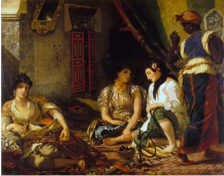
Illustration 11 : Femmes d'Alger dans leur appartement , Eugène Delacroix, 1834, Musée national Eugène-Delacroix

Jasmine incarne cette dimension orientaliste qui érotise et imagine comme sensuelle la femme arabe. Contrairement à toutes les autres protagonistes de la société Disney, Jasmine est bien plus entreprenante sur le plan amoureux. Elle n'hésite jamais à embrasser Aladdin et n'a pas la timidité d'Ariel ou Cendrillon (56:44 ou 1:01:56). Même si l'on pourrait croire en une sorte de libération sexuelle qui pourrait être positive, le fait que Jasmine ressemble tant à l'imaginaire du cliché orientaliste de la femme arabe pose question.