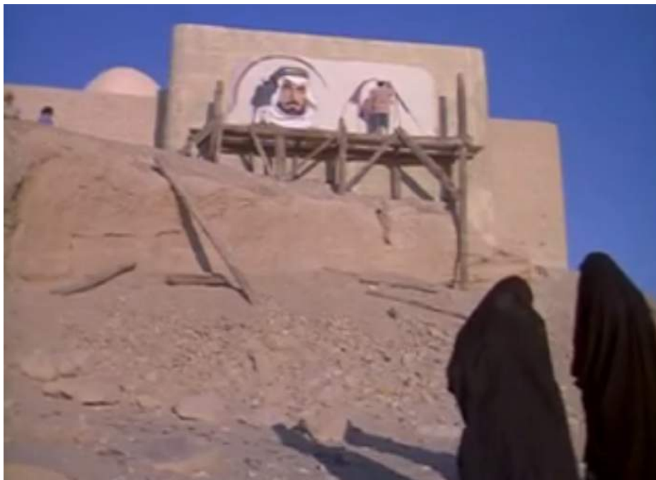
Illustration 14 : Deux femmes voilées observant la fresque, Protocol , 00:46:52

Dans Protocol , à 46:52, lorsqu'une fresque mystérieuse est montrée comme en cours de création par un peintre arabe dépeignant l'émir Khala'ad et la protagoniste américaine, on aperçoit de dos et au premier plan deux femmes voilées intégralement qui observent le travail être réalisé de manière passive.