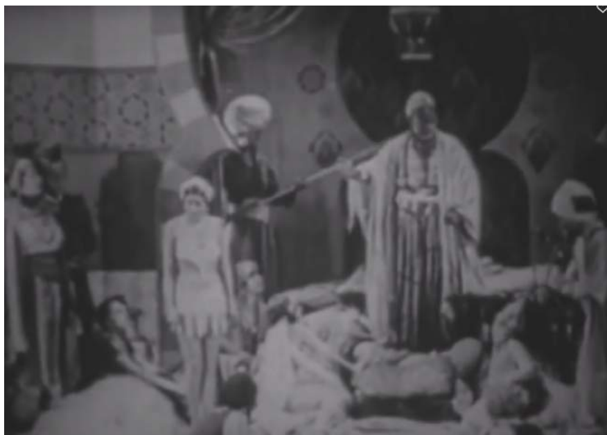
Illustration 4 : A Harem Knight , le harem, 11:46