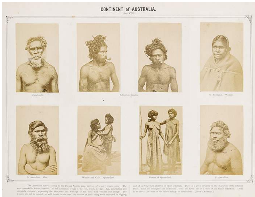
Illustration 3 : Ethnological Photographic Gallery of the Various Races of Man , Carl & F. W. Dammann , Londres, 1875.

Ce processus de composition au double sens du terme, arrangement et réagencement, se remarque tôt dans l'histoire par des photographies ethnographiques réalisées autrefois pour saisir la différence avec l'autre comme le font Carl & F.W. Dammann dans Ethnological Photographic Gallery of the Various Races of Man en 1875 avec les aborigènes d'Australie.