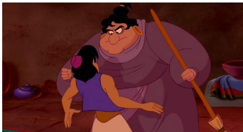
Illustration 9 : Dans ce même harem il se retrouve face à une autre femme, apparemment une femme de ménage, cette fois-ci “hideuse”, 00:08:47