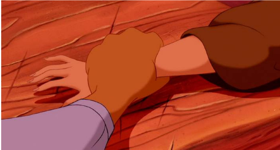
Illustration 13 : La main de Jasmine sur le comptoir où d'autres mains semblent avoir été coupées, 00:18:43

Jasmine permet d'entrevoir la violence intrinsèque d'Agrabah à travers ces deux exemples de lois qui retirent à l'individu son libre-arbitre et qui vont jusqu'aux châtiments corporels sévères. Ainsi, la ville qui est supposée concentrer tous les aspects du Moyen-Orient démontre l'hostilité qui fait partie intégrante des décors aux couleurs chaudes. Cette séquence dénote qu'implicitement, le Moyen-Orient a un système de justice arriéré qui témoigne de sa cruauté intrinsèque. Le simple don d'une pomme à un enfant affamé équivaut sans débat à un vol, qui résulte en la perte de sa main, autant pour les femmes que les hommes. Cela fait aussi écho au chant du départ qui ouvre le film et qualifie Agrabah de lieu barbare mais qui reste son chez lui.