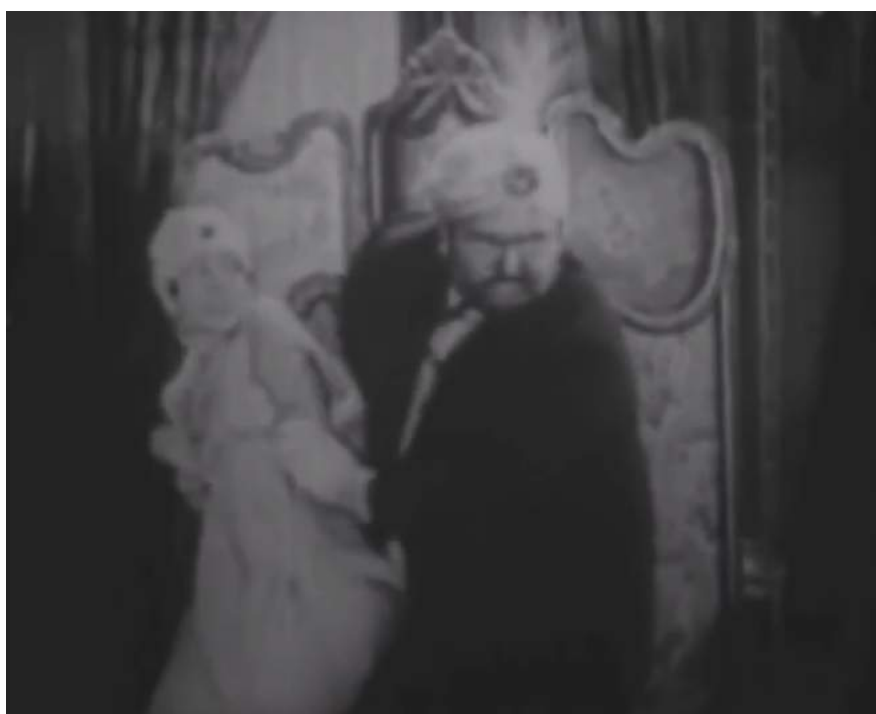
Illustration 5 : A Harem Knight , le cheikh forçant la jeune fille du harem à le suivre, 18:08.