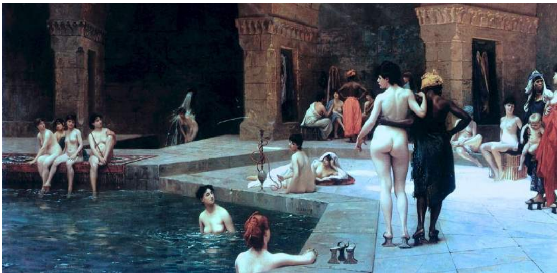
Illustration 2 : Grande piscine de Brousse , Jean Léon Gérôme, 1885, huile sur toile, collection particulière, Londres.

Nues sur cette toile, les baigneuses sont érotisées et le spectateur transgresse leur intimité rien que par le regard. Gérôme recrée ici, mais aussi sur nombreuses autres peintures l'Orient attendu par ses contemporains, renforçant le mythe sur la région 22 . L'Orient est synonyme de tentation : tentation de l'Ailleurs géographique, du fait de sa différence de peuples et de paysages mais aussi de la tentation féminine également 23 car souvent, on retrouve des représentations comme celles de Gérôme dans des bains ou des harems 24 . On retrouve dans la sphère culturelle américaine les tableaux de Frank Holman comme Fleur d'Orient ou les odalisques de Frederick Arthur Bridgman, comme Reclining Beauty .