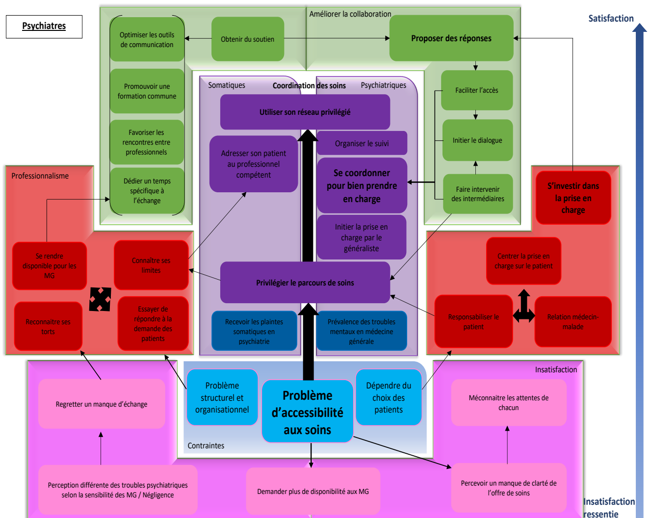
Figure 2 : Modèle explicatif pour les psychiatres

De manière générale, les psychiatres ont exprimé un sentiment de satisfaction sur la coopération avec les MG : P6 « Oh ben je n'ai pas de difficulté avec les médecins généralistes ». Certains, d'ailleurs, justifiaient de la qualité de leur relation par les retours positifs qu'ils ont reçu des MG : P4 « J'ai toujours un bon accueil. J'ai toujours le sentiment qu'ils sont heureux quand je les appelle ». Ils ont cependant pointé les contraintes et difficultés pouvant selon eux interférer dans rapports qu'ils entretiennent avec les MG.