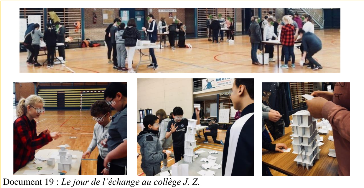
Document 19 : Le jour de l'échange au collège J. Z.