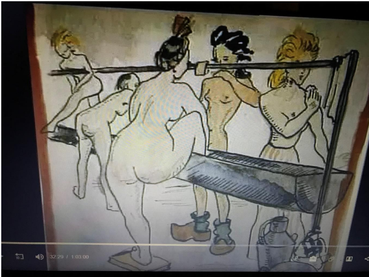
Figure 5. Dessin de 5 femmes se lavant à Rieucros, réalisée par Sylta Busse (capture d'écran à 32min 29 sec)

Source : Trempé, Rolande, Documentaire Un camp de femmes , produit par SCPAM Université Toulouse II-Le Mirail, France, 1994, 63min.