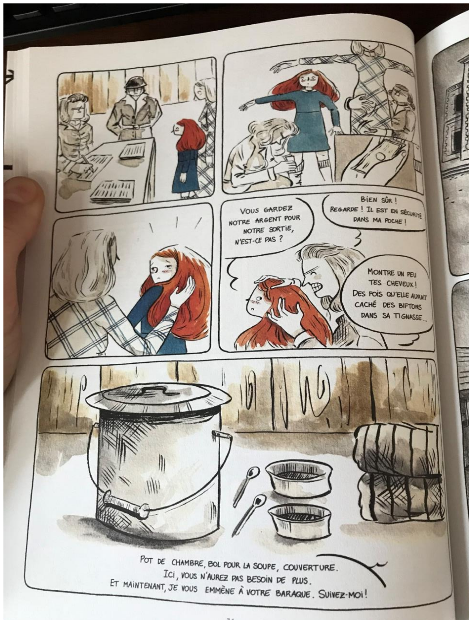
Figure 2. Planche de la BD C'est Aujourd'hui Dimanche , p36.