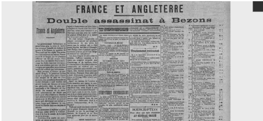
ANNEXE 6 : Capture d'un article de L'Intransigeant du 6 mars 1900