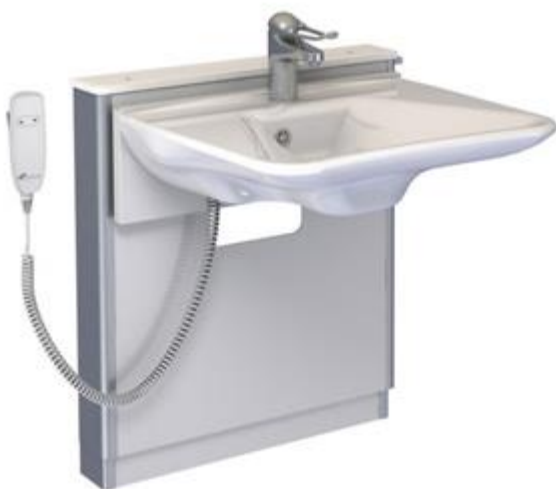
Figure 6 Lavabo réglable en hauteur

C'est pour cela qu'il existe des lavabos réglables en hauteur par commande électrique. Il est donc possible de pouvoir s'asseoir devant son lavabo et faire sa toilette sans risque. Certains meubles sous vasques de salle de bain ont un siège intégré que l'on peut tirer lorsque nous en avons besoin permettant ainsi d'optimiser les espaces restreints.