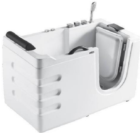
Figure 4 Baignoire à porte

L'installation d'une barre de maintien pour sortir du bain est aussi un outil intéressant. En effet, elle permet à la personne âgée de pouvoir se relever et sortir plus facilement de sa baignoire ou de sa douche.