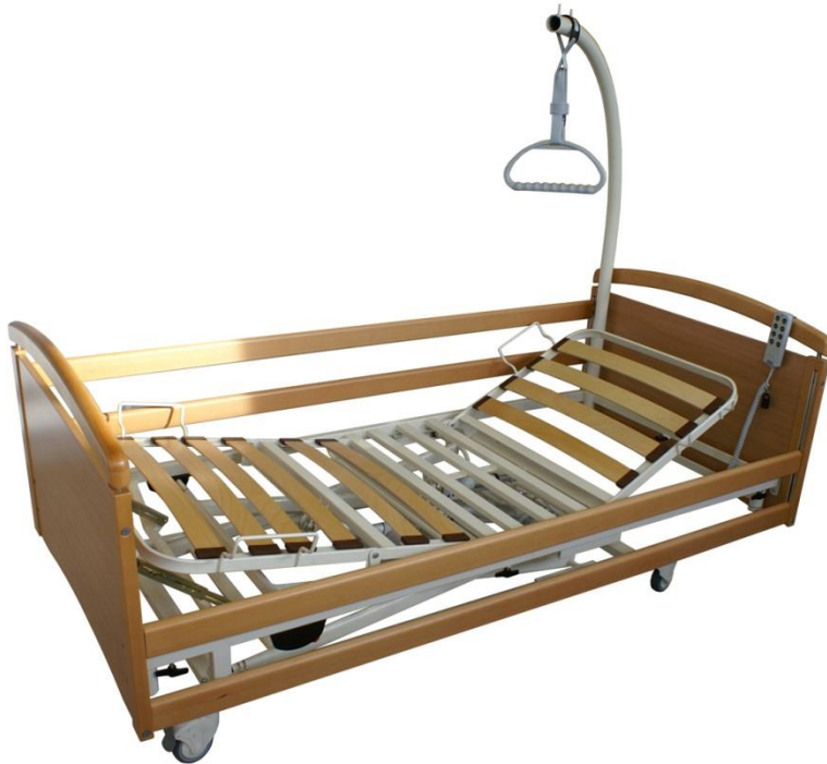
Figure 2 Lit médicalisé

Le lit doit être placé de façon à ce que la personne âgée puisse accéder facilement à son déambulateur, sa canne ou son fauteuil roulant mais aussi sa table de chevet et son fauteuil garde-robe.