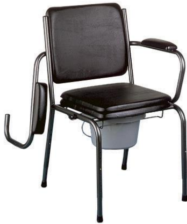
Figure 3 Fauteuil garde-robe