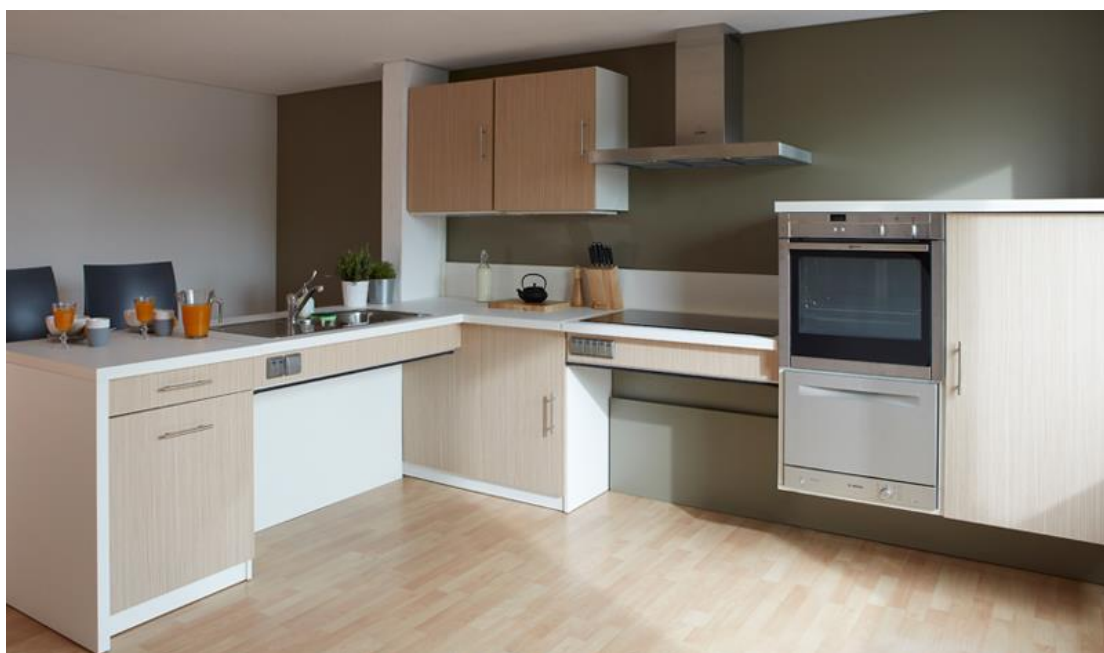
Figure 7 Cuisine adaptée aux seniors

Le plan de travail doit être pensé pour pouvoir s'asseoir en cuisinant de façon à éviter les chutes dues aux étourdissements. La pierre est à privilégier puisque elle est résistante au chaud. Il est donc possible de poser directement ses plats qui sortent du four ou de la plaque de cuisson directement sur le plan de travail.