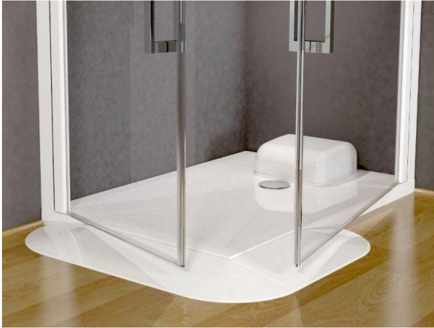
Figure 5 Receveur avec pompe de relevage

Les lavabos peuvent aussi être à risque pour une personne âgée qui n'a plus la même mobilité qu'avant. En effet, rester debout dans la même position peut s'avérer compliqué voire impossible pour une personne présentant diverses douleurs.