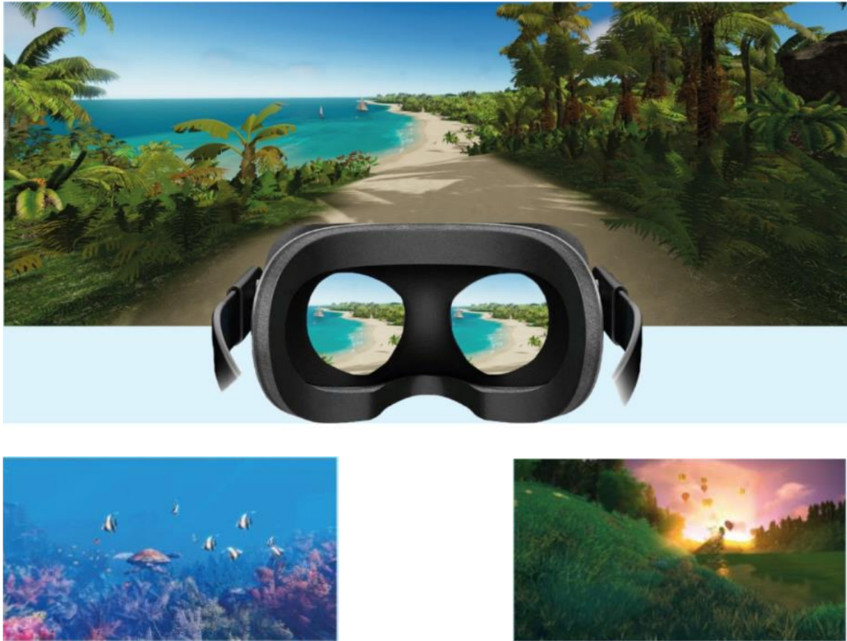
Figure 2. Paysages virtuels du logiciel HypnoVR®.