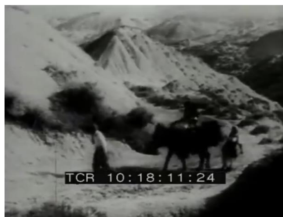
De la gauche vers la droite. Fig. 12 (plan n°3, 00'00'40) et 13 (plan n°5, 00'00'58) – Lamento funebre , Michele Gandin, 1954