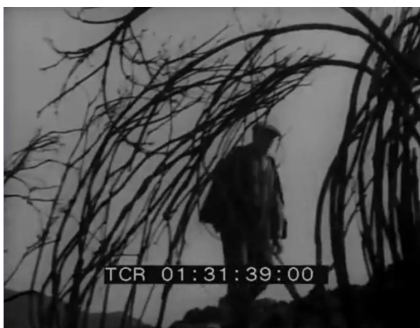
Un paysan pris dans les « griffes de la Nature ». Fig. 18 (plan n°7, 00'00'32) – I maciari , Giuseppe Ferrara, 1962.

I maciari (Giuseppe Ferrara, 1962) s'ouvre sur un plan très court faisant découvrir au spectateur un pont de pierre traversant une rivière presque asséchée. Un homme entre dans le plan et traverse le pont. Il se rend chez « Zio Giuseppe », l'un des sorciers habitant ces montagnes. Le plan se clôt sur un zoom très rapide vers un gigantesque rocher surplombant la vallée, accompagné par la musique de Werther Pierazzuoli, qui confère aux images un caractère étrange et inquiétant. Dans un plan suivant, l'homme avance sur un sentier envahi par de hauts arbustes aux branches épineuses. Puis, filmé en contre-plongée, il gravit une colline. Littéralement pris dans les « griffes de la Nature », sa silhouette est filmée au travers d'une végétation hostile, qui semble déjà morte avant d'avoir atteint l'âge de la maturité [Fig. 18].