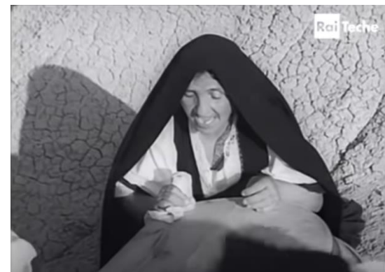
De la gauche vers la droite. Fig. 53 (plan n°67, 00°12'25) et 54 (plan n°66, 00°12'18) – Magia lucana , Luigi Di Gianni, 1958.

Plusieurs plans similaires de Lamento funebre et de Magia lucana .