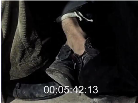
Le pied agité d'un paysan jouant aux cartes. Fig. 30 (plan n°27, 00'05'42) – L'inceppata , Lino Del Fra, 1960.