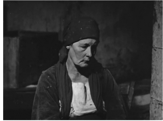
De la gauche vers la droite, les paysans de San Cataldo. Fig. 23 (plan n°5, 00'01'33) et 24 (plan n°14, 00'02'33) – Nascita e morte nel Meridione , Luigi Di Gianni, 1959.

Ces paysans attendent, prisonniers de leurs conditions. Cette attente peut acquérir un double sens ; d'abord, ils attendent que « quelque chose se passe » là où « se produit quelque chose seulement si quelqu'un naît, ou si quelqu'un meurt 284 ». Or, « à San Cataldo – nous dit la voix off – on vient au monde en silence 285 . » Ce silence, c'est celui que leur a imposé l'histoire : ces paysans qui habitent des espaces oubliés par les pouvoirs et par l'histoire, sont dans l'attente d'être libérés du silence dans lequel ils sont contraints de rester, imposé par le régime fasciste italien, et perpétué par le parti démocrate chrétien qui lui succède. C'est précisément ce que Pasolini dénonce dans les années 1970, lorsqu'il écrit que « le régime démocrate-chrétien était encore la continuation pure et simple du régime fasciste », et parlait d'un « fascisme [...] nouveau 286 » voire d'un « génocide » pour désigner un « mouvement général de dépérissement culturel 287 » généré par un régime « qui s'en prend aux valeurs, aux âmes, aux langages, aux gestes, aux corps du peuple 288 . » Ainsi, contraints à la passivité, ces êtres attendent que le reste du monde se rende compte de leur existence et de celle de leur culture en dépérissement , et qu'ainsi une place dans l'histoire leur soit attribuée.