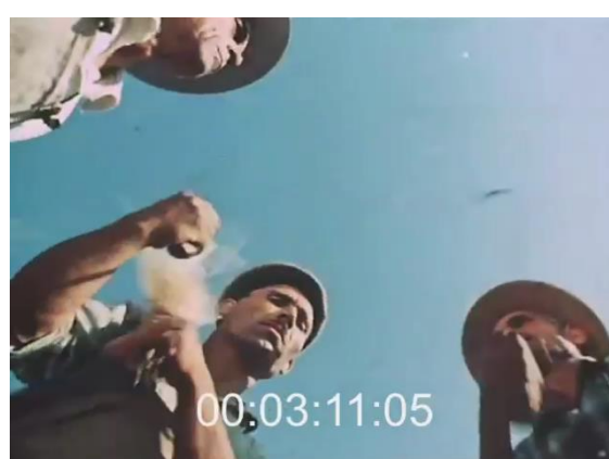
Fig. 45 (plan n°55, 00'07'58) – Stendalì (suonano ancora) , Cecilia Mangini, 1959 et 46 (plan n°19, 00'03'11) – La Passione del grano , Lino Del Fra, 1960.

Plusieurs plans similaires de Stendalì et de La Passione del grano .