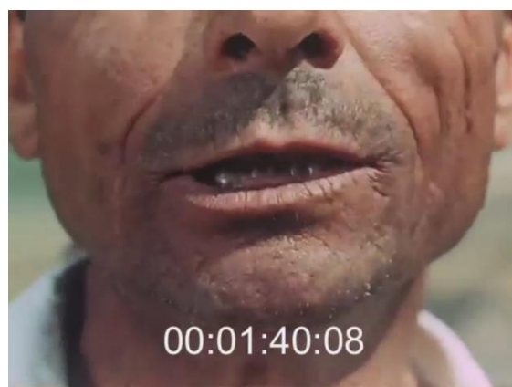
Fig. 43 (plan n°25, 00'04'33) – Stendalì (suonano ancora) , Cecilia Mangini, 1959 et 44 (plan n°4, 00'01'40) – La Passione del grano , Lino Del Fra, 1960