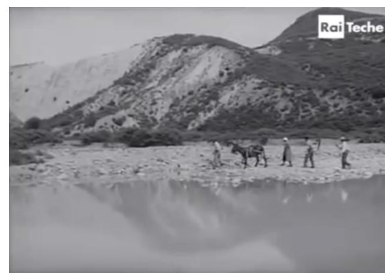
De la gauche vers la droite. Fig. 14 (plan n°20, 00'05'08) et 15 (plan n°24, 00'05'57) – Magia lucana , Luigi Di Gianni, 1958