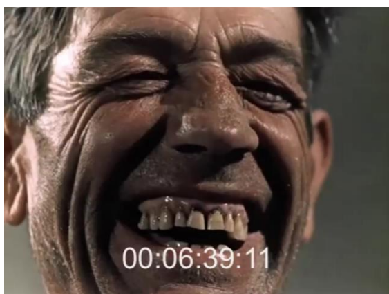
L'éclat de rire d'un paysan. Fig. 37 (plan n°36, 00'06'38) – L'inceppata , Lino Del Fra, 1960.

Dans L'inceppata , Lino Del Fra s'arrête sur les visages des paysans jouant aux cartes après leur journée de travail. En particulier sur l'un d'eux en train de rire [Fig. 37], tandis que la voix off nous dit qu'« avec le jeu, [ces paysans peuvent] finalement [s']imposer aux autres, non plus subir 303 . » Son expression laisse apparaître sa dentition usée et fait disparaître ses yeux noirs dans les plissures de ses rides.