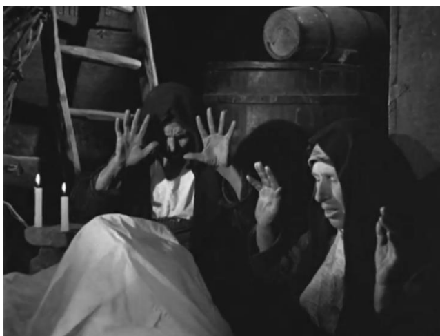
Pleureuses effectuant une lamentation funèbre.

Quant à la représentation de la veille funèbre, ce sont deux femmes qui se recueillent sur le corps d'un homme couché sur une table et caché sous un drap blanc [Fig. 55]. Leurs corps restent immobiles. Seules leurs mains s'actionnent : leurs doigts se replient répétitivement sur leurs paumes, tandis que leurs lèvres marmonnent des prières.