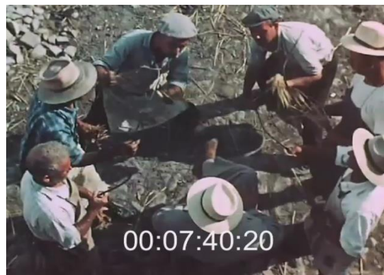
Fig. 41 (plan n°22, 00'03'57) – Stendalì (suonano ancora) , Cecilia Mangini, 1959 et 42 (plan n°46, 00'07'40) – La Passione del grano , Lino Del Fra, 1960