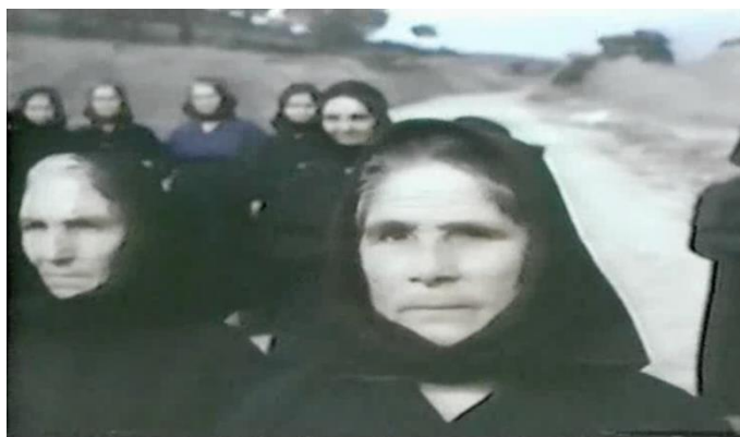
Le groupe de femmes rejoignant le corps du tarentulé.