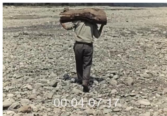
De la gauche vers la droite. Fig. 16 (plan n°13, 00'03'45) et 17 (plan n°15, 00'04'08) – L'inceppata , Lino Del Fra, 1960

Les paysages arides de Lucanie, arpentés par les paysans.