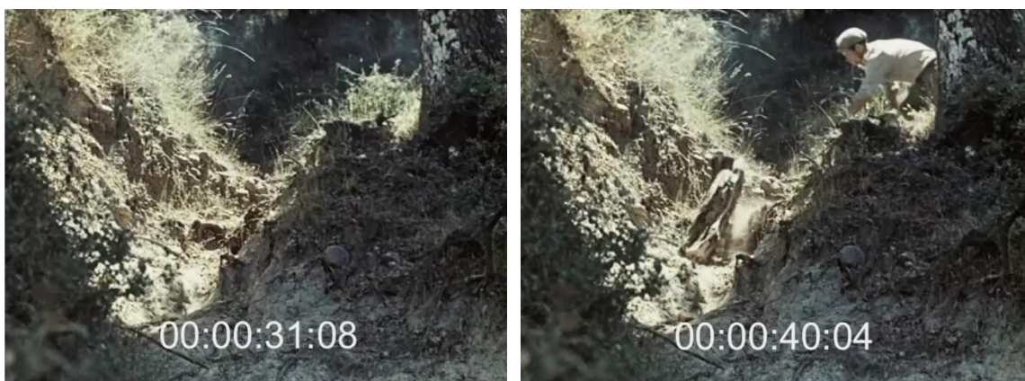
De la gauche vers la droite, l'homme surgissant dans le cadre comme un animal sauvage. Fig. 35 (plan n°1, 00'00'31) et 36 (plan n°1, 00'00'40) – L'inceppata , Lino Del Fra, 1960.

L'apparition fulgurante dans le cadre de ce corps engagé dans le rite s'apparente à un cri silencieux. Le paysan, dans toute la puissance de la pratique de sa propre culture, se révèle alors au spectateur et semble dire au nom de tous ses semblables « nous sommes là ». Lino Del Fra renouvelle ce schéma dans les premières secondes de L'inceppata : le jeune homme à la souche surgit dans le cadre comme un animal sauvage. Le plan présente un sentier de terre argileuse éclairé par un rayon de soleil passant entre les feuillages. De derrière un tronc de chêne recouvert de lichen, l'homme surgit à quatre pattes, propulsant brutalement la souche vers le chemin [Fig. 35 et 36]. Le peuple semble apparaître ici dans toute sa dimension « sauvage », il y a ici quelque chose de primitif, d'animal.