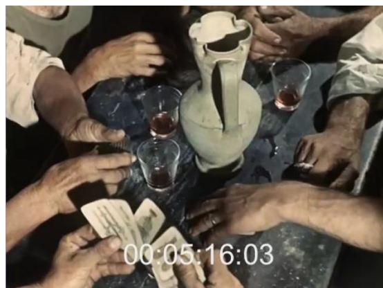
De la gauche vers la droite, les mains des paysans jouant aux cartes. Fig. 28 (plan n°21, 00'04'50) et 29 (plan n°23, 00'05'16) – L'inceppata , Lino Del Fra, 1960.

Dans un plan suivant, en légère plongée, Lino Del Fra cadre la surface de la table, où se trouve au milieu le pichet de vin, entouré de quelques verres presque vides. Une