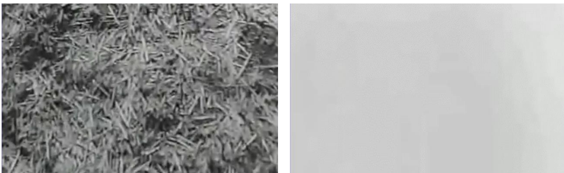
De la gauche vers la droite, premier plan du film. Fig. 19 (plan n°1, 00'01'10) et 20 (plan n°1, 00'01'14) – La Taranta , Gianfranco Mingozzi, 1961.

Caméra à l'épaule, Ugo Piccone, opérateur de Mingozzi, filme à ses pieds la terre labourée d'un champ parsemé de cadavres de pousses de blé, laissés sur place après la dernière moisson [Fig. 19]. Par un mouvement de caméra sec et rapide vers le haut, il s'arrête sur un ciel nu [Fig. 20]. Ainsi s'ouvre La Taranta (Gianfranco Mingozzi, 1961). Dès les premières images, le ton est donné. Par le biais d'un geste poétique, le spectateur est prévenu : le film traitera des survivances d'un monde entre ciel et terre, entre profane et sacré, entre croyances catholiques et païennes, en l'occurrence, le tarentisme. S'en suit un panoramique sur un désert de cailloux sans aspérités, se perdant jusqu'à l'horizon, flouté par un nuage de poussière stagnant au-dessus du sol.