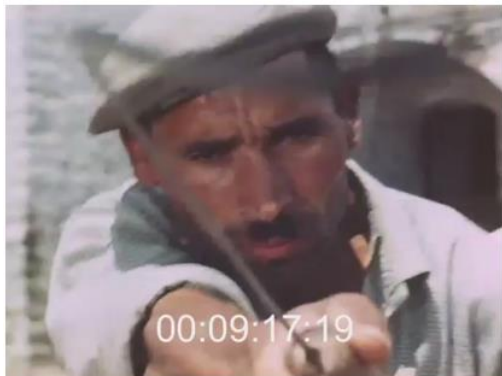
De haut en bas, la colère des paysans. Fig. 4 (plan n°63, 00'08'67), 5 (plan n°67, 00'09'14) et 6 (plan n°69, 00'09'17) – La Passione del grano , Lino Del Fra, 1960.

Ici, Lino Del Fra représente une communauté paysanne en colère, soudée face à son bourreau, prête à se mutiner. Mais cet éclat de colère est rapidement réfréné. Les paysans sont animés par une violence qu'ils doivent domestiquer, maîtriser. Ici, c'est en réalité la représentation d'une communauté paysanne incapable de s'émanciper car rien ne lui permet d'y croire, ni même d'en rêver. Ainsi, le rite et ses règles agissent comme