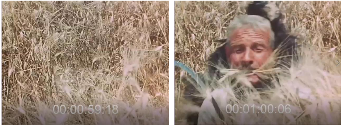
De la gauche vers la droite, le « bouc » surgissant dans le cadre par le bas. Fig. 33 (plan n°1, 00'00'59) et 34 (plan n°1, 00'01'00) – La Passione del grano , Lino Del Fra, 1960.

L'apparition fulgurante dans le cadre de ce corps engagé dans le rite s'apparente à un cri silencieux. Le paysan, dans toute la puissance de la pratique de sa propre culture, se révèle alors au spectateur et semble dire au nom de tous ses semblables « nous sommes là ». Lino Del Fra renouvelle ce schéma dans les premières secondes de L'inceppata : le jeune homme à la souche surgit dans le cadre comme un animal sauvage. Le plan présente un sentier de terre argileuse éclairé par un rayon de soleil passant entre les feuillages. De derrière un tronc de chêne recouvert de lichen, l'homme surgit à quatre pattes, propulsant brutalement la souche vers le chemin [Fig. 35 et 36]. Le peuple semble apparaître ici dans toute sa dimension « sauvage », il y a ici quelque chose de primitif, d'animal.