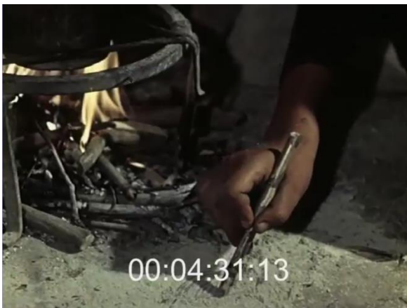
La main de la jeune fille. Fig. 27 (plan n°17, 00'04'31) – L'inceppata , Lino Del Fra, 1960.

Alors que l'homme s'achemine vers la maison de sa bien-aimée, portant la souche sur ces épaules (cf. « 6.1. Le paysage méridional occupé : habiter la nature »), Lino Del Fra nous donne à voir l'attente de la jeune fille, enfermée, en compagnie de sa mère, entre les quatre murs de son lieu d'habitation dont les volets sont fermés. Avec elles, cinq hommes – dont l'un doit être le père – se sont réunis pour jouer aux cartes, et « font semblant de rien 295 ». La jeune fille tourne en rond, cherche à « remplir ces heures d'une manière ou d'une autre, faire quelque chose qui [l']aide à cacher [ses] sentiments 296 » et se dédie à quelques tâches ménagères, sous l'œil attentif de sa mère, qui veille à ce que les règles du rite soient minutieusement respectées (la jeune fille ne doit pas regarder dehors). Les hommes discutent en partageant un verre de vin. Des doigts pianotent sur la table, tandis que d'autres s'agitent dans l'air, accompagnant la parole de leur propriétaire. Puis, un premier gros plan sur une main vient rompre l'usage répétitif des plans moyens qui nous permettent de situer les personnages dans l'espace clos. C'est ici la jeune fille, dont la main boursouflée tenant un petit bâton, dessine ce qui semble être un œil – en tout cas une forme en amande –, dans les cendres froides de la cheminée [Fig. 27]. Cette main appartient à un corps directement impliqué dans le rite, puisqu'elle est la destinataire de la souche.