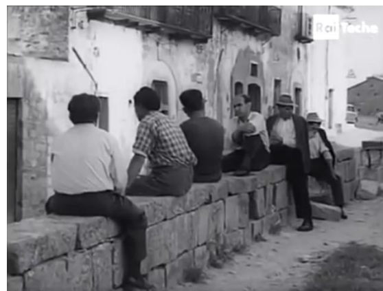
De la gauche vers la droite, des paysans occupant les ruelles d'un village lucanien. Fig. 25 (plan n°37, 00'08'06) et 26 (plan n°40, 00'08'23) – Magia lucana , Luigi Di Gianni, 1958.