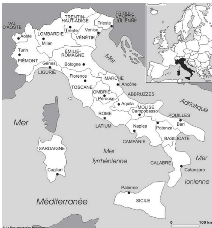
Fig. 1. Carte de l'Italie

Sardaigne [Fig. 1]. En revanche, ses frontières sont parfois repoussées plus au Nord, englobant également le Molise, les Abruzzes, ainsi que le Latium dit « méridional ».