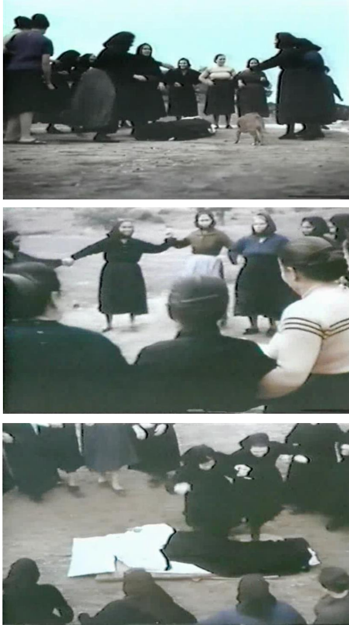
De haut en bas, la ronde se forme autour du tarentulé. Fig. 7 (plan n°34, 00'04'14), 8 (plan n°40, 00'05'02) et 9 (plan n°44, 00'05'28) – Il ballo delle vedove , Giuseppe Ferrara, 1962.

caméra : les femmes s'écartent pour que ne pas cacher la visibilité. Nous percevons le mouvement d'hésitation de l'une d'entre elles, cherchant sa place dans la ronde qui se forme [Fig. 7]. Puis, les femmes s'attrapent par les bras et commencent à tourner [Fig. 8].